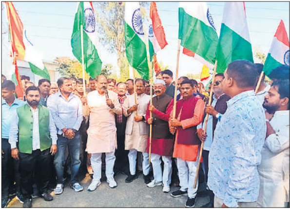
भुता में पदयात्रा निकालते भाजपाई।