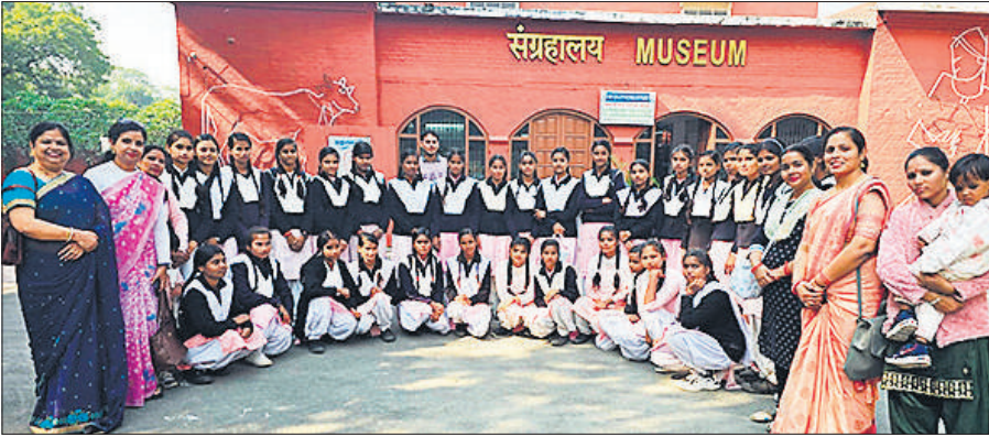
राजकीय हाई स्कूल क्योलड़िया, भदपुरा के विद्यार्थियों का शैक्षिक भ्रमण।