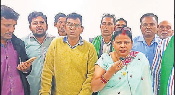
बैठक को सम्बोधित करती आम आदमी पार्टी नेता।

से सहयोग किया। भ्रमण के दौरान विद्यार्थियों ने उत्साहपूर्वक विभिन्न विभागों का अवलोकन किया और अपनी जिज्ञासाओं के समाधान