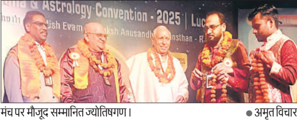
मंच पर मौजूद सम्मानित ज्योतिषगण।

देहरादून, अमृत विचार : मुख्यमंत्री पुष्कर सिंह धामी ने युवाओं से अपील की है कि वे स्वयं भी नशे को पूरी मजबूती के साथ न करें और साथ ही अपने साथियों को भी नशे के लिए न कहने के लिए प्रेरित करें। मंगलवार को मुख्य सेवक सदन में आयोजित नशामुक्त भारत अभियान की 5वीं वर्षगांठ के राज्यस्तरीय कार्यक्रम को संबोधित करते हुए मुख्यमंत्री ने नशामुक्त भारत अभियान के पांच वर्ष पूरे होने की बधाई देते हुए कहा कि नशे के खिलाफ लड़ाई में अग्रणी भूमिका निभाने वाले कर्मचियों के सहयोग से आज समाज नशे की भयावह समस्या से मुक्तबला करने में सक्षम हो रहा है। नशा केवल एक बुरी आदत नहीं, बल्कि समाज को भीतर से खोखला करने वाली एक भयावह चुनौती है। ये घातक प्रवृत्ति व्यक्ति की चेतना, विवेक और निर्णय लेने की क्षमता को नष्ट कर उसके पूरे भविष्य को विनाश की ओर ले जाती है।