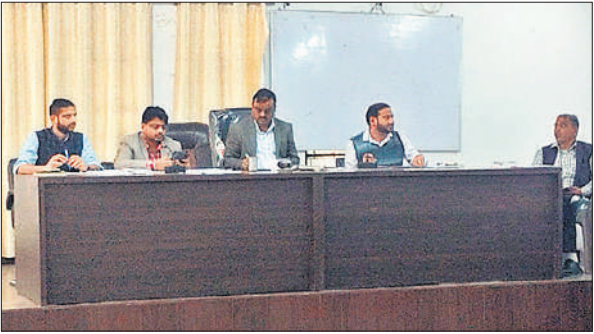
मीरगंज में बीएलओ के एसआईआर कार्यों की समीक्षा करते एसडीएम।