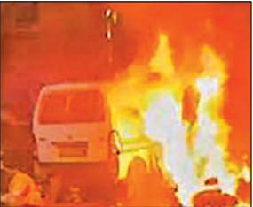
कार्यालय संवाददाता, लखनऊ

का सहयोग नहीं मिला है तो ऐसा क्यों और किन कारणों से हुआ। हर पीड़ित की त्वरित मदद की जाए। उन्होंने जमीन कब्जाने की शिकायतों