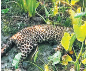
बरखेड़ा के पिपराखास में तालाब के किनारे पड़ा तेंदुआ।

बरखेड़ा ब्लाक क्षेत्र के गांव पिपराखास, जोकि सामाजिक वानिकी प्रभाग की बीसलपुर रेंज के अंतर्गत आता है, इसके ग्रामीण योजना की तरह मंगलवार सुबह तड़के खेतों की ओर आ-जा रहे थे। इसी बीच ग्रामीणों की नजर गांव के नजदीक ही तालाब किनारे एक तेंदुआ पर पड़ी। ग्रामीणों ने इसकी जानकारी गांव पहुंचकर अन्य ग्रामीणों को दी। सुबह करीब पांच बजे