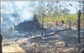
आग से जली झोपड़ी।

जिसके चलते धमाके के साथ चिंगारी नीचे आ गिरी और सीधे झोपड़ी पर पड़ते ही कुछ ही पलों में आग ने विकराल रूप ले लिया और झोपड़ी जलकर राख हो गई। पीड़ित किसान का झोपड़ी में रखा घरेलू सामान पूरी तरह से जल कर राख हो गया।