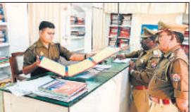
कैंट थाने का निरीक्षण करते एसपी सिटी।

साफ सफाई करने के निर्देश दिए। निरीक्षण के दौरान पंजीकृत मुकदमों की गुणवत्तापूर्ण विवेचना, लंबित विवेचनाओं की स्थिति, वारंट, समन तामीली, जनसुनवाई पोर्टल पर आने वाली शिकायतों का समय से निस्तारण करने के निर्देश दिए।