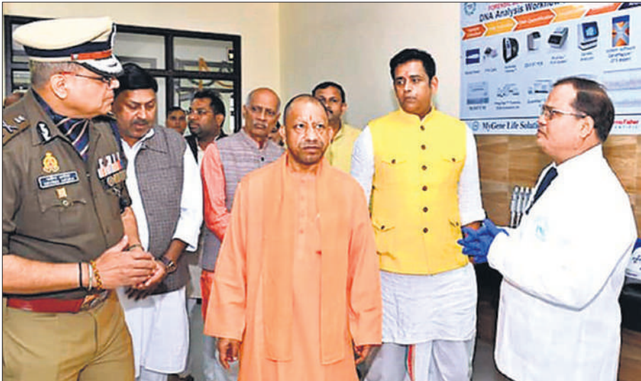
गोरखपुर के नवीन उच्चोक्त भवन के लोकार्पण कार्यक्रम में सम्मिलित होते मुख्यमंत्री योगी आदित्यनाथ।

योगी ने कहा कि आज प्रदेश सरकार की जीरो टॉलरेंस की नीति, वैज्ञानिक साक्ष्यों पर आधारित जांच और आधुनिक फॉरेंसिक साइंस लैब्स के जरिए