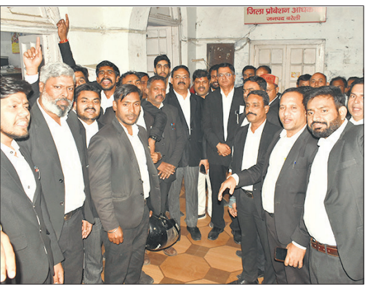
कलेक्ट्रेट में सिटी मजिस्ट्रेट कार्यालय के बाहर प्रदर्शन करते अधिवक्ता ।