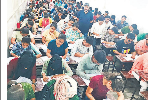
आधारित नोट पैटर्न पर ही होते हैं। बायोलॉजी टेस्ट सीरीज से हमारा मिशन बायो में 360 में से 360 अंक दिलाना होता है।