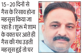
15-20 दिनों से गैस के रिसाव होना महसूस किया जा रहा है। शुरू में शाम के वक्त पर आते ही गैस की गंध उड़ती महसूस हुई तो घर की रसोई में रखे सिलेंडर और घर में स्पेयर में रखे सिलेंडर चेक किए, मोहल्ले वालों से गैस रिसाव होने पर चर्चा की लेकिन सब के घरों में सब कुछ ठीक मिला।

हालांकि महिलाएं अपनी रसोई का गैस का सिलेंडर चेक कर संतुष्ट होने में लगी हैं। गैस फैलते ही लोग घरों के बाहर निकलकर