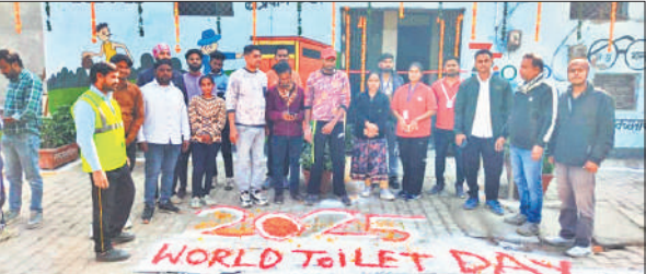
शौचालय के लोकार्पण के बाद मौजूद निगम के कर्मचारी व उपस्थित स्थानीय लोग।

जिन पांच स्थानों पर सामुदायिक शौचालय का लोकार्पण कराया गया उसमें कजरी सराय सामुदायिक शौचालय बिहारों का मंदिर, पटपट