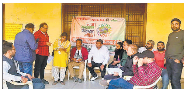
बैठक में अपनी बात रखते सदस्य व स्थानीय नागरिक।

बैठक में सभी सदस्यों ने वार्ड में स्वच्छता के विषय पर चर्चा की। सर्वसम्मति से तय किया गया कि वार्ड में स्वच्छता से संबंधित विषयों पर डोर टू डोर जाकर संपर्क कर निवेदन किया जाएगा कि कोई भी नागरिक सार्वजनिक स्थानों पर गंदगी नहीं करेगा और न दूसरों को करने देगा। समिति के सदस्यों ने एक स्वर से नगर निगम की अनुबंधित डोर टू डोर कूड़ा कलेक्शन कंपनी की कार्य प्रणाली पर सवाल खड़ा किया। कहा कि तीन-चार दिन में एक बार