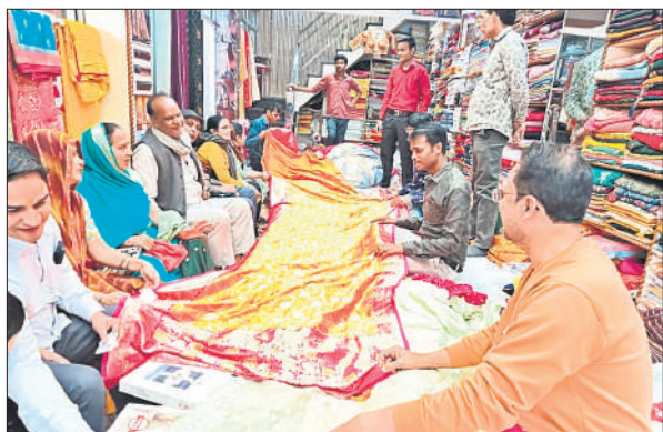
बाजार में खरीदारी करते लोग।