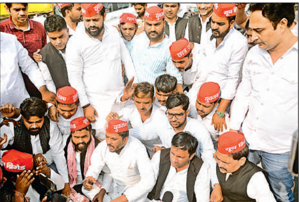
राजधानी के हजरतगंज में प्रदर्शन करते सपा कार्यकर्ता।

निर्माण नहीं बल्कि जल प्रबंधन की दक्षता, किसान हित, कृषि उत्पादन वृद्धि और ग्रामीण अर्थव्यवस्था की मजबूती है। उन्होंने कहा कि सरकार का लक्ष्य है कि प्रदेश का कोई भी किसान सिंचाई के अभाव में अपनी फसल प्रभावित न होने पाए।