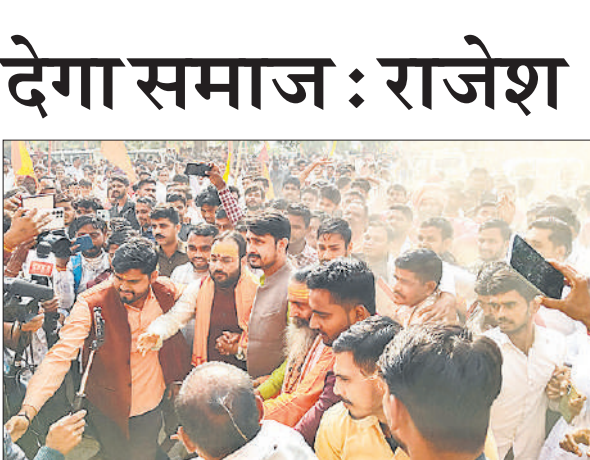
संभल के कैला देवी धाम पर परिक्रमा के लिए रवाना होने का प्रयास करते लोग।