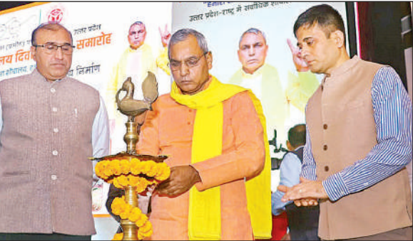
कार्यक्रम की शुरुआत करते पंचायती राज मंत्री ओपी राजभर और अन्य।