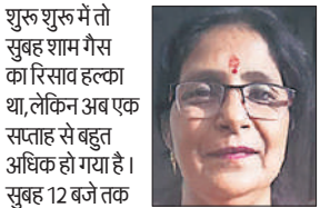
शुरु शुरू में तो सुबह शाम गैस का रिसाव हल्का था, लेकिन अब एक सप्ताह से बहुत अधिक हो गया है। सुबह 12 बजे तक और शाम को सात बजे से रात 11 बजे तक गैस का रिसाव तेज हो गया है। ऐसे में किसी बड़े हादसा होने का खतरा लगा रहता है।

संभावित खतरे को लेकर आपस में चर्चा करते नजर आए। बुजुर्गों और छोटे बच्चों को लेकर परिवारों में चिंता का माहौल बना हुआ है