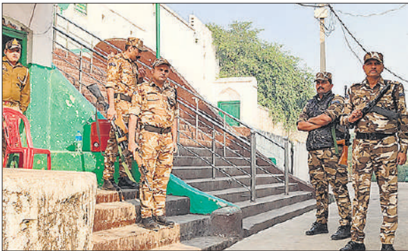
जामा मस्जिद परिसर के बाहर तेनात आरआरएफ के जवान।