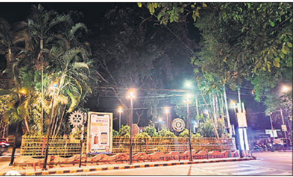
कांठ रोड पर हरियाली।