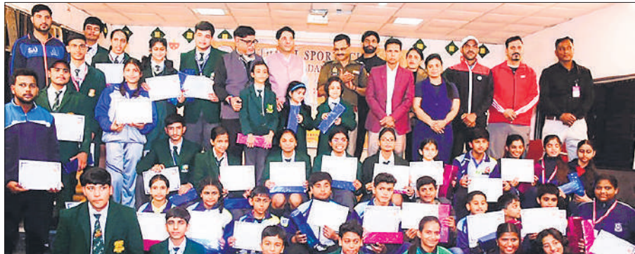
नेशनल स्पोर्ट्स क्लब के सदस्यों के साथ पुरस्कृत खिलाड़ी।