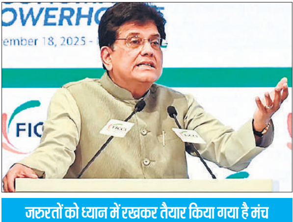
जरूरतों को ध्यान में रखकर तैयार किया गया है मंच

वाणिज्य एवं उद्योग मंत्री पीयूष गोयल ने कहा कि ट्रेड डेटेलिजेंस एंड एनालिटिक्स (टीआईए) मंच देश के आयातकों, निर्यातकों, स्टार्टअप और सूक्ष्म, लघु एवं मझोले उद्यमों (एमएसएमई) को नई जानकारीयां उपलब्ध कराएगा। केंद्रीय उद्योग मंत्री ने कहा कि यह मंच निर्यातकों को भारत द्वारा अब तक क्रियान्वित मुक्त व्यापार समझौतों (एफटीए) की बेहतर समझ प्रदान करेगा। वाणिज्य विभाग द्वारा तैयार ‘टीआईए’ मंच छोटे व्यवसायों के साथ-साथ कई वैश्विक एवं राष्ट्रीय ‘डेटाबेस’ को एकीकृत विश्लेषणात्मक मॉडल में एकीकृत करता है। यह 270 से