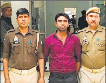
पुलिस की गिरफ्त में आरोपी।