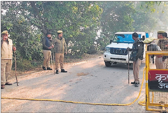
संभल की तरफ आने वाले रास्ते पर बैरियर लगाकर निगरानी करते पुलिस कर्मी।