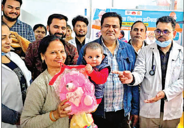
विजयी बेबी के साथ खड़ी स्वास्थ्य टीम व अभिभावक।