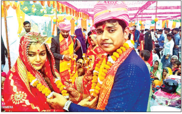
मुख्यमंत्री सामूहिक विवाह समारोह में फूल माला पहनाते वर-वधू।