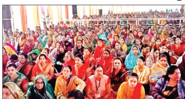
राम कथा में मौजूद भक्त गण ।