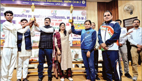
चैंपियनों को ट्रॉफी देकर सम्मानित करते मुख्य अतिथि।