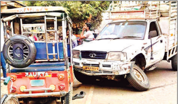
लोडर की भिड़ंत में क्षतिग्रस्त ई रिक्शा।