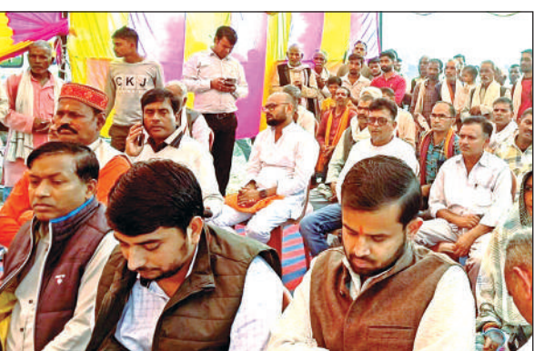
कार्यक्रम में मौजूद ग्रामीण।