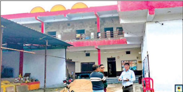
कालूपुर के एक प्रतिष्ठान में जांच करते लेबर डिपार्टमेंट के अधिकारी। अमृत विचार

मुख्यालय की ही बात की जाए तो कर्वी के सीतापुर से रामघाट, बस स्टैंड से बेड़ी पुलिया, शंभू बाबू पेट्रोल पंप से खोह रेहुटिया, शंकर बाजार सोनेपुर रोड, गंगा जी रोड में ही तमाम कामशियल भवन हैं, जिनका इस्तेमाल शादी और अन्य समारोहों के लिए किया जा रहा है। इसके अलावा मानिकपुर, राजापुर, मऊ, पहाड़ी, लालता रोड, बरगढ़ आदि में भी इन भवनों में लाखों की बुकिंग की जा रही है। लेकिन इनमें सुविधाएं क्या हैं, इसकी चिंता क्या किसी