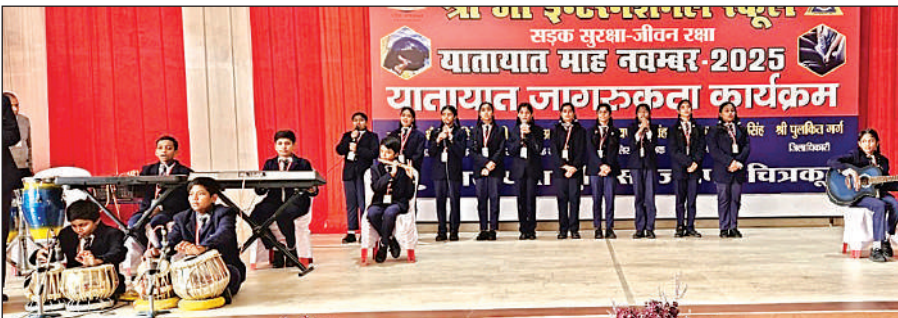
कार्यक्रम में अपनी प्रस्तुति देते बच्चे।

लावारिस हैं। इतनी ही धनराशि म्युचुअल फंड, जनरल इंश्योरेंस, लाइफ इंश्योरेंस, पेंशन फंड, बीमा कंपनी आदि में पड़ी हैं। बताया कि इनके वारिसों की तलाश जारी है। अभियान के तहत बैंकों की ओर से अनक्लेम्ड राशि जिन खातों जमा है, उनकी सूची के आधार पर वारिसों से संपर्क का प्रयास हो रहा है। कर्मचारियों को ग्राहकों के पते पर भी भेजा जा रहा है। कुछ लोग संबंधित पतों पर नहीं मिल रहे। इससे धनराशि असली उत्तराधिकारी तक पहुंचाने में दिक्कत आ रही है। अनक्लेम्ड राशि के दावों के निपटान के लिए केंद्र सरकार व आरबीआई के निर्देश पर 31 दिसंबर तक यह अभियान चलेगा। बैंक/अन्य वित्तीय संस्थान भी अपने स्तर से तलाश कर रहे हैं। ऐसे ग्राहक जिनको अंदेशा है कि उनके किसी संबंधी के खाते में अनक्लेम्ड राशि है, वे आरबीआई के उद्यम पोर्टल पर जानकारी ले सकते हैं। पोर्टल पर अपने मोबाइल नंबर से यूजर आईडी व पासवर्ड बनाना होगा।