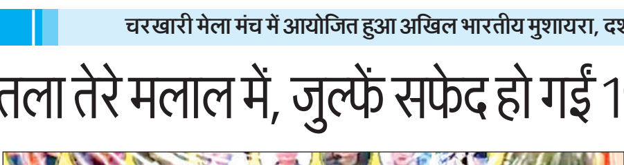
अखिल भारतीय मुशायरा में मौजूद नामचीन शायर।