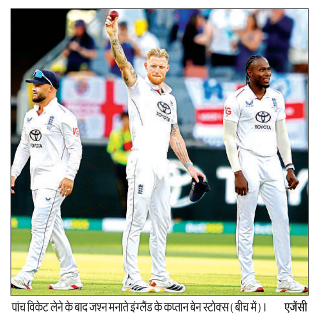
पांच विकेट लेने के बाद जश्न मनाते इंग्लैंड के कप्तान बेन स्टोक्स (बीच में)।

राइजिंग स्टार्स 2025 दोहा, भारत ए को बल्ले और गेंद से निराशाजनक प्रदर्शन का खामियाजा भुगतना पड़ा और राइजिंग स्टार्स एशिया कप के सेमीफाइनल में शुक्रवार को बांग्लादेश ए ने उसे सुपर ओवर में हरा दिया। बांग्लादेश ए का सामना अब पाकिस्तान शाहीस और श्रीलंका ए के बीच होने वाले दूसरे सेमीफाइनल के विजेता से होगा। फाइनल रविवार को खेला जाएगा। बांग्लादेश ए ने 20 ओवर में छह विकेट पर 194 रन बनाए। जवाब में भारतीय टीम का स्कोर भी बराबर रहा जिससे मैच पर यासिर अली का विकेट गंवाया गया। भारत ए सुपर ओवर में कप्तान जितेश शर्मा, आशुतोष शर्मा और रमनदीप