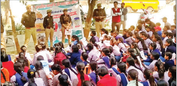
अत्र-अत्राओं को जानकारी देती पुलिस टीम।