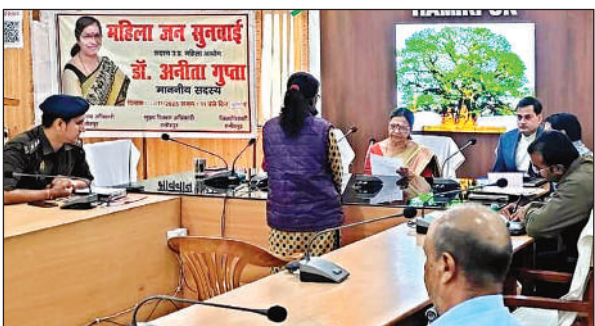
कलेक्ट्रेट में सुनवाई करतीं राज्य महिला आयोग की सदस्य।