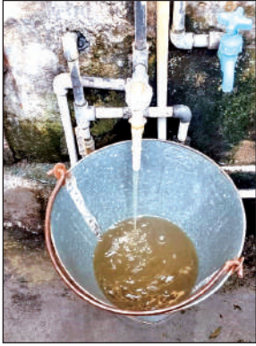
इंदिरानगर की पाइप लाइन में आ रहा गंदा पानी। ● अमृत विचार

का खतरा बढ़ गया है। उन्होंने चेतावनी दी कि यदि गंदे पानी की आपूर्ति बंद कर पाइप लाइनों की जांच जल्द नहीं की गई तो वे आम जनता के साथ उग्र आंदोलन