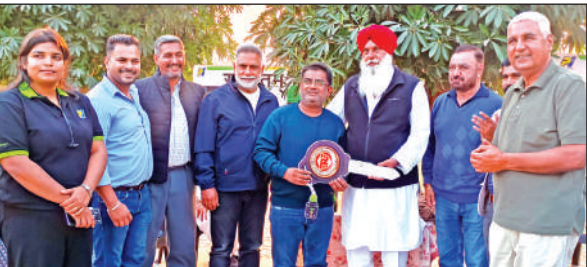
सितारगंज में लकी ड्रा विजेता को पुरस्कृत करते कंपनी पदाधिकारी।