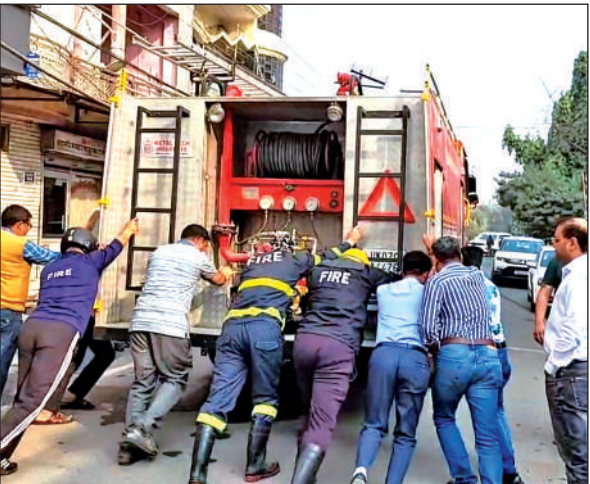
बंद हुई दमकल की गाड़ी को धक्का मारते लोग।

शुक्रवार की दोपहर को होली चौक निवासी 65 वर्षीय महिला के कपड़ों में अचानक आग लग