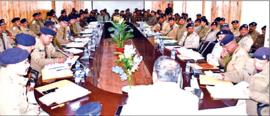
नैनीताल में मासिक अपराध समीक्षा बैठक में मौजूद जिले के पुलिस अधिकारी।

जनपद के विभिन्न थानों, चौकियों, यातायात और विशेष शाखाओं के कर्मचारियों को शामिल किया गया।