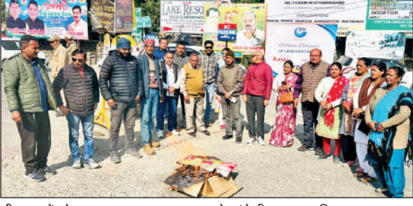
भीमताल में प्रदेश सरकार का पुतला दहन करते कांग्रेसी । ● अमृत विचार

कांग्रेस का कहना है कि सरकार ने कर्मचारियों की समस्याएं सुनने के बजाय डराने का रास्ता चुना है । कहा कि यदि सरकार ने इस काले कानून को वापस नहीं लिया तो कांग्रेस सड़क से लेकर विधानसभा तक बड़े स्तर पर आंदोलन करेगी । कांग्रेस कार्यकर्ताओं ने पुतला दहन कर एस्मा को तुरंत निरस्त करने