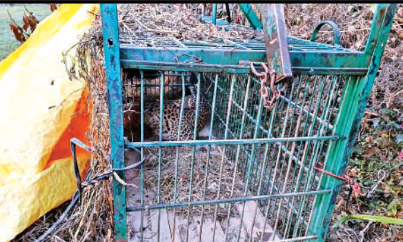
काशीपुर गोविशाण टीले पर लगे पिंजरे में कैद गुलदार।