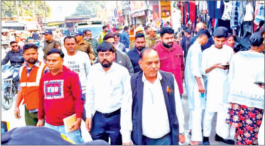
किच्छा में अतिक्रमण हटाती प्रशासन की टीम। ● अमृत विचार

उन्होंने कहा कि प्रथम चरण में व्यापारियों को चेतावनी दी जा