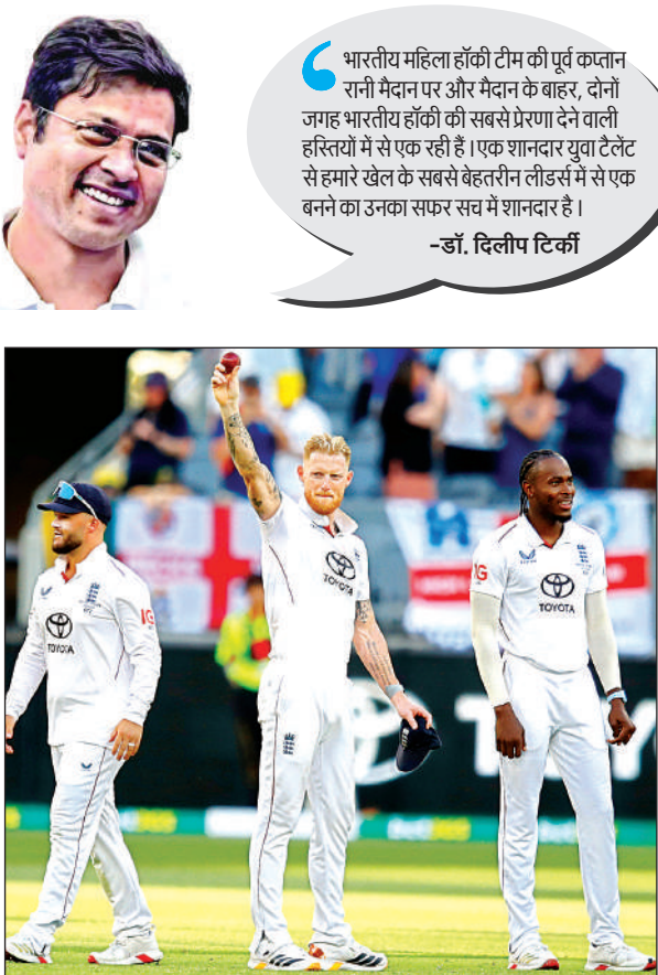
पांच विकेट लेने के बाद जश्न मनाते इंग्लैंड के कप्तान बेन स्टोक्स (बीच में)।

भारत ए को बल्ले और गेंद से निराशाजनक प्रदर्शन का खामियाजा भुगतना पड़ा और राइजिंग स्टार्स एशिया कप के सेमीफाइनल में शुक्रवार को बांग्लादेश ए ने उसे सुपर ओवर में हरा दिया। बांग्लादेश ए का सामना अब पाकिस्तान शाहीस और श्रीलंका ए के बीच होने वाले दूसरे सेमीफाइनल के विजेता से होगा। फाइनल रविवार को खेला जाएगा। बांग्लादेश ए ने 20 ओवर में छह विकेट पर 194 रन बनाए। जवाब में भारतीय टीम का स्कोर भी बराबर रहा जिससे मैच सुपर ओवर तक खिंच गया। भारत ए ने सुपर ओवर में कप्तान जितेश शर्मा, आशुतोष शर्मा और रमनदीप