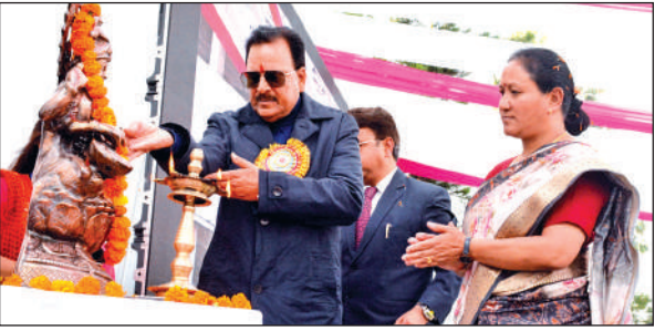
दीप प्रज्वलित करके कार्यक्रम का शुभारंभ करते सांसद अजय भट्ट।

सांसद भट्ट ने राष्ट्रीय स्तर पर विजेता सहित सभी बाल वैज्ञानिकों को बधाई दी। विज्ञान ड्रामा में उत्तरकाशी जनपद की राजकीय इंटर कॉलेज कवाएटहली ने प्रथम स्थान प्राप्त किया। स्कूल के विज्ञान ड्रामा का शीर्षक कल्पतरु की छांव में ग्रीन टेक्नोलॉजी था। द्वितीय स्थान पर विज्ञान ड्रामा में ऊधमसिंह नगर जनपद के गुरुकुल अकादमी इंटर कॉलेज खटीमा का नाटक सभी