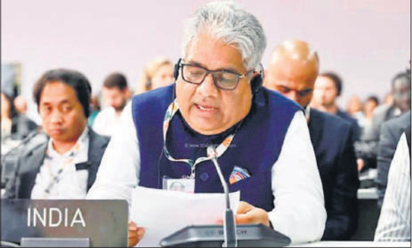
काँप 30 सम्मेलन के विशेष सत्र को संबोधित करते पर्यावरण मंत्री भूपेंद्र यादव।

वार्षिक जलवायु शिखर सम्मेलन काँप 30 के समापन से पहले भारत ने समानता और सीबीडीआर-आरसी पर आधारित एक न्यायसंगत परिवर्ती तंत्र पर जोर दिया और साथ ही जलवायु संबंधी कदमों के परिप्रेक्ष्य में अमीर देशों की ओर से लगाए गए एकतरफा व्यापार प्रतिबंधों की कठोर आलोचना की। केंद्रीय पर्यावरण, वन और जलवायु परिवर्तन मंत्री भूपेंद्र यादव ने कहा, एकतरफा कार्रवाई विशेष रूप से व्यापार-प्रतिबंध जलवायु उपाय, समानता और न्याय के सिद्धांतों को कमजोर करते हैं तथा एक निष्पक्ष और न्यायसंगत परिवर्तन को बाधित करने वाले कदम के रूप में कार्य करते हैं। यादव ने कहा कि भारत इस तंत्र की स्थापना के साथ बेलेम में एक महत्वाकांक्षी परिणाम की आशा करता है ताकि संधि और पेरिस समझौते को क्रियान्वित करने में एक महत्वपूर्ण कमी को दूर किया जा सके। उन्होंने कहा, हमें अब एक