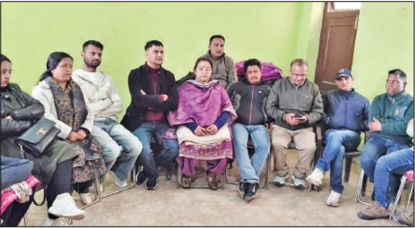
नैनीताल में बैठक कर विचार-विमर्श करते सभासद ।