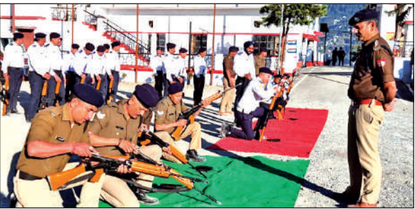
नैनीताल में रथफल खेलन के प्रदर्शन करते पुलिस के जवान।