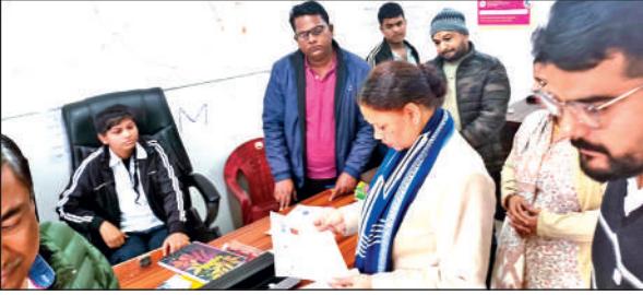
लालकुआं के सीएससी सेंटर में छापेमारी करते उप जिलाधिकारी व अन्य।

नैनीताल: पर्यटन सीजन देखते हुए एसएसपी ने जिले में बेहतर यातायात व्यवस्था बनाने के निर्देश दिए। कहा कि प्रभावी डाइवर्जन, स्टॉपिंग प्वाइंट, पार्किंग पर विशेष ध्यान रहे। वीकेंड पर सभी थाना/चौकी प्रभारी स्वयं ट्रैफिक मोर्चा सभालें। बेलबाबा से सुशीला तिवारी अस्पताल तक सड़क किनारे अनावश्यक वाहन खड़े न रहने दें। स्कूल खुलने और बंद होने के समय वीता मोबाइल को सक्रिय रखने का निर्देश दिए ताकि बच्चों की सुरक्षा सुनिश्चित की जा सके।