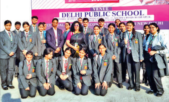
काशीपुर समर स्टडी हाल स्कूल के बच्चों के साथ अतिथि।