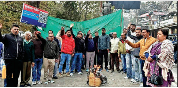
नैनीताल में सरकार का पुतला फूँकते कांग्रेस कार्यकर्ता ।