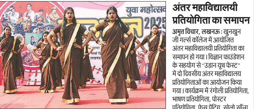
कार्यक्रम में सांस्कृतिक प्रस्तुति देती छात्राएं।