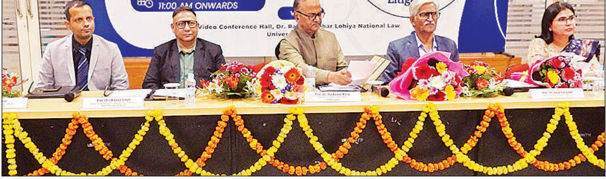
कार्यशाला में उपस्थित बीबीएयू के कुलपति, विधि विश्वविद्यालय के कुलपति व अन्य।