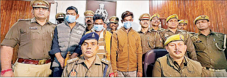
पुलिस की गिरफ्त में आरोपी।