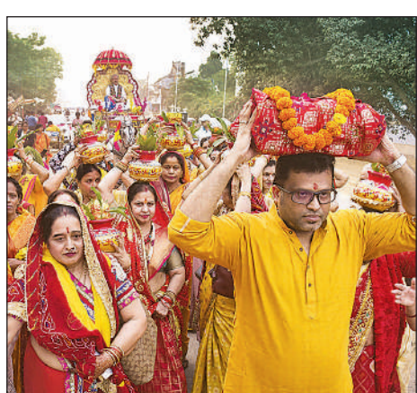
श्रीमद्भागवत कथा से पूर्व कलश यात्रा निकालते श्रद्धालु।