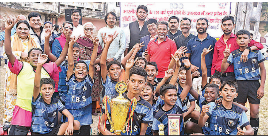
पदमश्री प. जमन लाल शर्मा मेमोरियल राज्य स्तरीय बालक हाकी प्रतियोगिता में विजयी टीम ट्राफी के साथ करनपुर की टीम।