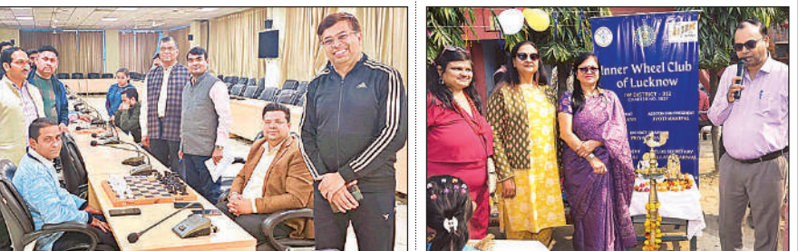
शतरंज प्रतियोगिता के दौरान मौजूद खिलाड़ी।

स्वास्थ्य केंद्र पर बच्चे को टीका लगाती स्वास्थ्य कर्मी।