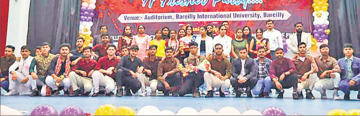
बरेली इंटरनेशनल यूनिवर्सिटी में फ्रेशर पार्टी के कार्यक्रम में अतिथियों के साथ विद्यार्थी।