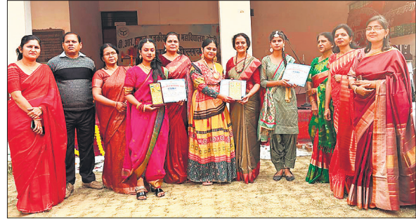
शिक्षकों के साथ उमंग की प्रतियोगिता की विजेता छात्राएं।