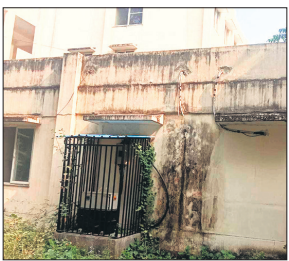
इस यूनिट में काटे गए तार।