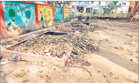
रामनोहर लोहिया पार्क में पड़ा कूड़ा।

अमृत विचार : शहरों में खुली हवा में समय बिताने और शुद्ध वातावरण के लिए लोग पार्कों में जाते हैं लेकिन शहर में कई पार्कों में बदहाल स्थिति होने की वजह से लोगों ने जाना ही छोड़ दिया है। कुछ पार्कों में गंदगी फैली रहती है। कुछ पार्कों में बैठने की जगह नहीं है तो किसी में कोई और समस्या है। इसकी वजह से लोग पार्क की जगह सड़क पर ही घूमते हैं।