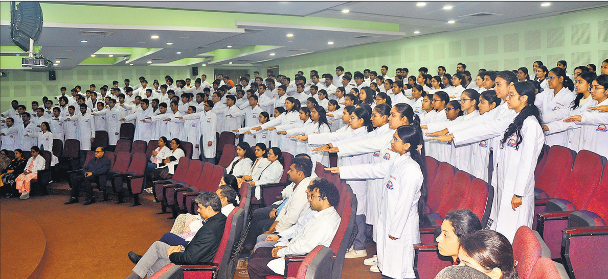
रोहिलखंड मेडिकल कॉलेज एंड हॉस्पिटल में व्हाइट कोट सेरेमनी में चरक शपथ ग्रहण करते एमबीबीएस के छात्र-छात्राएं।

वाले समय में एक अच्छे चिकित्सक बनेंगे। उन्होंने रोहिलखंड मेडिकल कॉलेज के चयन के रूप में प्रदेश के सर्वश्रेष्ठ मेडिकल कॉलेज का चयन किया है। उन्होंने बताया कि रोहिलखंड मेडिकल कॉलेज एक रैगिंग मुक्त संस्थान है। उन्होंने छात्र-छात्राओं से मरीजों के हित में अच्छे आचरण के साथ उनका उपचार बिना किसी भेदभाव से करने को कहा। प्रति कुलाधिपति