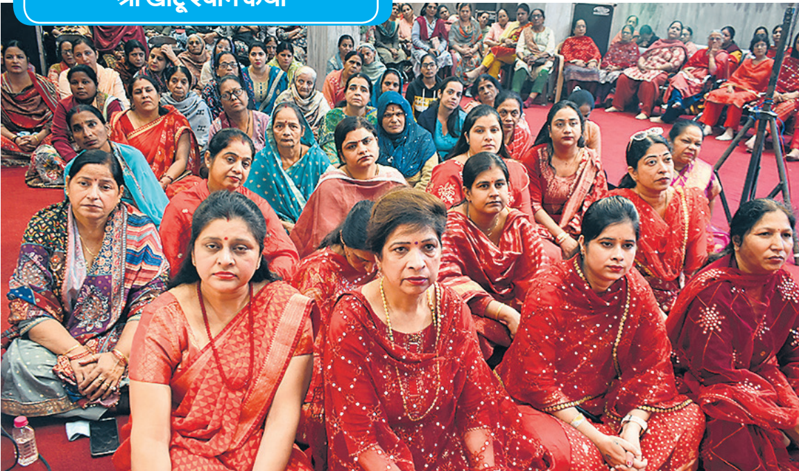
मॉडल टाउन स्थित श्री सनातन धर्म मंदिर में श्री खाटू श्याम कथा सुनते श्रद्धालु। (संबंधित खबर पेज-IV)