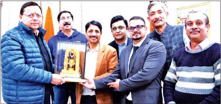
सीएम धामी से भेंट करता सिडकुल इंटरप्रन्योर वेलफेयर सोसाइटी पंतनगर का प्रतिनिधिमंडल।

मुख्यमंत्री ने कहा कि राज्य में उद्योगों को बढ़ावा देने के लिए उद्योगों के लिए अनुकूल नीतियां बनाई गयी हैं। उन्होंने सोसाइटी के प्रतिनिधियों से प्रदेश में उद्योगों को बढ़ावा देने में सहयोगी बनने की अपेक्षा करते हुए कहा कि, किच्छा