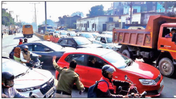
काठगोदाम में नरीमन तिरहे पर लगी वाहनों की लंबी कतार। • अमृत विचार

नगर पालिका की कूड़ा गाड़ी शनिवार सुबह भी रोजाना की तरह की काठगोदाम क्षेत्र के रानीबाग इलाके में कूड़ा कलेक्शन के लिए गई थी। सुबह करीब आठ बजे ये कूड़ा गाड़ी रानीबाग में एनसीसी के सामने खराब हो गई। कुछ देर तक