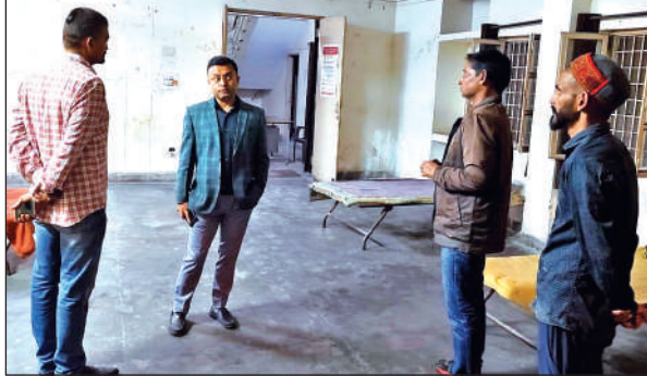
रैन बसेरा के निरीक्षण करते नगर आयुक्त परितोष वर्मा।

नगर आयुक्त परितोष वर्मा ने बताया कि वेंडर्स एसोसिएशन से जुड़े व्यवसायी समस्या को लेकर पहुंचे थे। उन्होंने बताया कि पुलिस की ओर से कार्रवाई कर उन्हें हटाया गया है। उनकी समस्या को लेकर पुलिस से वार्ता की जाएगी।