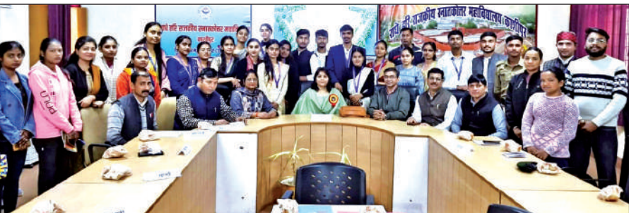
काशीपुर के राधे हरि महाविद्यालय में प्राचार्य के साथ छात्र छात्राएं।