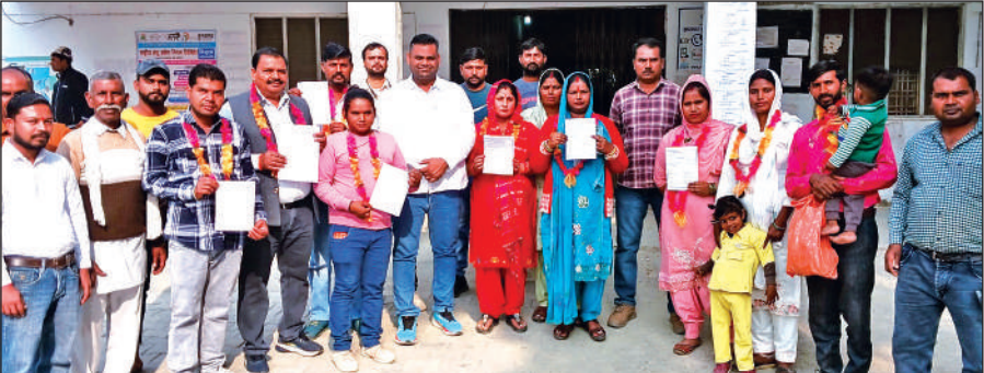
बाजपुर में मतगणना के बाद नवनिर्वाचित वार्ड सदस्यों का स्वागत करते उत्साहित समर्थक। ● अमृत विचार

त्रिस्तरीय ग्राम पंचायत में रिक्त पदों पर हुए चुनाव, सुरक्षा व्यवस्था का लिया जायजा संवाददाता, बाजपुर अमृत विचार: प्रदेश में पूर्व में संपन्न हुए त्रिस्तरीय ग्राम पंचायत चुनावों में कुछ ग्राम सभाओं में सदस्यों के पद रिक्त रह गए थे। इन्हीं रिक्त पदों पर बीस नवंबर को मतदान हुआ जिसमें शनिवार को कड़ी सुरक्षा व्यवस्था के बीच मतगणना करवाई गई। वहीं विजेता प्रत्याशियों का समर्थकों ने फूल-मालाएं पहनाकर जोरदार स्वागत किया।