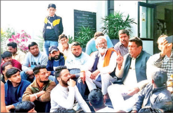
नगर निगम कार्यालय के बाहर नारायण पाल के नेतृत्व में प्रदर्शन करते फड़-ठेला कारोबारी।

अमृत विचार : नैनीताल रोड में ठेला-फड़ लगाकर आजीविका चलाने वाले व्यवसायियों ने पूर्व विधायक नारायण पाल के नेतृत्व में शनिवार को नगर निगम कार्यालय के बाहर विरोध प्रदर्शन किया और नगर आयुक्त परितोष वर्मा से मुलाकात की। इस दौरान नारायण पाल ने कहा कि नगर निगम की ओर से वैंडिंग जोन बनाने की बात कही गई थी और इसे लेकर वैंडिंग कार्ड भी बनाए गए हैं। लेकिन अब इन व्यवसायियों को परेशान कर कारोबार प्रभावित किया जा रहा है। मौखिक आश्वसन के बाद व्यवसायी माने। व्यवसायियों ने बताया कि वे अपनी आजीविका के लिए नैनीताल रोड पर ठेला लगाकर कारोबार करते हैं। लेकिन तीन दिन पूर्व एसएसपी के आदेश पर पुलिस ने नैनीताल रोड पर ठेला कारोबारियों पर चालानी कार्रवाई करते हुए उन्हें वहां से हटवाया। इसके विरोध में उन्होंने बीते गुरुवार को टंडी