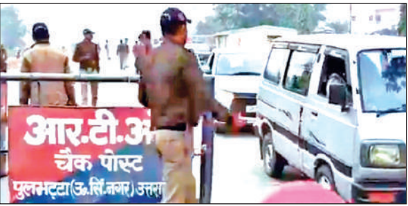
किच्छा में वाहनों की जांच करती पुलिस टीम।