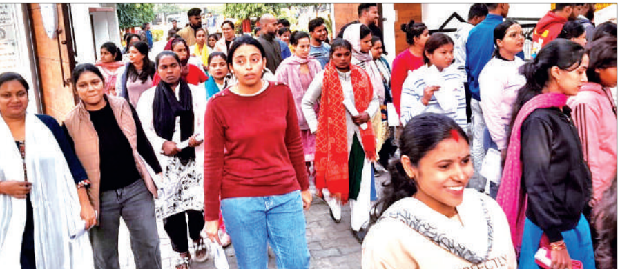
गुरुनानक इंटर कॉलेज से परीक्षा देकर बाहर निकलते अभ्यर्थी।