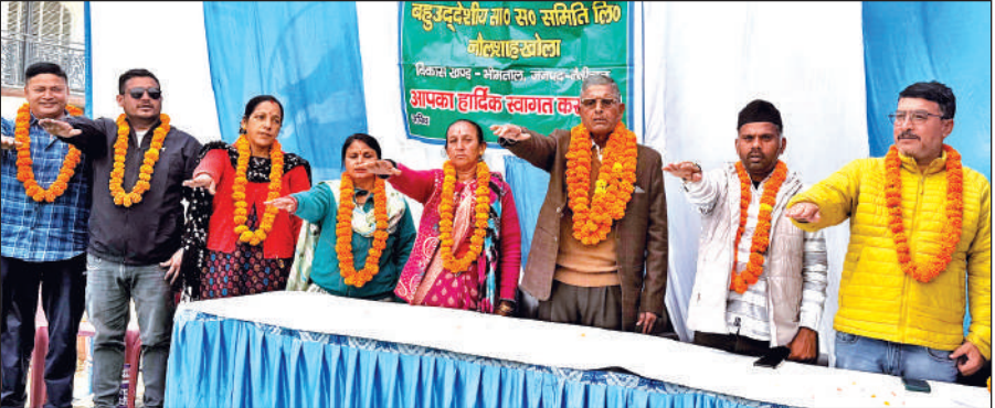
बहुदेशीय नौल शाखोला साधन सहकारी समिति में शपथ ग्रहण समारोह।