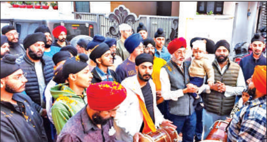
प्रभात फेरी के दौरान शबद-कीर्तन करते संगतजन। • अमृत विचार

हल्द्वानी : पब्लिक स्कूल एसोसिएशन की ओर से आर्डन प्रोग्रेसिव स्कूल, लामाचौड़ में जारी पीएसए इंटर स्कूल अंडर-14 क्रिकेट प्रतियोगिता के दूसरे दिन शनिवार को दो मुकाबले खेले गए। पहले मुकाबले में मेजबान आर्डन प्रोग्रेसिव स्कूल ने एआरपी स्कूल हल्द्वीच के खिलाफ पहले बल्लेबाजी करते हुए 199 रनों का लक्ष्य दिया। जवाब में एआरपी स्कूल की पूरी टीम 54 रन पर ही शिफ्ट गई। दूसरे मुकाबले में बिजडम स्कूल ने जिम कॉर्बेट स्कूल को 111 रनों का लक्ष्य दिया। जिम कॉर्बेट स्कूल ने एक विकेट खोकर लक्ष्य हासिल कर लिया।