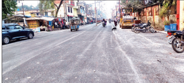
अतिक्रमण हटाने के बाद चौड़ी हुई सड़क।