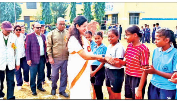
खटीमा में खो-खो प्रतियोगिता में खिलाड़ियों से परिचय प्राप्त करते अतिथि।