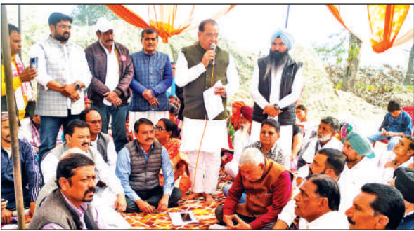
धरना प्रदर्शन में लोगों को संबोधित करते नेता प्रतिपक्ष यशपाल आर्य।

प्रहलाद पलिसिया पहुंचे नेता प्रतिपक्ष यशपाल आर्य ने धरना प्रदर्शन को अपना समर्थन देते हुए कहा कि, उत्तराखंड निर्माण एवं विकास में बंगाली समुदाय का भी विशेष योगदान है। पूरे प्रदेश में कमजोर वर्गों को भाजपा सरकार द्वारा उजाड़ने का कार्य किया जा रहा है। कांग्रेस के शासन में कहीं भी लोगों को बेदखल नहीं किया गया। 1989 तक जब उत्तर प्रदेश में