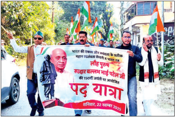
रामनगर में पदयात्रा निकालते भाजपा कार्यकर्ता।