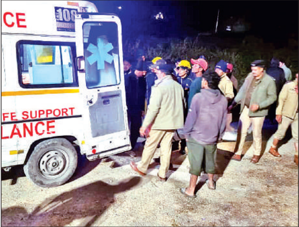
घायलों को एंबुलेंस से ले जाते पुलिस कर्मी। ● अमृत विचार

अमृत विचार: बारात में हंसी खुशी शामिल होने जा रहे शिक्षक नेताओं पर अचानक से मौत का झपट्टा लगा और हंसती खेलती तीन जिंदगियां पल भर में ही मौत की गोद में समा गईं। जबकि चौथा व्यक्ति गंभीर रूप से घायल है। अल्मोड़ा-हल्द्वानी हाइवे पर रातिघाट क्षेत्र में शनिवार रात हुए वाहन हादसे ने सभी को झकझोर कर रख दिया। जिसने भी यह समाचार सुना, वह शोक में डूब गया। बताया गया कि, चारों लोग हल्द्वानी में एक विवाह समारोह में शामिल होने के लिए अल्मोड़ा से एक्सयूवी से निकले थे। हाइवे पर रातिघाट क्षेत्र में अचानक