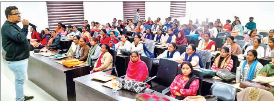
आंगनबाड़ी कार्यकत्रियों को जानकारी देते वक्ता। ● अमृत विचार