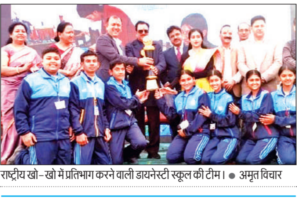
राष्ट्रीय खो-खो में प्रतिभाग करने वाली डायनेस्टी स्कूल की टीम।