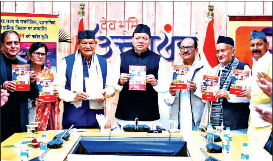
पुस्तक का विमोचन करते मुख्यमंत्री धामी, साथ में पूर्व राज्यपाल एवं पूर्व सीएम। ● अमृत विचार

मुख्यमंत्री ने कहा कि विद्यार्थियों को अपनी मातृभाषा में भाषा कंटेट,