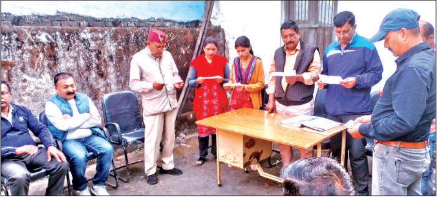
शपथ ग्रहण करते लाखन मंडी सहकारी समिति के नव निर्वाचित पदाधिकारी।

उन्होंने कहा कि लाखन मंडी किसान सेवा सहकारी समिति को आदर्श समिति बनाने के लिए टोस