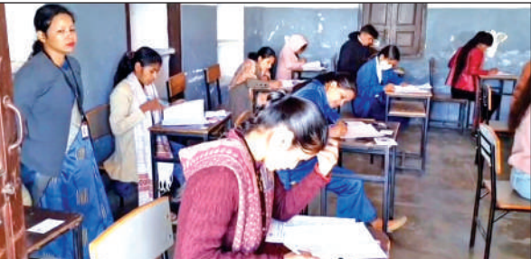
रामनगर स्थित एक केंद्र में डीएलएड परीक्षा देते परीक्षार्थी।