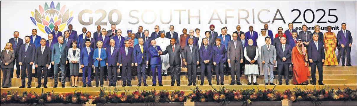
दक्षिण अफ्रीका के जोहान्सबर्ग में आयोजित जी-20 शिखर सम्मेलन में शामिल वैश्विक नेता।

उन्होंने कहा कि यह उनके लिए एक महान पल है, क्योंकि उनका मानना ​​है कि इससे ( अफ्रीकी) महाद्वीप में क्रांति आएगी। आमतौर पर घोषणा पत्र को जी20 नेताओं के शिखर सम्मेलन के अंत में अपनाया जाता है। हालांकि, इस बार इसे सम्मेलन की शुरुआत में ही स्वीकार कर लिया गया। लमोला ने शिखर सम्मेलन के शुरुआती चरण में ही घोषणा पत्र को अपनाए जाने के असामान्य घटनाक्रम पर कहा कि उन शेरपाओं ने घोषणा पत्र पर विचार-विमर्श किया और सहमति जता दी, जिन्हें इसे स्वीकार करना