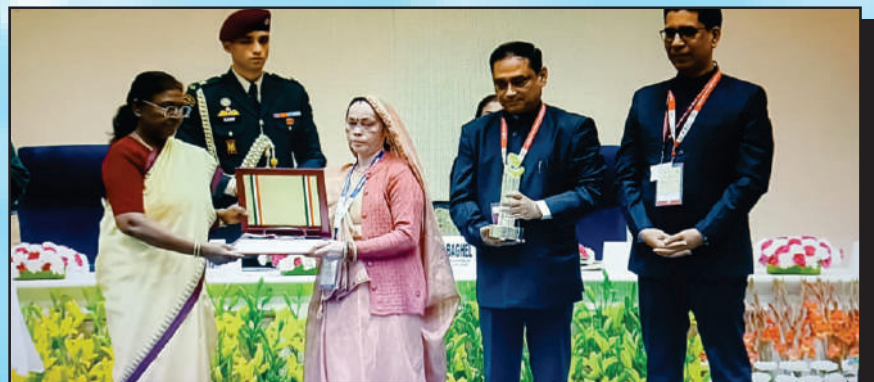
भरतौल की प्रधान प्रवेश कुमारी को बाल हितैषी पंचायत का राज्य पुरस्कार मिला