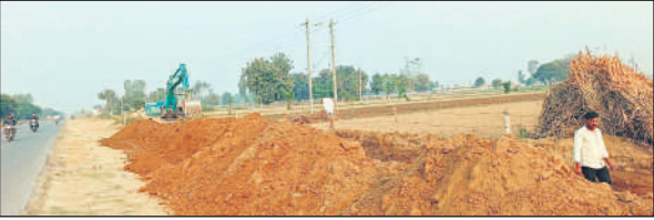
सड़क को चौड़ा करने के लिए खुदाई करती जैसीबी मशीन।

मथुरा से बरेली तक 530-बी राष्ट्रीय राजमार्ग बदायूं जिले से होकर निकल रहा है। प्रथम चरण में मथुरा-बरेली राष्ट्रीय राजमार्ग 530-बी के पहले चरण में मथुरा से हाथरस, दूसरे चरण में हाथरस से कारगंज, तीसरे चरण में कारगंज से बदायूं तक काम होना है। दो चरण का काम पूरा हो चुका है। अब तीसरे चरण के काम भी तेजी आ गई है।