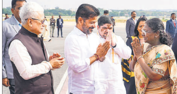
राष्ट्रपति का स्वागत करते तेलंगाना के राज्यपाल जिष्णु देव वर्मा व मुख्यमंत्री ए .रेवंत रेड्डी।