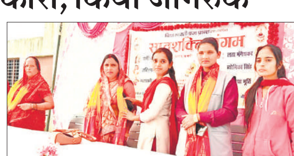
सप्तशती संगम कार्यक्रम में अतिथियों का स्वागत करती छात्राएं।

अमृत विचार : कस्बे के बंडा रोड स्थित सरस्वती शिशु विद्या मंदिर में शनिवार को सप्तशक्ति संगम का भव्य कार्यक्रम का आयोजन किया गया।