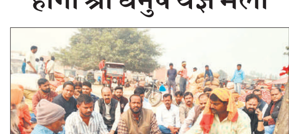
खुटार मेले के आयोजन से पहले हवन पूजन करते कमेटी के सदस्य।