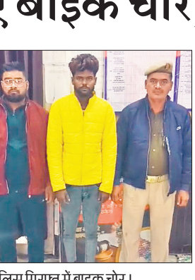
पुलिस गिरफ्त में बाइक चोर।

कार्यालय संवाददाता, बरेली अमृत विचार: कोतवाली पुलिस ने दो बाइक चोरों को चार बाइक के साथ गिरफ्तार किया है। आरोपी बाइक चोरी करने के बाद रेलवे कॉलोनी के जंगल में छुपा देते थे। दोनों बाइक राइडर हैं। आरोपियों के खिलाफ रिपोर्ट दर्ज करके उन्हें जेल भेज दिया गया। कोतवाली पुलिस शुक्रवार रात को महिला थाने के पास वाहनों की चेकिंग कर रही थी। इसी बीच कॉलेज कॉलेज की तरफ से दो बाइक सवार पुलिस को आते हुए दिखाई दिए। पुलिस को देखते ही बाइक सवारों ने बाइक घुमाकर भागने का प्रयास किया। उसके बाद पुलिस ने दोनों बाइक सवार की घेराबंदी करके पकड़ लिया। पकड़े गए आरोपियों ने अपने नाम