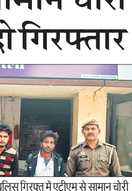
पुलिस गिरफ्त में एटीएम से सामान चोरी करनेवाले।