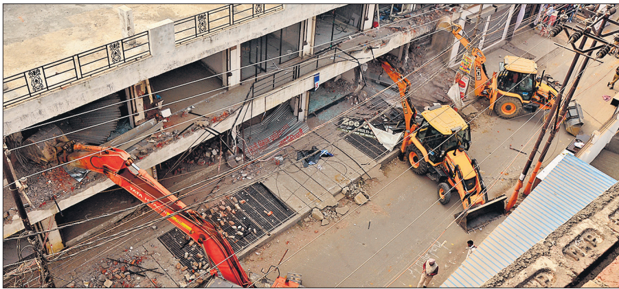
जगतपुर स्थित अवैध भवन पर चलते बीडीए के तीन-तीन बुलडोजर।