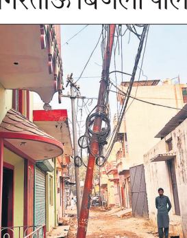
गिरताऊ हालत में पोल।