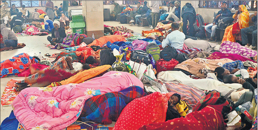
बरेली जंक्शन पर टंडी फर्श पर सोते यात्री।

मुख्यमंत्री योगी आदित्यनाथ के सख्त आदेश हैं कि टंड में किसी को भी खुले आसमान के नीचे न सोना पड़े। जिला प्रशासन संबंधित विभागों की मदद से जरूरतमंदों के लिए रैन बसेरे बनाए और उनमें आवश्यक सभी सुविधाएं मुहैया कराए। पिछले एक पखवाड़े से टंड का प्रकोप लगातार बढ़ता जा रहा है। इसके बावजूद जिम्मेदार विभागों ने अभी तक शहर में अस्थायी रैन बसेरों के