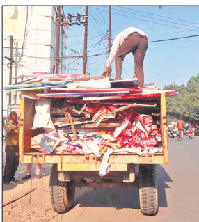
अवैध होर्डिंग जब्त करती निगम की टीम।

हिससे को दहा दिया है। देर शाम 7 बजे तक शोरूम दहाने की कार्रवाई चली। बताते हैं कि रविवार को बुलडोजर पूर्ण रूप से बिल्डिंग को दहाने के लिए गरजेंगे।