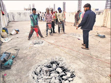
ड्रिल मशीन से छत को तोड़ते मजदूर।