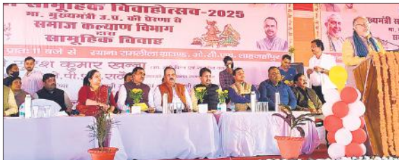
सामूहिक विवाह कार्यक्रम में मंचासीन अधिकारी।

पहले बेटे की जन्म पर अनेक परिवारों में चिंता बढ़ जाती थी, लेकिन अब सरकार की विभिन्न योजनाओं ने यह सोच बदल दी है। उन्होंने कन्या सुमंगला योजना का उल्लेख करते हुए कहा कि बेटे की जन्म से लेकर उसकी पढ़ाई तक छह चरणों