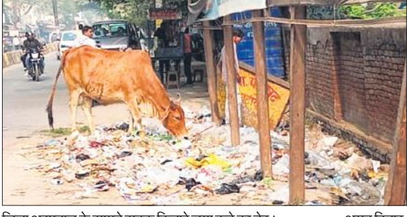
जिला अस्पताल के सामने सड़क किनारे लगा कूड़े का ढेर।

नगर पालिका प्रशासन के सफाई कर्मचारी रविवार को अवकाश पर रहते हैं। जिससे शहर का कूड़ा नहीं उठाया जाता है। छुट्टी के दिन पूरा शहर गंदगी की चपेट में रहता है। गंदगी के चलते मच्छरों का प्रजनन बढ़ी संख्या में होता है। रविवार को जिला अस्पताल के सामने कूड़े