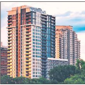
● 6 माह में कंपनियों की बिक्री बुकिंग 92,437 करोड़ रही

बिक्री बुकिंग के मामले में, प्रेस्टिज एस्टेट्स प्रोजेक्ट्स लिमिटेड अप्रैल-सितंबर अवधि में अग्रणी कंपनी बनकर उभरी, जिसकी पूर्व-बिक्री 18,143.7 करोड़ रही। डीएलएफ दूसरे स्थान पर रही, जिसकी पूर्व-बिक्री 15,757 करोड़ रुपये रही। गोदेरेज प्रॉपर्टीज ने लगभग 15,587 करोड़ की बिक्री बुकिंग दर्ज की, जबकि लोढ़ा डेवलपर्स ने 9,020 करोड़ मूल्य की संपत्तियां बेचीं। दिल्ली-एनसीआर की सिग्नेचर ग्लोबल ने 4,650