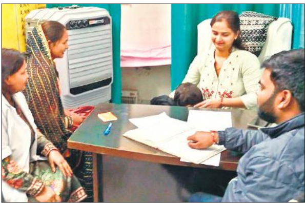
नेकपुर आरोग्य मंदिर पर महिला को देखती डॉक्टर।

अमृत विचार : लोगों की सुविधा के लिए खोले गए आयुष्मान आरोग्य मंदिरों पर स्वास्थ्य विभाग की नजर नहीं रहती है। इससे अधिकांश आरोग्य मंदिर रविवार को बंद रहते हैं या फिर उनमें समय पर डॉक्टर नहीं बैठते हैं। इससे स्थानीय लोगों को इनका लाभ नहीं मिल पाता है। नेकपुर के आरोग्य मंदिर पर आज छोटे बच्चों का टीकाकरण किया गया। गर्भवती महिलाओं की जांच कर दवा दी गई। जनपद में कुल आधा दर्जन