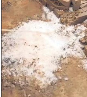
ईंट भट्ठा पर टुकड़ों में पड़ी आसमान से गिरी बर्फ की सिल्ली।

पर भारी संख्या में लोग जमा हो गए। लोगों में यह चर्चा का विषय बना रहा कि बर्फ की सिल्ली आश्विर आसमान से कैसे गिरी। प्रत्यक्षदर्शियों के मुताबिक बर्फ की सिल्ली इतनी तेज रफ्तार से नीचे आई कि जमीन पर टकराते ही कई टुकड़ों में बिखर गई और उसके