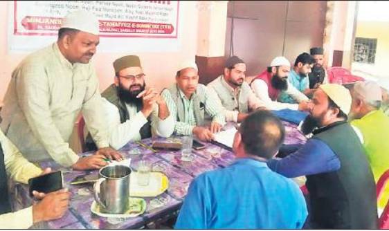
दरगाह आला हजरत परिसर में लगे कैप में पहुंचे मुतवल्ली।