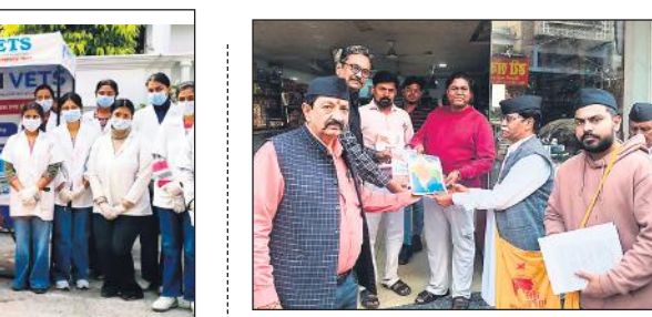
राष्ट्रीय लोधी बौद्धिक संगठन प्रयास की बरेली टीम ने महेंद्र गायत्री कॉलेज में समारोह में लोधी समाज के मेधावी छात्रों को सम्मानित किया।