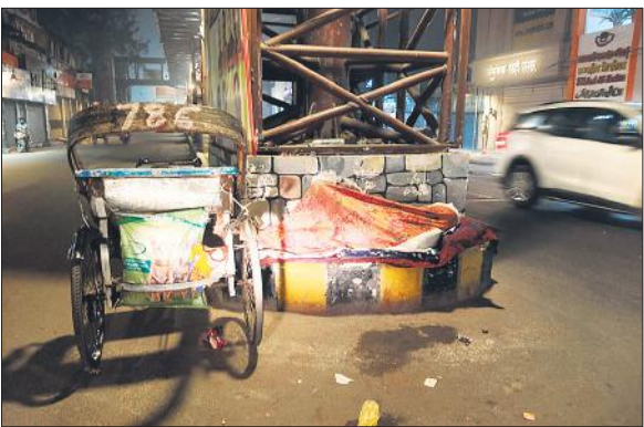
पटेल चौक पर स्काई वॉक के नीचे खुले में सो रहा रिश्ता चालक।