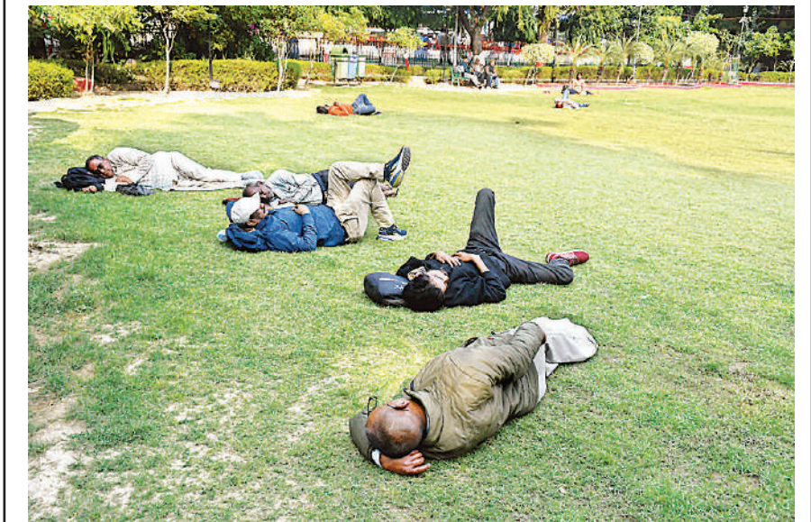
जीपीओ पार्क में दोपहर में गुनगुनी धूप का आनंद लेते लोग।