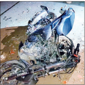
हमले में क्षतिग्रस्त बाइक