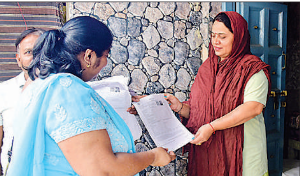
नहीं में महिला को एसआईआर फार्म देती बीएलओ।

होगा। अपने और अपने पिता का नाम भरने के सर्च टैब पर क्लिक करने पर डिटेल आ जाएगा। इसमें