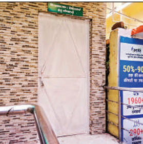
ओपीडी में दिव्यांगों के लिए बने शौचालय में लगा ताला।