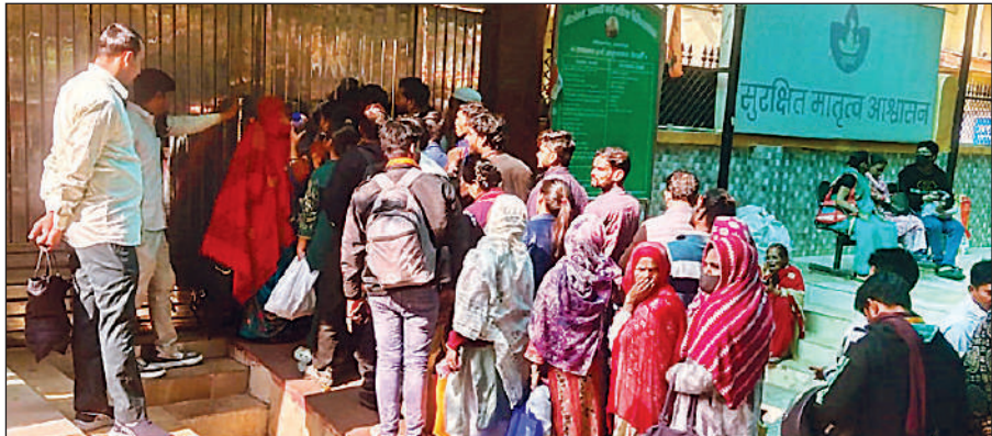
एंट्री के लिए इमरजेंसी गेट पर तीमारदारों की भीड़।

अमृत विचार : वीरंगना अवंतीबाई महिला अस्पताल (डफरिन) में चिकित्सकों के राउंड का हवाला देकर तीमारदारों को सुबह वॉर्ड से बाहर कर दिया जाता है। इसके बाद दोपहर 12 बजे ही उन्हें प्रवेश मिलता है। इस दौरान प्रसूता वॉर्ड में प्रसूताएं अकेली रह जाती हैं और जरूरत पड़ने पर उन्हें तत्काल सहयोग न मिलने से दिक्कत का सामना करना पड़ता है। सोमवार को तीमारदारों ने इस व्यवस्था का विरोध किया, जिसका वीडियो भी वायरल हुआ है। डफरिन अस्पताल 300 बेड की क्षमता वाला अस्पताल है। यहां 24 घंटे इमरजेंसी संचालित होती है और रोजाना औसतन 25-30 सिजेरियन व सामान्य प्रसव होते हैं। तीमारदारों का आरोप है कि सुरक्षागार्ड राउंड के