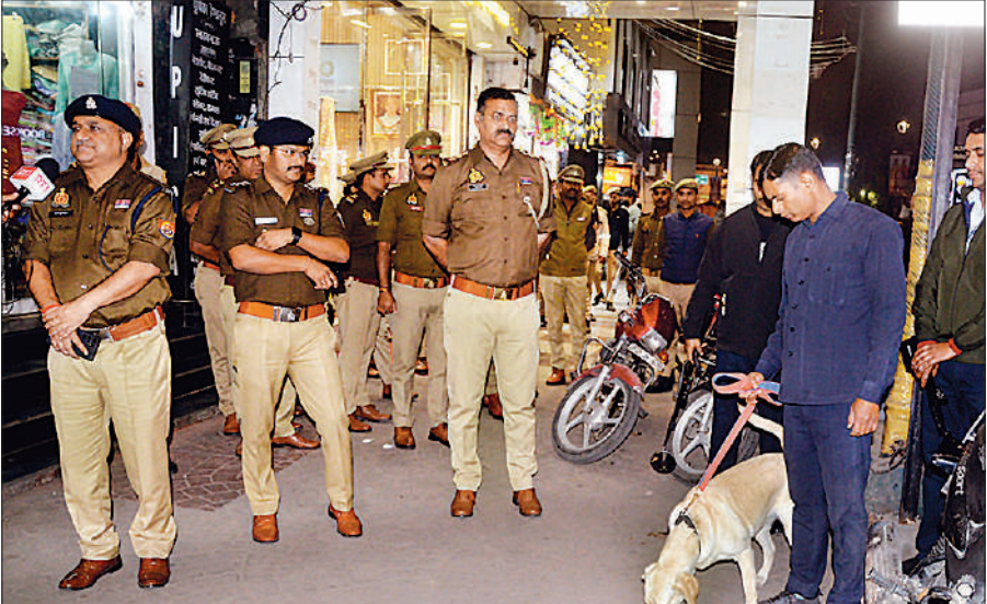
हजरतगंज में सुरक्षा को लेकर जांच करते पुलिसकर्मियों के साथ श्वान दस्ते के कर्मी ।