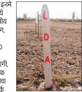
एलडीए ने लगाया निशान

टीम ने 105 बीघा जमीन का कब्जा प्राप्त किया।