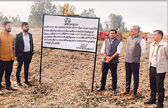
जमीन पर कब्जा लेने के बाद लगाए बोर्ड व उपस्थित अधिकारी।