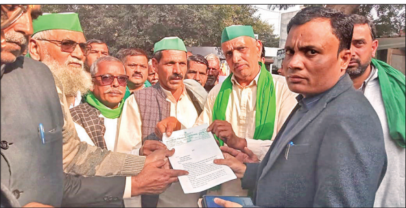
प्रशासनिक अफसर को ज्ञानन देते भाकियू टिकैट के पदाधिकारी।