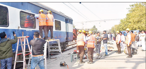
मॉक ड्रिल के दौरान मौजूद रेलकर्मियों व अफसर।

अमृत विचार : पूर्वोत्तर रेलवे के इज्जतनगर मंडल के कंट्रोल रूम में बुधवार दोपहर 12:35 बजे सूचना आई कि बहेड़ी में सवारी गाड़ी डिरेल हो गई है। इसके बाद अधिकारियों में हड़कंप मच गया। मौके पर एनडीआरएफ और रेलवे की टीम मौके पर रवाना हुई, लेकिन बाद में पता लगा कि टीम की सतर्कता बरतने के लिए मॉक ड्रिल का आयोजन किया गया था।