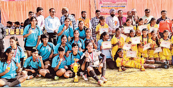
विजेता और उपविजेता टीम के खिलाड़ी।