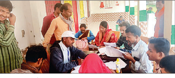
गणना प्रपत्र भरते बीएलओ।