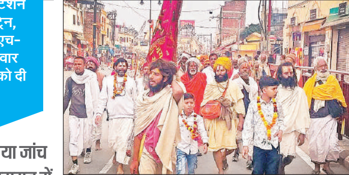
रामकोट की परिक्रमा करते चित्रकूट के साधु-संत।