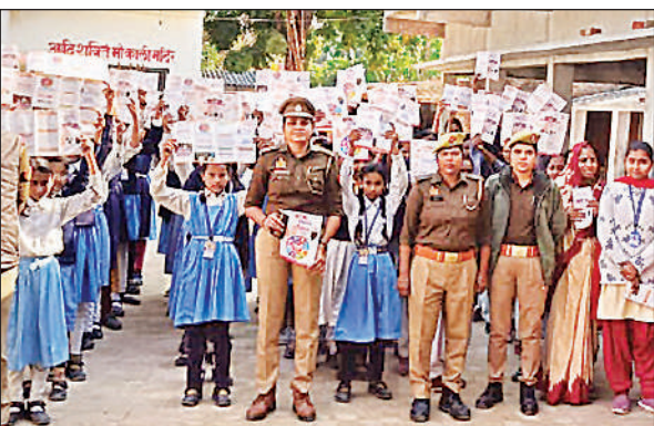
लोगों को जागरूक करते पुलिसकर्मों।