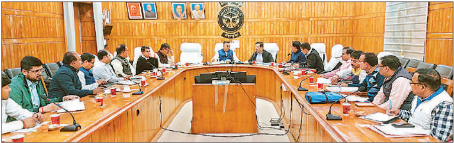
अधिकारियों के साथ समीक्षा बैठक करते जिलाधिकारी।