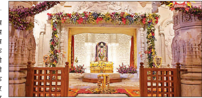
गर्भगृह में विराजमान रामलला।

राम जन्मभूमि परिसर में राम मंदिर और आठ एकड़ के 800 की परिधि में