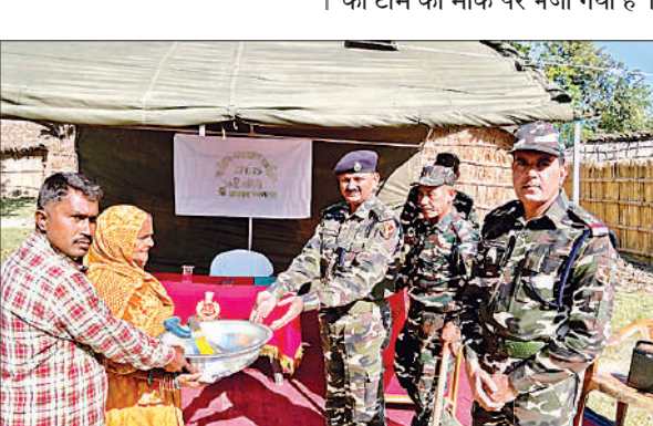
ग्रामीणों को कृषि उपकरण वितरित करते एसएसबी के जवान।