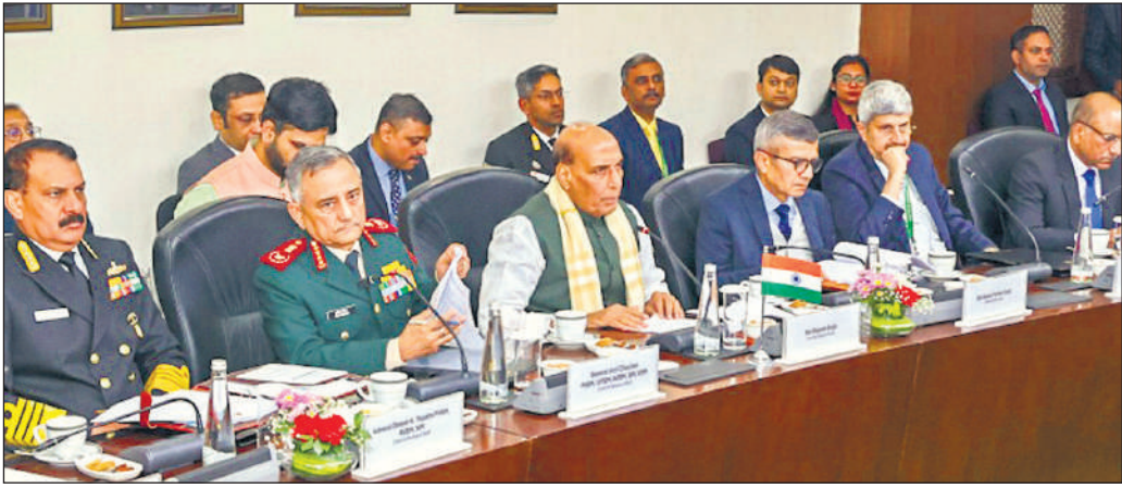
नई दिल्ली में इंडोनेशिया के समकक्ष के साथ बैठक करते केंद्रीय रक्षा मंत्री राजनाथ सिंह।

रक्षा मंत्रालय ने एक वक्तव्य जारी कर कहा कि दोनों पक्षों ने हिंद-प्रशांत में शांति और सुरक्षा पर रणनीतिक दृष्टिकोण स्पष्ट करते हुए कहा कि भारत और इंडोनेशिया ऐसे मुक्त, खुले, शांतिपूर्ण, स्थिर और समृद्ध हिंद-प्रशांत के पक्षधर हैं जो अंतर्राष्ट्रीय कानून और संप्रभुता के सम्मान पर आधारित हो। इंडोनेशिया ने 'हिन्द प्रशांत पर आसियान के दृष्टिकोण' और भारत के 'हिन्द प्रशांत महासागर पहल' के साझा सिद्धांतों का उल्लेख करते हुए क्षेत्र में शांति और सहयोग को बढ़ावा देने में भारत को एक प्रमुख भागीदार बताया। दोनों पक्षों