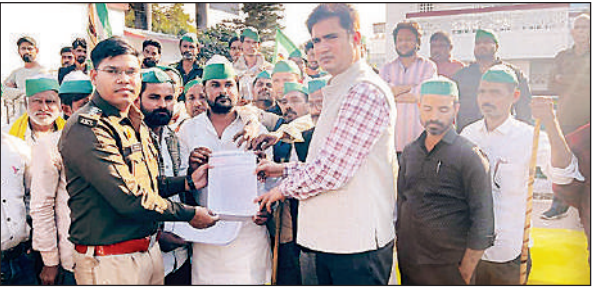
मांगों से संबंधित ज्ञापन सौंपते भाकियू के पदाधिकारी व कार्यकर्ता। अमृत विचार

बलरामपुर, अमृत विचार एमएलके स्नातकोत्तर महाविद्यालय बलरामपुर के भूगोल तृतीय वर्ष पंचम सेमेस्टर के विद्यार्थियों का शैक्षिक भ्रमण 26 नवंबर 2025 को दुधवा नेशनल पार्क के कर्तनियां घाट क्षेत्र और चौधरी चरण सिंह धारा बैराज पर आयोजित किया गया। प्रातः 5 बजे महाविद्यालय से रवाना हुए सभी विद्यार्थी लगभग 11 बजे कर्तनियां घाट पहुंचे, जहां उन्होंने वन्यजीव अभयारण्य का भौगोलिक परीक्षण किया। विद्यार्थियों ने घने सघन जंगल, नदी तट, वनस्पतियों तथा विविध वन्यजीवों का प्रत्यक्ष अध्ययन किया। दुधवा क्षेत्र लखीमपुर खीरी से बहराइन की तराई तक फैला हुआ एक महत्वपूर्ण वन्यजीव संरक्षित क्षेत्र है, जहां एक सिंह वाले गैँडे, बाघ, चित्तीदार हिरण, बारासिया, मगरमच्छ और घड़ियाल बड़ी संख्या में पाए जाते हैं। भ्रमण के दौरान विद्यार्थियों ने मगरमच्छ एवं घड़ियाल प्रजनन केंद्र का भी अवलोकन किया।