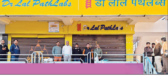
लाल पैथ लैब को सील करने के बाद स्वास्थ्य विभाग की टीम।