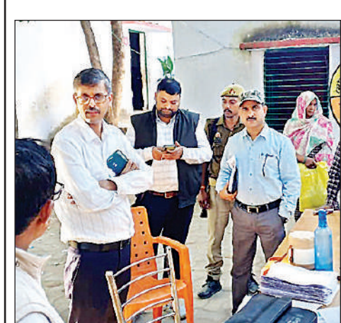
एसआईआर कार्य का जायजा लेते डीएम साथ में बीएसए व अन्य।