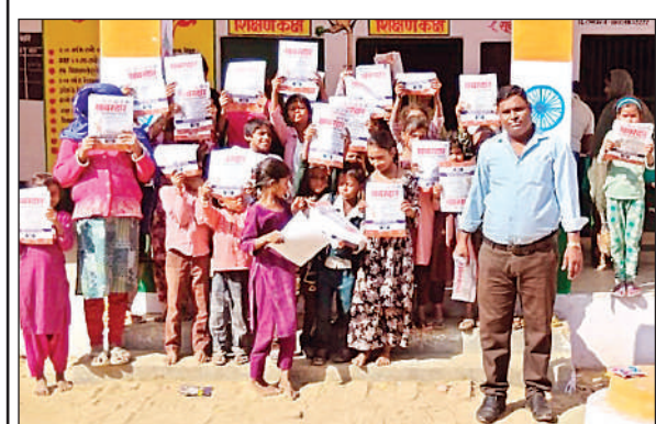
सिरसिया के प्राथमिक विद्यालय भीखपुर तराई में मौजूद छात्र।