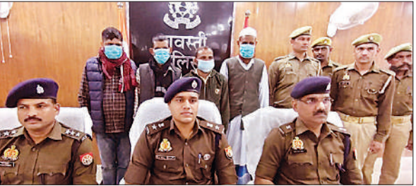
दोहरे हत्याकांड के आरोपियों के साथ एसपी, एसपी, सीओ व अन्य पुलिस कर्मी।

डीएम ने बीएसए को निर्देश दिया कि विभाग अन्तर्गत निर्माण स्थलों के