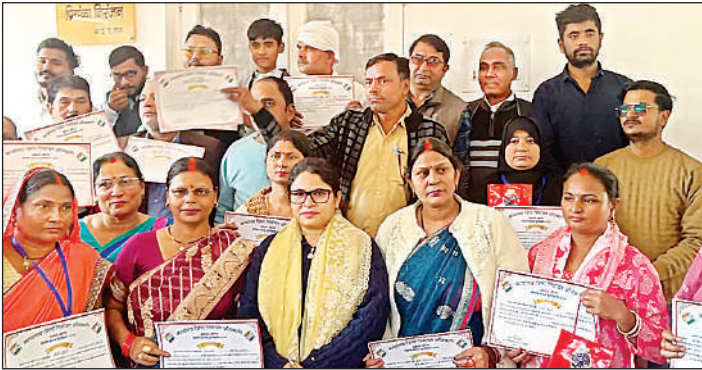
सम्मान पत्र और जिलाधिकारी प्रियंका निरंजन के साथ बीएलओ।

कलेक्ट्रेट सभागार में आयोजित इस सम्मान समारोह में जिलाधिकारी ने कहा कि विशेष प्रगाढ़ पुनरीक्षण फॉर्म का पूर्ण डिजिटाइजेशन निर्वाचन कार्यों को सुदृढ़, पारदर्शी एवं सुगम बनाने में महत्वपूर्ण भूमिका निभाता है। उन्होंने कहा कि चुनाव से जुड़े सभी कार्यों में सटीकता, समयबद्धता और तकनीक के प्रभावी उपयोग की आवश्यकता होती है। समय से पूर्व 100 प्रतिशत डिजिटाइजेशन पूरा करना न केवल विभागीय टीमवर्क का उदाहरण है, बल्कि यह प्रशासन की कार्यकुशलता को भी दर्शाता है। जिलाधिकारी प्रियंका निरंजन ने सभी 18 बीएलओ को बधाई