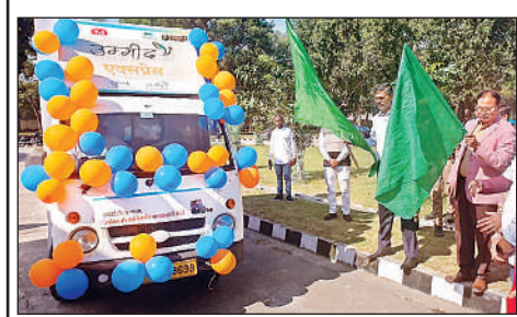
जागरूकता वैन को हरी झंडी दिखाते डीएम व सीएमओ।