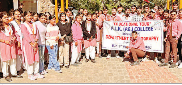
शैक्षिक भ्रमण के लिए कर्तनियां घाट पहुंचे विद्यार्थी।

गोंडा, अमृत विचार: गल्ला मंडी परिसर में अनावश्यक रूप से गाड़ियों को पार्किंग किया जा रहा है। जिससे व्यापारियों में आक्रोश है। व्यापारियों का कहना है कि कुछ ऐसे लोग अपनी गाड़ी मंडी में लाकर खड़ी कर दे रहे हैं, जो ना तो व्यापारी हैं ना ही किसान इन पर मंडी प्रशासन रोक नहीं लग रहा है। मंडी परिसर में कई वाहन कई कई दिन खड़े रहते हैं। जिससे व्यापारियों को व्यापार करने में कठिनाई हो रही है। व्यापारियों का आरोप है कि मंडी प्रशासन इन पर रोक नहीं लग रहा है। धान का सीजन चल रहा है इन वाहनों से ट्रैकों के लोडिंग में समस्या आ रही है। व्यापारियों ने समस्या के समाधान की मांग की है।