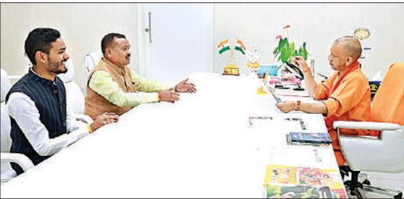
मुख्यमंत्री से उनके आवास पर मुलाकात करते श्रावस्ती विधायक व उनके प्रतिनिधि।