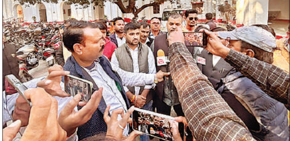
नारेबाजी कर जुलूस निकालते ब्राह्मण समाज के लोग।

जरवल रोड, बहराइच, अमृत विचार : चीनी मिल रेलवे क्रॉसिंग से चीनी मिल तिराहा पर बुधवार को दो ट्रालियां आपस में फंस गईं जिससे आईपीएल चीनी मिल जरवल रोड से लखनऊ-गोंडा मार्ग स्थित चीनी मिल चौराहे तक लंबा जाम लग गया। शाम करीब 5 बजे गन्ना लेकर एक ट्राली मिल जा रही थी। तभी रेलवे क्रॉसिंग के निकट उधर से आ रही ट्रैक्टर-ट्राली आपस में फंस गई जिससे आवागमन बंद हो गया। सूचना पर रेलवे कर्मचारी व आरपीएफ बुढ़वल चौकी पुलिस बल के जवानों व रेल कर्मचारियों ने पहुंच कर आधा घंटे तक कड़ी मशक्कत के बाद ट्रालियों को हटवा कर यातायात सुचारु कराया।