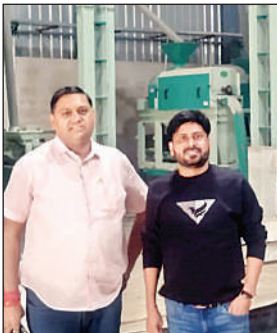
बेलसर में निर्माणाधीन आटा प्लांट।

अमृत विचार: जनपद के बेलसर ब्लॉक क्षेत्र की लौत्वा टेपरा ग्राम पंचायत में बना आटा प्लांट अब अंतिम चरण में है, दिसंबर माह से इसका संचालन शुरू होने का रहा है। प्लांट करीब पांच करोड़ रुपये की लागत से तैयार हुआ है। यह प्लांट न केवल ग्रामीणों के लिए नए रोजगार के द्वार खोलेगा, बल्कि स्थानीय किसानों की आय बढ़ाने में भी महत्वपूर्ण भूमिका निभाएगा। प्लांट का निर्माण आधुनिक तकनीक और सुरक्षा मानकों के अनुरूप किया गया है,