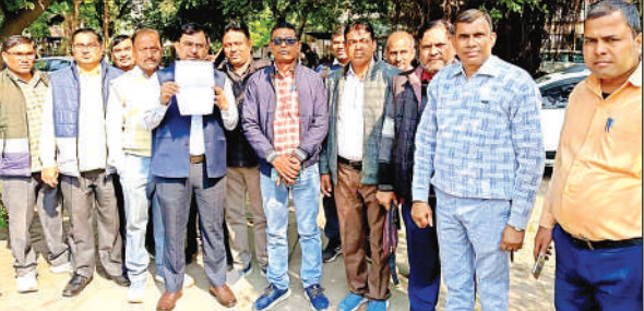
शुक्रवार को डीएम को ज्ञापन देने पहुंचे पर्यवेक्षक।

पर्यवेक्षकों ने ज्ञापन में कहा कि सभी पर्यवेक्षक सहायक निर्वाचन अधिकारी के निर्देशों का पालन करते हुए निर्वाचन नामावलियों का विशेष प्रगाढ़ पुनरीक्षण में बीएलओ के साथ फार्मों का वितरण और संकलन कर रहे हैं। एसडीएम ने