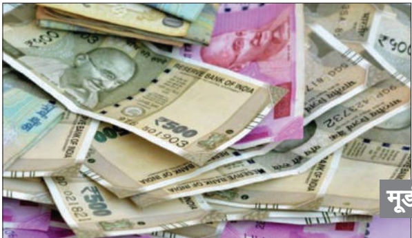
मूडीज का दावा

लेखा महानिर्यंत्रक (सीजीए) की तरफ से जारी आंकड़ों के मुताबिक, इस साल अप्रैल-अक्टूबर के दौरान केंद्र सरकार का राजकोषीय घाटा 8,25,144 करोड़ रुपये रहा। केंद्र सरकार ने चालू वित्त वर्ष के लिए कुल 15.69 लाख करोड़ रुपये के राजकोषीय घाटे का अनुमान लगाया है, जो सकल घरेलू उत्पाद (जीडीपी) का लगभग 4.4 प्रतिशत होगा। केंद्र की कुल आय अप्रैल-अक्तूबर 2025 की अवधि में 18 लाख करोड़ रुपये रही, जिसमें 12.74 लाख करोड़ रुपये कर राजस्व, 4.89 लाख करोड़ रुपये गैर-कर राजस्व और 37,095 करोड़ रुपये की गैर-ऋणा पूंजीगत आय शामिल है। इस दौरान केंद्र से