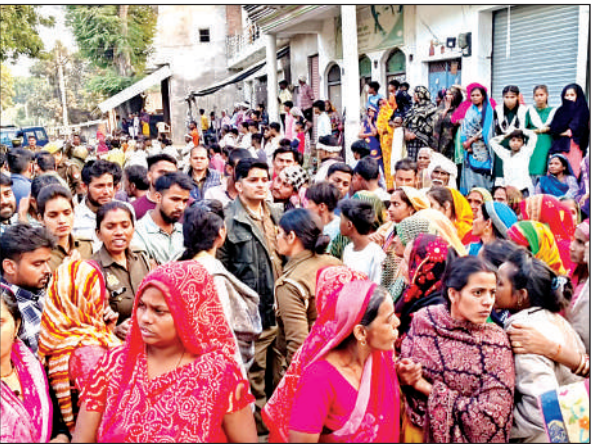
युवक की मौत के बाद जाम लगाए परिजन।