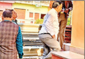
छापेमारी करती विजिलेंस टीम।

अचानक घरों में विजिलेंस टीम के प्रवेश से कई उपभोक्ता चौंक गए। बताया गया कि टीम के साथ कोई स्थानीय जेई या लाइनमैन मौजूद नहीं था। इस पर उपभोक्ताओं ने टीम सदस्यों से पहचान पत्र और