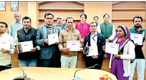
सम्मानित होने के बाद डीएम के साथ खड़े बीएलओ।

जिलाधिकारी ने बताया कि अभी तक जनपद में 50 प्रतिशत