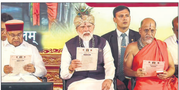
कर्नाटक के उडुपी में श्रीमद्भगवद्गीता का पाठ करते प्रधानमंत्री मोदी व अन्य।

लेने आए थे, जहां एक लाख लोगों ने श्रीमद्भगवद्गीता का पाठ किया। यह कार्यक्रम उडुपी में स्थित श्री कृष्ण मठ ने आयोजित किया था। मोदी ने कहा, गीता हमें शांति और सत्य के लिए प्रयास करने और अत्याचार करने वालों को कुचलने की शिक्षा देती है। हम वसुधैव कुटुम्बकम में विश्वास करते हैं और धर्मों रक्षित रक्षितः का जाप भी करते हैं।