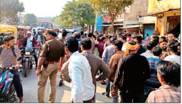
छापेमारी के दौरान मौजूद लोगों की भीड़।

प्रदर्शन में शामिल होकर उनकी मांगों का समर्थन किया।