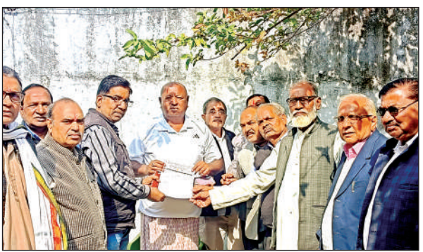
सदर विधायक को ज्ञापन सौंपते पेंशनर।