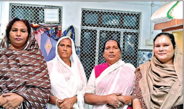
सम्मेलन के बारे में जानकारी देते किन्नर।

20 साल बाद बुंदेलखंड का दूसरा अखिल भारतीय किन्नर सम्मेलन की शुरुआत 1 दिसम्बर को चरखारी के एक गेस्ट हाउस में होगी। 10 दिसंबर तक चलने वाले