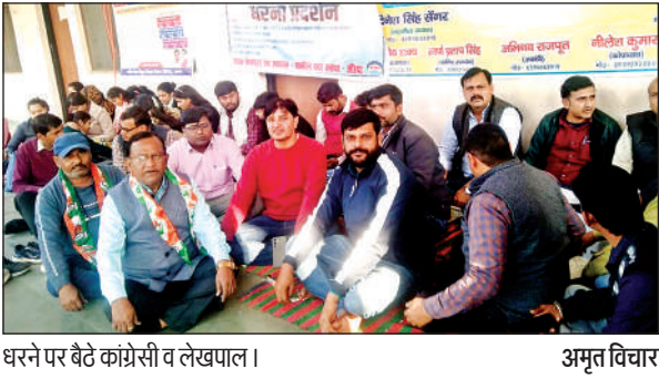
धरने पर बैठे कांग्रेसी व लेखपाल।

अबैध शराब की बिक्री पर रोक लगाने की मांग फफूंद। थाना फफूंद के अंतर्गत फफूंद औरैया मार्ग पर स्थित ग्राम मुढी में हरिजन बस्ती में अबैध शराब की बिक्री जोरों पर है। यह शराब आधा दर्जन युवक ठेको देवर व नांदपुर से लाकर 100 रुपये में एक पैकेट की बिक्री कर रहे हैं। साथ इन मोहल्लों का माहौल शराबियों का अड्डा बना हुआ है। लोगों ने एसपी से मांग की है कि अबैध शराब की बिक्री को रोक़ा जाए।