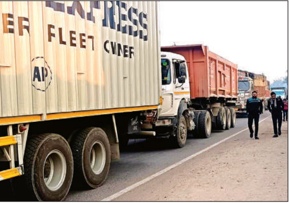
गुरुवार शाम से शुक्रवार सुबह तक हाईवे के जाम में फंसे रहे वाहन।