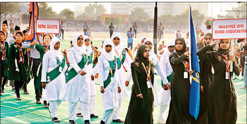
मार्च पास्ट निकालतीं मालदीव व नेपाल की स्काउट-गाइड टीमें।