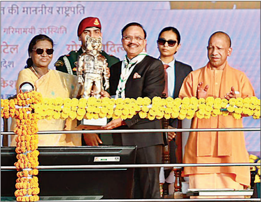
कार्यक्रम के दौरान जंबूरी का शुभंकर प्राप्त करतीं राष्ट्रपति द्रौपदी मुर्मु, साथ में मुख्यमंत्री योगी।