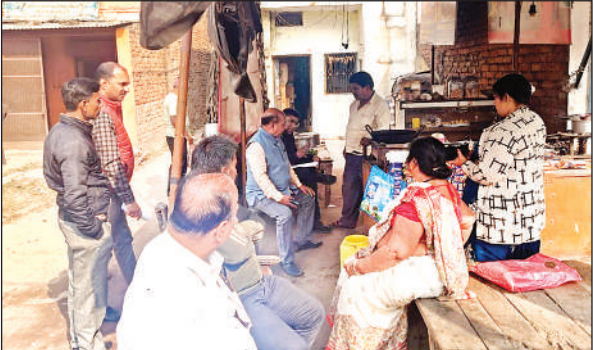
स्टेशन रोड पर स्थित एक दुकान में जांच करते अधिकारी।