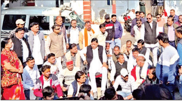
कचहरी में प्रदर्शन करते ब्राह्मण समाज के लोग ।