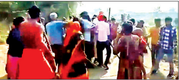
दोनों पक्षों ने एक-दूसरे पर लाठी-डंडे बरसाए।