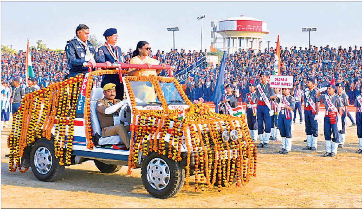
लखनऊ में डिफेंस एक्सपो ग्राउंड पर भारत स्काउट्स एंड गाइड्स की डायमंड जुबली व 19वीं राष्ट्रीय जंबूरी के समापन समारोह के दौरान राष्ट्रपति द्रौपदी मुर्मु।