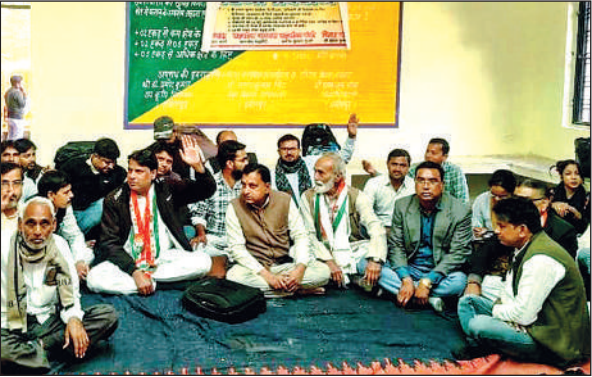
शुक्रवार को राठ तहसील में धरना देते लेखपाल।