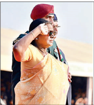
मार्च पास्ट की सलामी लेतीं राष्ट्रपति द्रौपदी मुर्मु।