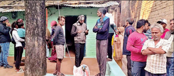
मौदहा कस्बे के बांकी तलैया में घर के बाहर एकत्र लोग।

● पुलिस बोली, पोस्टमार्टम रिपोर्ट आने के बाद वजह होगी साफ