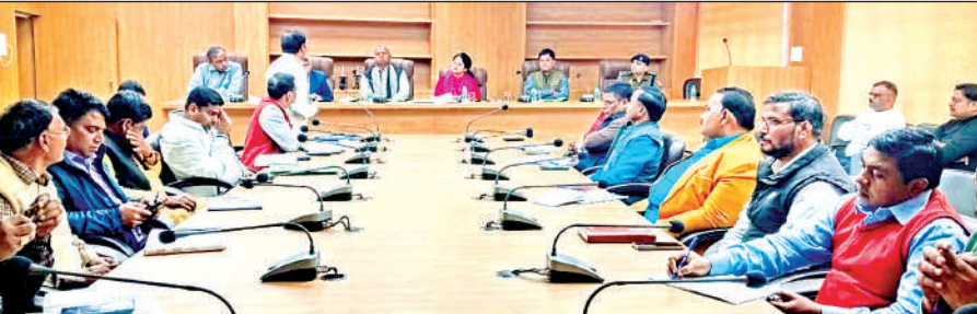
शुक्रवार को बैठक में जिले के ऐतिहासिक और पर्यटन स्थलों को लेकर गहन मंथन हुआ।

के साथ होगी। 2 दिसम्बर से 6 दिसम्बर तक सर्व धर्म सभा का आयोजन किया जाएगा। 7 दिसम्बर को एक हजार किन्नरों के साथ कलाश यात्रा का आयोजन किया