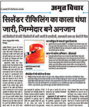
‘अमृत विचार’ में प्रकाशित समाचार।