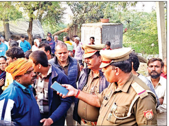
परिजनों के बयान लेती पुलिस।