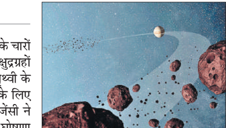
अंतरिक्ष में विचरते क्षुद्रग्रहों की तस्वीर।

क्षुद्रग्रहों की अनदेखी कतई नहीं की जा सकती है। अतीत में दिए इनके घावों को भुलाया नहीं जा सकता है। यूरोपीय अंतरिक्ष एजेंसी के मुताबिक, वर्तमान में नासा समेत दुनिया की कई दूरबीनों से इनकी निरंतर