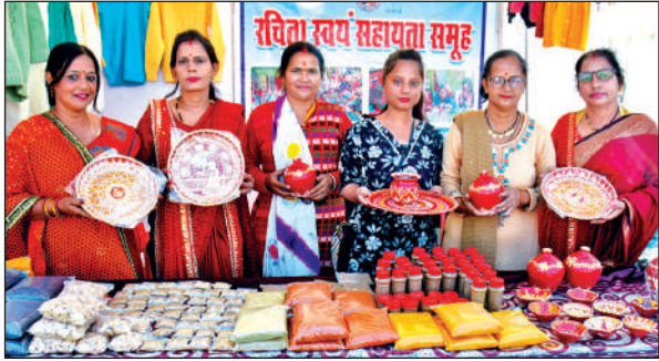
एमबी इंटर कालेज के मैदान में गिरिजा बुटी एवं महिला विकास संस्था द्वारा लगाया गया स्टाल।