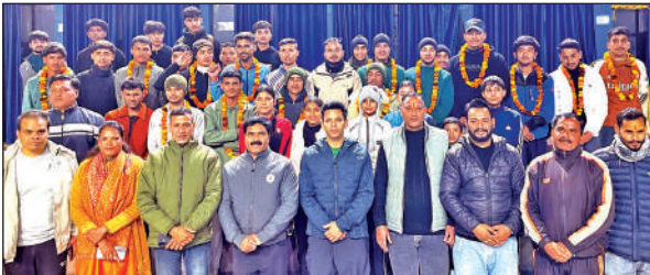
खेल विभाग से प्रशिक्षण प्राप्त कर अग्निवीर बने युवाओं का सम्मान हुआ ।