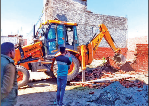
किच्छा में अवैध निर्माण ध्वस्त करती जेसीबी।