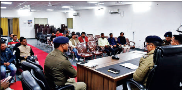
बैंड-बाजा और बैक्वेट हॉल मालिकों के साथ बैठक करते एसएसपी। ● अमृत विचार

कार्यालय संवाददाता, हल्द्वानी अमृत विचार : न शादियों पर रोक है और न शादी के जश्न पर, लेकिन अगर शादी में बैंड-बाजा भी बजाना है तो जरा संभल कर। क्योंकि अगर बारात में हाई बेस बजा तो खैर नहीं। इसके साथ पुलिस ने उन झालर ट्रॉली पर बैन लगा दिया है, जिसकी वजह से यातायात प्रभावित होता है। साथ ही जनवासे और बारात घर के बीच की दूरी पर सीमित कर दी गई है। रात 10 बजे के बाद बारात के शोर-शराबे पर पूरी तरह प्रतिबंध लगा दिया गया है। इसको लेकर बुधवार को