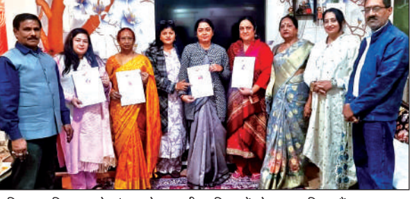
महिला सशक्तिकरण के संकल्प के साथ तीन महिलाओं को अहम दायित्व सौंपा गया।