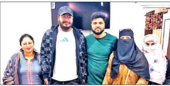
गदरपुर में शपथ ग्रहण करने के बाद पदाधिकारी।

प्रदर्शित कृषि उपकरणों के विकास, परंपरागत खेती पद्धतियों, आधुनिक कृषि यंत्रों, फसल सुधार तकनीकों, कृषि इतिहास से संबंधित महत्वपूर्ण जानकारीयां दीं। इसके बाद विद्यार्थी विश्वविद्यालय के केंद्रीय पुस्तकालय पहुंचे। यहां उन्होंने डिजिटल लाइब्रेरी, ई-रिसोर्सेज, पुस्तक विभाग, अध्ययन कक्ष,