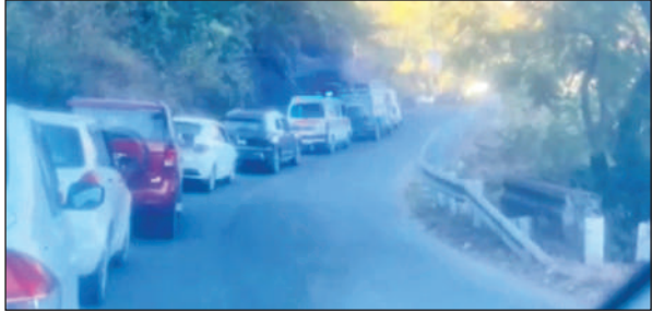
हल्द्वानी- भीमताल मोटर मार्ग में लगे जाम में फंसे वाहन। ● अमृत विचार

ध्यान में रखते हुए विस्तृत परीक्षण आवश्यक है। बताया कि मिट्टी की रिपोर्ट आने के बाद भार-वहन क्षमता के अनुसार दीवारों की मरम्मत एवं मजबूतीकरण का प्लान तैयार किया जाएगा। झील किनारे कई स्थानों पर रॉक स्ट्रक्चर की भी जांच की जाएगी।