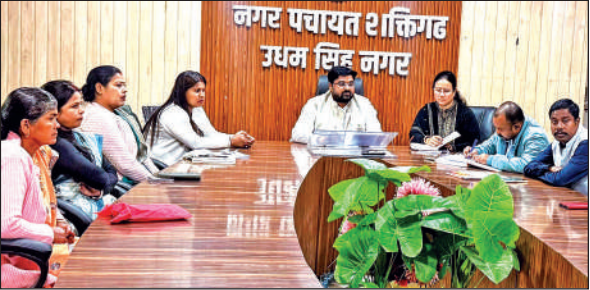
नगर पंचायत बोर्ड की बैठक में मौजूद चेयरमैन व सभासद। ● अमृत विचार

सफाई व्यवस्था के सुदृढ़ीकरण के लिए ई-रिक्षा क्रय करने, मृत शरीर को रखने के लिए डीप फ्रीजर, व्यक्तिगत शौचालय, नगर के विभिन्न वार्डों के मंदिरों का सौंदरीकरण, मोबाइल टॉयलेट क्रय करने समेत विभिन्न प्रस्ताव को मंजूरी दी है। बोर्ड ने सड़कों को अतिक्रमण मुक्त बनाने के लिए व्यापार मंडल से वार्ता करने और विशेष अभियान चलाने का भी निर्णय लिया है। उन्होंने कहा कि बोर्ड आउटसोर्स के माध्यम से कर्मचारियों की आपूर्ति करने और निर्माण कार्यों की ठेकेदारी पंजीकरण कराने का भी प्रस्ताव पारित किया है।