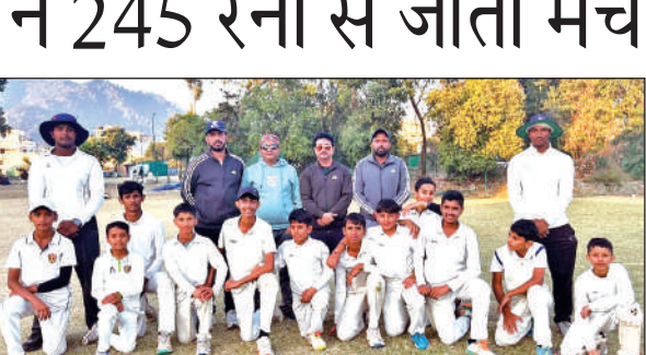
जीत का जश्न मनाते डीके स्पोर्ट्स के खिलाड़ी।