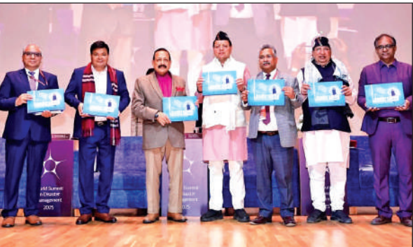
समारोह में विमोचन करते मुख्यमंत्री पुष्कर सिंह धामी एवं अन्य अतिथि।

कार्यक्रम के दौरान मुख्यमंत्री ने विज्ञान एवं प्रौद्योगिकी के क्षेत्र में उत्कृष्ट उपलब्धि हासिल करने वाली प्रतिभाशाली महिला वैज्ञानिकों को सम्मानित किया। इस अवसर पर राज्यभर के विभिन्न शोध एवं शैक्षणिक संस्थानों से चयनित वैज्ञानिकों को यंग वुमन