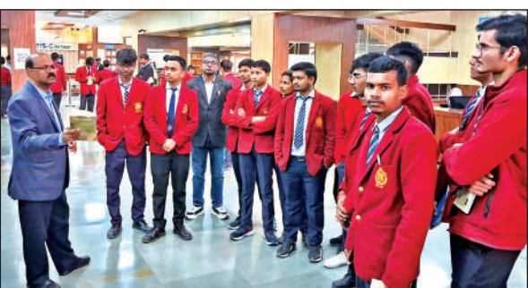
भ्रमण के दौरान विद्यार्थियों को जानकारी देते जीबी पंत विवि के वैज्ञानिक।

अमृत विचार: नवोदय विद्यालय समिति लखनऊ संभाग के विद्यार्थियों ने क्षेत्र स्तरीय विज्ञान कांग्रेस के तहत गोविंद बल्लभ पंत कृषि एवं प्रौद्योगिकी विश्वविद्यालय पंतनगर के कृषि संग्रहालय, मधुमक्खी पालन, एलपीटी शोध केंद्र और केंद्रीय पुस्तकालय का शैक्षणिक भ्रमण किया। इस दौरान विभिन्न माॉडलों, प्रदर्शनीयों और तकनीकी नवाचारों को देखकर विद्यार्थियों में गजब का उत्साह देखने को मिला। शुक्रवार को भ्रमण के दौरान