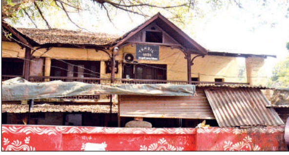
ब्रिटिश हुकूमत के दौर का हल्द्वानी तहसील का भवन। ● अमृत विचार

में, इसे नैनीताल जिले के चार हिस्सों में से एक भाग का मुख्यालय बनाया गया था, जिसमें 4 कस्बे और 511 गांव शामिल थे। इसके स्थापित होने के बाद ही हल्द्वानी के विकास को गति मिली और 1907 में इसे शहर क्षेत्र का दर्जा प्राप्त हुआ।