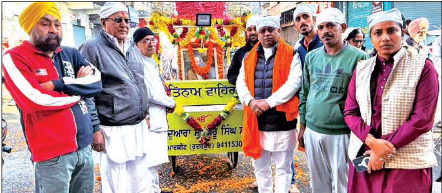
नगर कीर्तन में मौजूद उत्तराखंड युवा पंजाबी महासभा के प्रदेश अध्यक्ष चुप व अन्य। ● अमृत विचार

नगर कीर्तन में सबसे आगे पालकी साहिब विराजमान रहे