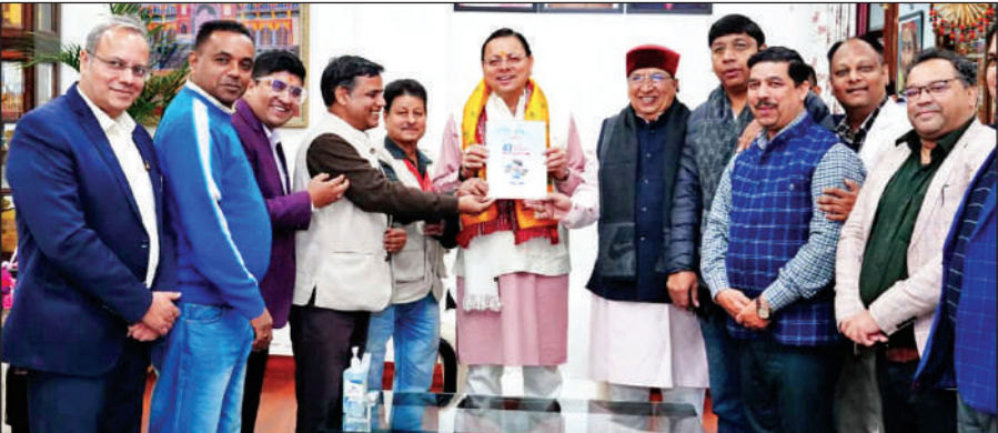
मुख्यमंत्री पुष्कर सिंह धामी को ब्रोशर भेंट करते पीआरएसआई देहरादून चैप्टर के अध्यक्ष रवि बिजारनिया एवं पदाधिकारी।

आगामी 13, 14 एवं 15 दिसंबर को देहरादून में आयोजित होने जा रहे राष्ट्रीय जनसंपर्क अधिवेशन के लिए मुख्यमंत्री को औपचारिक आमंत्रण दिया गया। इस अवसर