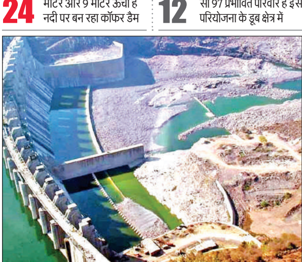
पारदर्शिता के निर्देश दिए।

उन्होंने भूमि अधिग्रहण से संबंधित मामलों की समीक्षा की और कहा, मुआवजा धारकों को तत्काल मुआवजा दें, जो भी मुआवजाधारी उपलब्ध नहीं हैं या भुगतान लंबित है, उनका मुआवजा संरक्षित रखें। प्रोजेक्ट से जुड़े अधिकारियों को परियोजना की नियमित निगरानी और