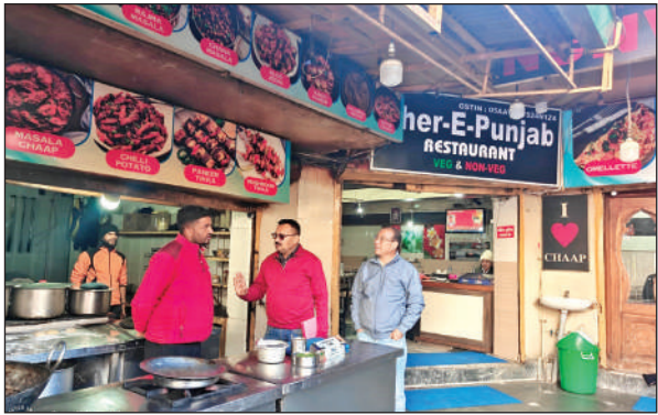
नैनीताल में छापेमारी करती खाद्य सुरक्षा विभाग की टीम। ● अमृत विचार

संवाददाता, नैनीताल अमृत विचार: नैनी झील के किनारे पुरानी सुरक्षा दीवारों की मजबूती एवं पुनर्निर्माण से पहले लोअर माल रोड की मिट्टी की भार-वहन क्षमता का परीक्षण किया जा रहा है। सिंचाई विभाग ने शुक्रवार से लोअर मालरोड में सुचना विभाग से बोट हाउस क्लब के समीप मिट्टी परीक्षण की प्रक्रिया शुरू कर दी है। उत्तराखंड एग्रीकल्चर मड टेस्टिंग लैब की टीम लोअर माल रोड पर बोट स्टैंड से लेकर तल्लीताल फांसी गंधरे तक कुल सात स्थानों से मिट्टी के नमूने एक्चर कर जांच कर रही है। रिपोर्ट के आधार पर झील किनारे दीवारों के सुधार एवं निर्माण का