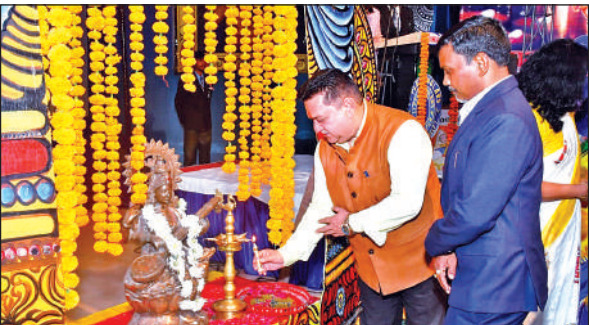
काशीपुर लिटिल स्कॉलर्स विद्यालय में कार्यक्रम का शुभारंभ करते मुख्य अतिथि।