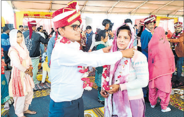
युवती को जयमाला पहनता युवक।