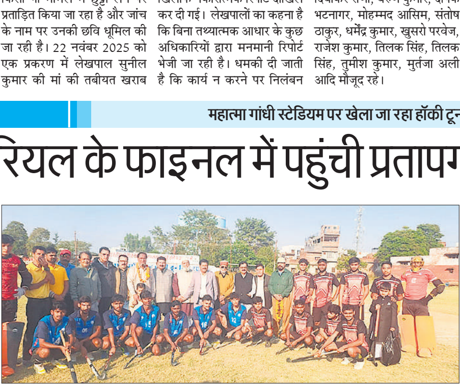
महात्मा गांधी स्टेडियम पर अतिथियों के साथ हॉकी टीमें।