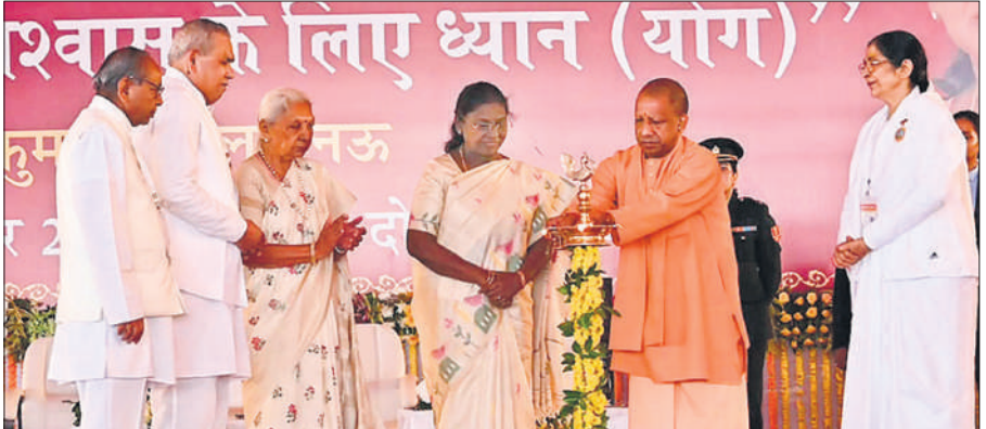
राष्ट्रपति द्रौपदी मुर्मू को प्रजापिता ब्रह्माकुमारीज ईश्वरीय विश्वविद्यालय, लखनऊ द्वारा स्मृति चिह्न भेंट किया गया। इस अवसर पर राज्यपाल आनंदीबेन पटेल, मुख्यमंत्री योगी व संस्थान के वरिष्ठ पदाधिकारी उपस्थित रहे।

योजना हरित ऊर्जा को बढ़ावा देने वाली नीतियों का प्रत्यक्ष परिणाम है। उत्तर प्रदेश को देश का सबसे बड़ा घरेलू सौर ऊर्जा उत्पादक राज्य बनाने की दिशा में तेज गति से कार्य जारी है। - एके शर्मा, ऊर्जा मंत्री है। कई घरों में दिन के समय बिजली बिल लगभग शून्य तक पहुंच गया है और अतिरिक्त उत्पादन को ग्रिड में देकर उपभोक्ताओं को राज्यव्य क्रेडिट का लाभ भी मिल रहा है। ऊर्जा विभाग के अनुसार प्रदेश से लेकर जिला स्तर तक नियमित समीक्षा, ऑनलाइन आवेदन की सरल व्यवस्था, समयबद्ध कनेक्शन और सफ्टिडी के त्वरित भुगतान पर विशेष ध्यान दिया गया। इसी सुव्यवस्थित कार्यप्रणाली से कम समय में इतनी बड़ी रूफटॉप सौर क्षमता हासिल करना संभव हो सका।