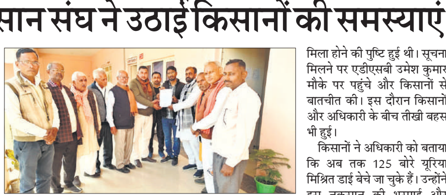
तहसीलदार को ज्ञापन सौंपते हुए भारतीय किसान संघ के कार्यकर्ता।