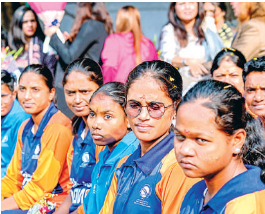
पहले एडिट बाधित टी-20 विश्व कप में ऐतिहासिक खिताबी जीत दर्ज करने वाली भारतीय महिला क्रिकेट टीम को शुक्रवार को नई दिल्ली स्थित नोरा सोलोमन फाउंडेशन ने सम्मानित किया।