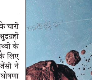
अंतरिक्ष में विचरते क्षुद्रग्रहों की तस्वीर।

अमृत विचार: खगोलविदों ने पृथ्वी के चारों ओर मंडराते 40 हजार से अधिक क्षुद्रग्रहों की खोज कर ली है। बड़े स्तर पर पृथ्वी के नजदीक घूम रहे ये क्षुद्रग्रह धरती के लिए बड़ा खतरा है। यूरोपीय अंतरिक्ष एजेंसी ने अभी तक खोजे गए इन पिंडों की घोषणा करते हुए कहा कि इनसे निकट भविष्य में तो नहीं लेकिन भविष्य में कुछ क्षुद्रग्रह पृथ्वी के लिए बड़ा खतरा बन सकते हैं। क्षुद्रग्रहों की अनदेखी कतई नहीं की जा सकती है। अतीत में दिए इनके घावों को भुलाया नहीं जा सकता है। यूरोपीय अंतरिक्ष एजेंसी के मुताबिक, वर्तमान में नासा समेत दुनिया की कई दूरबीनों से इनकी निरंतर