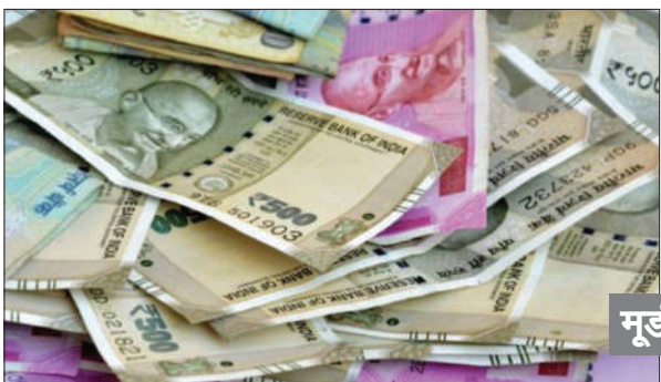
मूडीज का दावा

लेखा महानिर्यंत्रक (सीजीए) की तरफ से जारी आंकड़ों के मुताबिक, इस साल अप्रैल-अक्टूबर के दौरान केंद्र सरकार का राजकोषीय घाटा 8,25,144 करोड़ रुपये रहा। केंद्र सरकार ने चालू वित्त वर्ष के लिए कुल 15.69 लाख करोड़ रुपये के राजकोषीय घाटे का अनुमान लगाया है, जो सकल घरेलू उत्पाद (जीडीपी) का लगभग 4.4 प्रतिशत होगा। केंद्र की कुल आय अप्रैल-अक्तूबर 2025 की अवधि में 18 लाख करोड़ रुपये रही, जिसमें 12.74 लाख करोड़ रुपये कर राजस्व, 4.89 लाख करोड़ रुपये गैर-कर राजस्व और 37,095 करोड़ रुपये की गैर-ऋण पूंजीगत आय शामिल है। इस दौरान केंद्र से