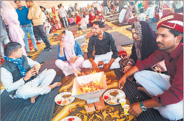
हवन कुंड में आहुति देते दूल्हा और दुल्हन।

माध्यम से गरीब परिवारों की बेटियों का विवाह धूमधाम और गरिमा के साथ संपन्न कराया जा रहा है, जो