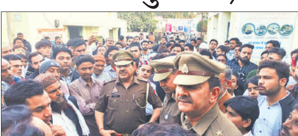
घटना की जांच करती पुलिस।