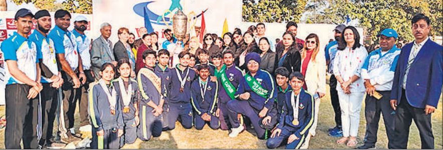
व्हाइट हॉल पब्लिक स्कूल में ट्रॉफी के साथ खिलाड़ी व मौजूद अतिथि