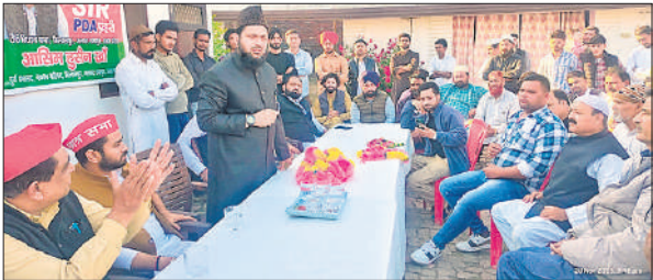
बिलासपुर में कार्यक्रम को संबोधित करते सांसद मोहिबुल्लाह नदवी।

लोगों ने सांसद को बताया कि एक ही फॉर्म होने के कारण वह फॉर्म जमा करने की रिसीविंग नहीं ले पा रहे हैं। कई-कई जगह पर मतदाता गणना प्रपत्र फॉर्म नहीं पहुंचे हैं। बीएलओ के ऊपर ज्यादा काम व दबाव होने के कारण मतदाता के गणना प्रपत्र को थर्ड ऑप्शन में सबमिट कर रहे हैं। मतदाताओं ने अपने गणन प्रपत्र में 2003 की मतदाता सूची में दर्ज अपना पूरा विवरण भरकर बीएलओ के पास जमा कर दिया है। इसके बावजूद उन्हें थर्ड ऑप्शन में जमा