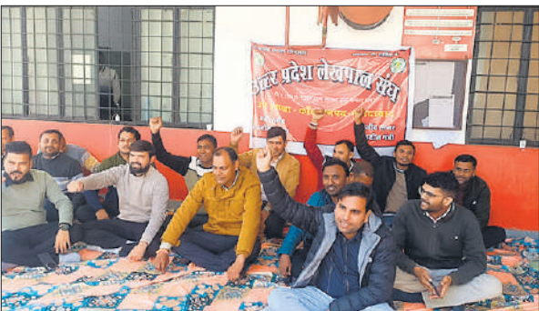
प्रदर्शन करते लेखपाल।