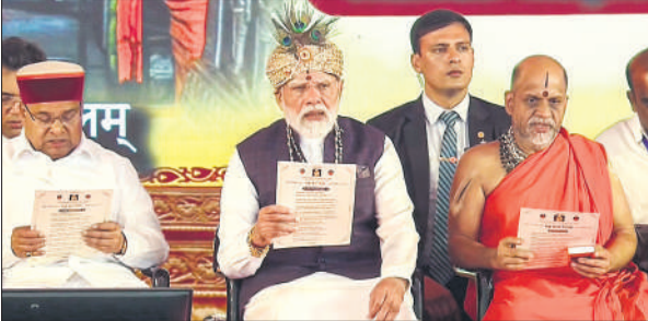
कर्नाटक के उडुपी में श्रीमद्भगवद्गीता का पाठ करते प्रधानमंत्री मोदी व अन्य।

लेने आए थे, जहां एक लाख लोगों ने श्रीमद्भगवद्गीता का पाठ किया। यह कार्यक्रम उडुपी में स्थित श्री कृष्ण मठ ने आयोजित किया था। मोदी ने कहा, गीता हमें शांति और सत्य के लिए प्रयास करने और अत्याचार करने वालों को कुचलने की शिक्षा देती है। हम वसुधैव कुटुम्बकम में विश्वास करते हैं और धर्मों रक्षित रक्षितः का जाप भी करते हैं।