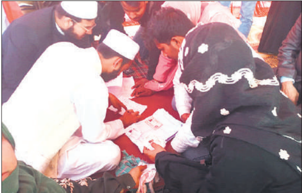
निकाहनामा पर दस्तखत करते दूल्हा और दुल्हन।

अत्यंत सराहनीय पहल है। डीएम ने कहा कि यह योजना प्रदेश सरकार की महत्वाकांक्षी योजनाओं में से एक