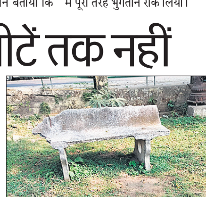
पार्क में टूटी पड़ी सीट।