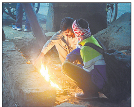
सेटेलाइट अड्डे पर कूड़ा जलाते यात्री।