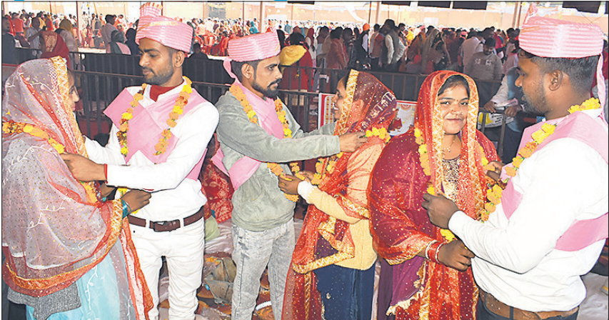
बरेली कॉलेज के मैदान पर सामूहिक विवाह कार्यक्रम में एक-दूसरे को माला पहनाते जोड़े। (खबर पेज-IV) ● अमृत विचार