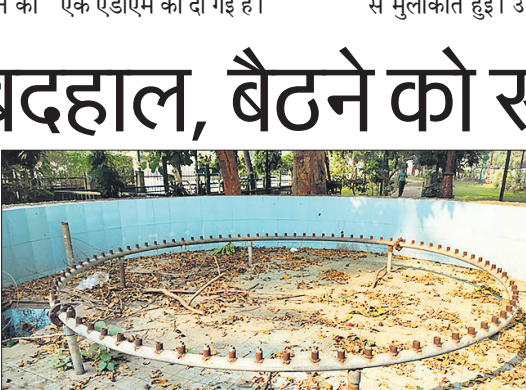
पार्क में बंद पड़ा फव्वारा।