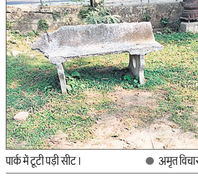
पार्क में टूटी पड़ी सीट।