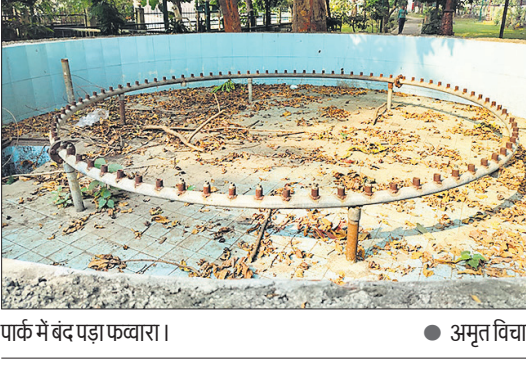
पार्क में बंद पड़ा फव्वारा।