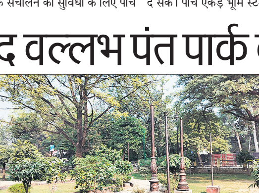
पार्क में लगे खंभों से गायब लाइटें।