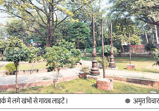
पार्क में लगे खंभों से गायब लाइटें।

अमृत विचार : स्मार्ट सिटी के तहत शहर में पार्कों के स्थिति सुधारने के साथ ही लोगों को स्वस्थ रहने के लिए प्रेरित करने को उनमें ओपन जिम स्थापित करने के साथ ही लाइटें आदि लगाई गई थीं, लेकिन देख-रेख के अभाव में सारी व्यवस्थाएं ध्वस्त होती जा रही हैं। नगर निगम की उपेक्षा के कारण पार्कों की हालत बदहाल होती जा रही है। एडीजी कार्यालय रोड पर स्थित पं. गोविंद वल्लभ पंत पार्क में काफी बदहाली फैली हुई है। पार्क में रोशनी की व्यवस्था के लिए फैंसी स्ट्रीट लाइटें लगाई गई थीं, जिससे पार्क में रोशनी के साथ ही सुंदरता निखरे, लेकिन कुछ लाइटें खराब हो गईं, जबकि तमाम लाइटें लाइटें गायब हैं, पार्क में सिर्फ खंभे