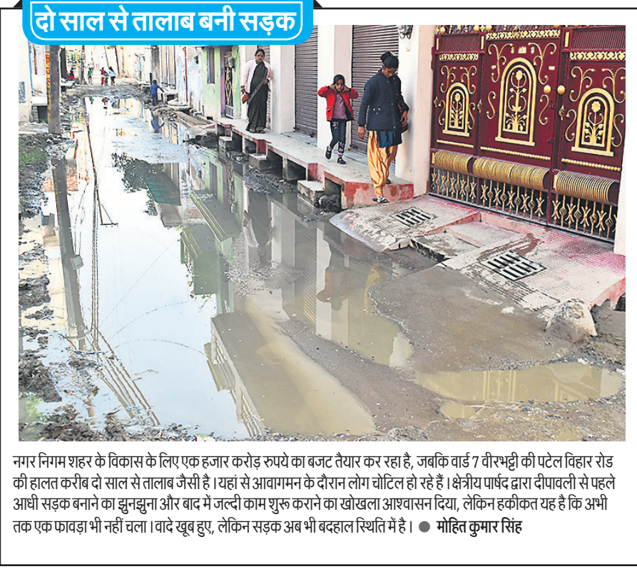
दो साल से तालाब बनी सड़क