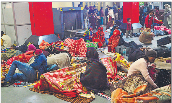
बरेली जंक्शन पर ठंडी फर्श पर रात गुजारने को मजबूर यात्री।

जिला आपदा प्रबंधन प्राधिकरण के अधिकारियों ने बताया कि तकनीकी बिड खुलने के बाद अब फाइनैशियल बिड खोलने के लिए तैयारी शुरू कर दी है। फाइनैशियल