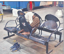
बेंच पर ठंड में सो गया यात्री।

नगर निगम की ओर से जिला आपदा प्रबंधन प्राधिकरण को शेल्टर होम की सूची भेज दी है। सूची के अनुसार शहर के 11 स्थानों पर शेल्टर होम बनाने की जानकारी दी है। बाकसगंज प्राथमिक विद्यालय के पास, सैदपुर हॉटिकस प्राथमिक विद्यालय के पास, बिजली सब स्टेशन बदायूं रोड के पास, स्वामी विवेकानंद पार्क, पटेल चौक के पास, छोटी विहार में मौल के पास 25-25 लोगों की क्षमता के शेल्टर होम स्थापित किए हैं। प्रेमनगर में नगर निगम के जौनल कार्यालय के पास 36 लोगों की क्षमता का शेल्टर होम बनाया है। हरुनगला में बीसलपुर रोड पर 100 लोगों की क्षमता है। चौपुला पुल के पास, सेटेलाइट बस अड्डे के पास, डेलापीर मंडी के पास, पुराना रोडवेज बस अड्डे के पास 25-25 लोगों की क्षमता का शेल्टर होम बनाया है।