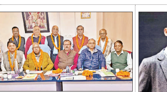
एसबीआई पेंशनर्स एसोसिएशन के चुनाव में चयनित पदाधिकारी।