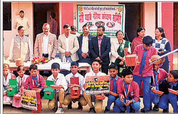
दुबग्गा बरावन कला स्थित त्रिलोकी सिंह इंटर कॉलेज में हुए कार्यक्रम में मौजूद लोग।

अमृत विचार लखनऊ : बाबासाहेब भीमराव अम्बेडकर विश्वविद्यालय में आयोजित “स्पोर्ट्स इवेंट-2025” का समापन हुआ। इवेंट 11 नवंबर से 28 नवंबर तक विश्वविद्यालय में आयोजित किया गया था। खो-खो में बालिका वर्ग में स्कूल ऑफ फिजिकल एंड डिस्सीप्लिन साइडर ने व बालक वर्ग में स्कूल ऑफ मैनेजमेंट एंड कॉमर्स ने प्रथम स्थान प्राप्त किया। कबड्डी में बालिका वर्ग में स्कूल ऑफ मैनेजमेंट एंड कॉमर्स ने व बालक वर्ग में यूआईआईटी ने प्रथम स्थान तथा फुटबॉल में बालिका वर्ग में पृथ्वी व पर्यावरण विज्ञान विद्यापीठ एवं बालक वर्ग में यूआईआईटी ने प्रथम स्थान प्राप्त किया। क्रिकेट में बालिका वर्ग में स्कूल ऑफ मैनेजमेंट एंड कॉमर्स ने प्रथम व बालक वर्ग में यूआईआईटी ने प्रथम स्थान हासिल किया।