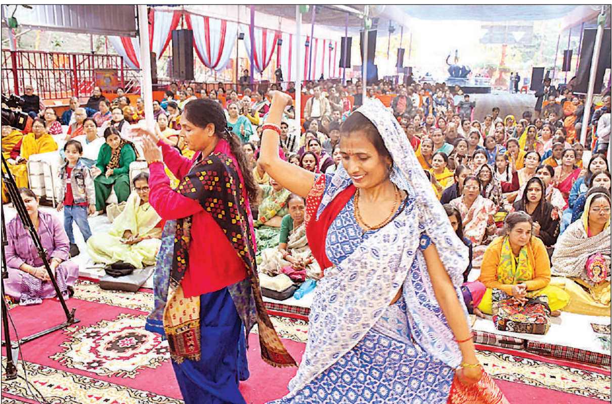
गोमती तट स्थित खाटू श्याम मंदिर में श्रीमद्भगवत कथा के दौरान भक्ति भाव में थिरकती महिलाएं।