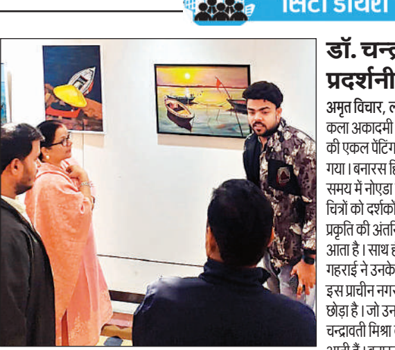
प्रदर्शनी में चित्र देखते लोग।