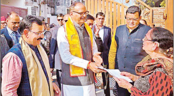
महिला मतदाता को एसआईआर फॉर्म देकर जानकारी देते हुए उपमुख्यमंत्री।