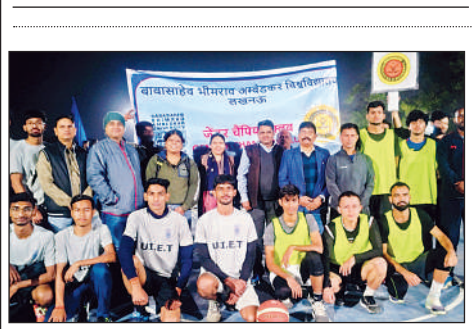
बीबीएयू में स्पोर्ट इवेंट की विजेता टीम के खिलाड़ी

अमृत विचार लखनऊ : बाबासाहेब भीमराव अम्बेडकर विश्वविद्यालय में आयोजित “स्पोर्ट्स इवेंट-2025” का समापन हुआ। इवेंट 11 नवंबर से 28 नवंबर तक विश्वविद्यालय में आयोजित किया गया था। खो-खो में बालिका वर्ग में स्कूल ऑफ फिजिकल एंड डिस्सीप्लिन साइडर ने व बालक वर्ग में स्कूल ऑफ मैनेजमेंट एंड कॉमर्स ने प्रथम स्थान प्राप्त किया। कबड्डी में बालिका वर्ग में स्कूल ऑफ मैनेजमेंट एंड कॉमर्स ने व बालक वर्ग में यूआईआईटी ने प्रथम स्थान तथा फुटबॉल में बालिका वर्ग में पृथ्वी व पर्यावरण विज्ञान विद्यापीठ एवं बालक वर्ग में यूआईआईटी ने प्रथम स्थान प्राप्त किया। क्रिकेट में बालिका वर्ग में स्कूल ऑफ मैनेजमेंट एंड कॉमर्स ने प्रथम व बालक वर्ग में यूआईआईटी ने प्रथम स्थान हासिल किया।