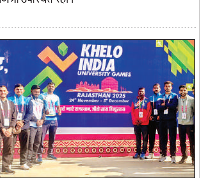
लखनऊ विश्वविद्यालय की रग्बी टीम के खिलाड़ी