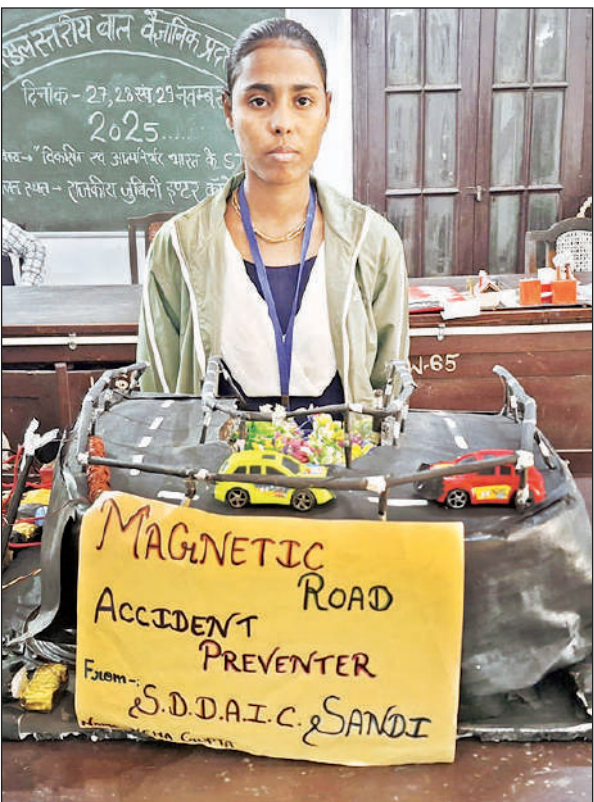
मॉडल के साथ छात्रा।

आज होगी पुरस्कार की घोषणा : तीन दिनों तक चलने वाले मंडलीय बाल वैज्ञानिक प्रदर्शनी का आज अंतिम दिन है। आज दोपहर बाद प्रदर्शनी का फाइनल राउंड मूल्यांकन होगा और विजेताओं की घोषणा की जाएगी। इसके अलावा सर्वश्रेष्ठ प्रयास, नवाचार, चिंतन देने वाले छात्रों को भी प्रोत्साहित किया जाएगा। प्रदर्शनी के विजेता छात्र-छात्राएं राज्य व राष्ट्रीय प्रदर्शनी के लिए प्रतिस्पर्धा की तैयारी करेंगे।