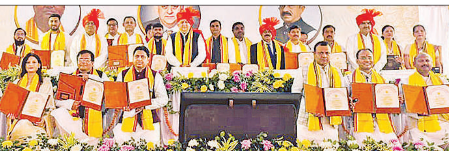
उपाधि प्राप्त करने के बाद कुलाधिपति और कुलपति के साथ विद्यार्थी।