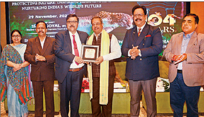
नवाब वाजिद अली शाह प्राणि उद्यान के स्थापना दिवस कार्यक्रम में मौजूद अतिथि और अधिकारी।

■ दर्शकों के टिकट और समाजसेवियों की ओर वन्यजीवों को गोद लेने की बढ़ती रुचि ने इस उद्यान को लगातार आगे बढ़ाया है। संरक्षण, शोध और जागरूकता तीनों क्षेत्रों में यह प्राणी उद्यान आज प्रदेश का प्रमुख केंद्र बन चुका है।