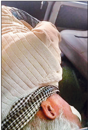
वैन में लेटा मरीज।