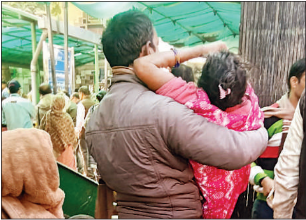
मरीज को गोद में उठाकर ले जाता तीमारदार ।