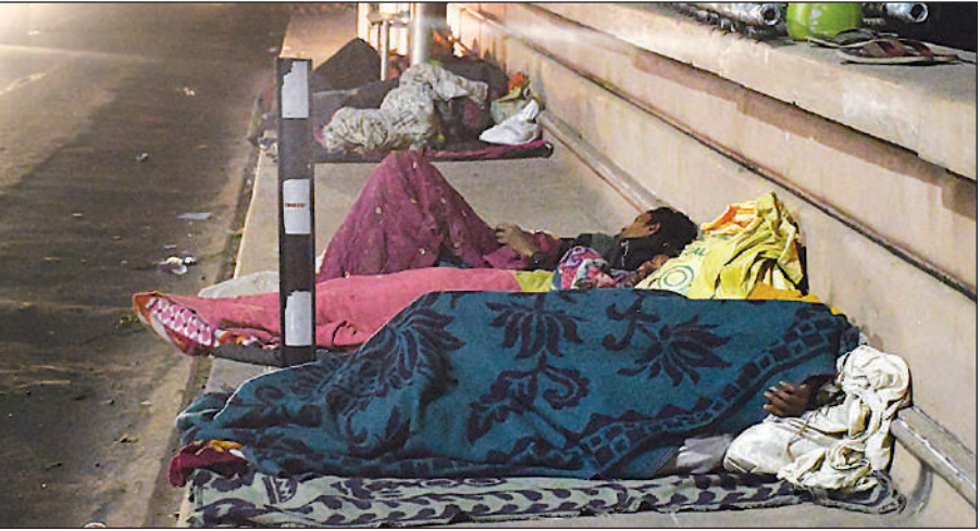
शहर के बहुखण्डी विधायक आवास के पास फुटपाथ पर खुले में सोते निराश्रित।