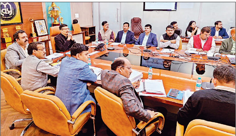
समीक्षा बैठक में मंडलायुक्त, एलडीए उपाध्यक्ष एवं अन्य अधिकारी।

अमृत विचार : हजरतगंज में 440 करोड़ रुपये से एकीकृत मंडलीय कार्यालय बनेगा। इसके लिए वजीर हसन रोड पर 6 एकड़ भूमि चिन्हित की गई है। यहां 6 मंजिला इंटीग्रेटेड कार्यालय बनेगा, जिसमें 63 विभाग एक छत के नीचे होंगे। 4 मंजिला कोर्ट रूम व मल्टीलेवल पार्किंग भी बनाई जाएगी। शनिवार को मंडलायुक्त की अध्यक्षता में हुई समीक्षा बैठक में परियोजना का प्रेजेन्टेशन दिया गया। मंडलायुक्त विजय विश्वास पंत की अध्यक्षता में एलडीए के पारिजात सभागार में समीक्षा बैठक हुई। इसमें मंडलायुक्त ने निर्देश दिए कि बिल्डिंग को इस तरह डिजाइन किया जाए कि भविष्य में अनुरक्षण में कम से कम व्यय हो। एलडीए उपाध्यक्ष प्रथमेश कुमार ने बताया कि वाराणसी व गोरखपुर में एकीकृत मंडलीय कार्यालय की डीपीआर बनाने वाली ऑफ़िटेक्ट फर्म मुरालेज से ही लखनऊ एकीकृत मंडलीय