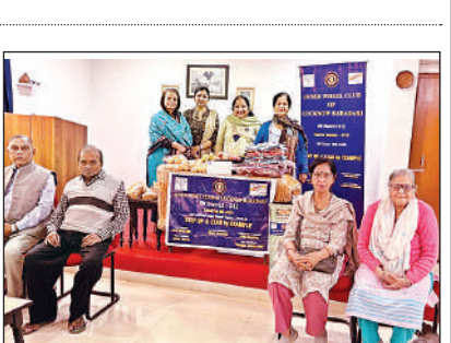
कार्यक्रम में मौजूद वलब की सदस्य व वरिष्ठ नागरिक।