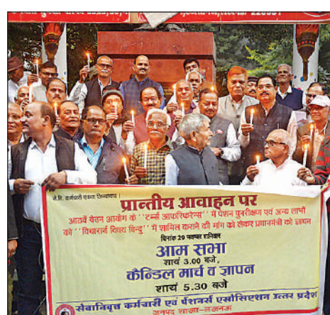
कैंडल मार्च निकालते पेंशनर्स।