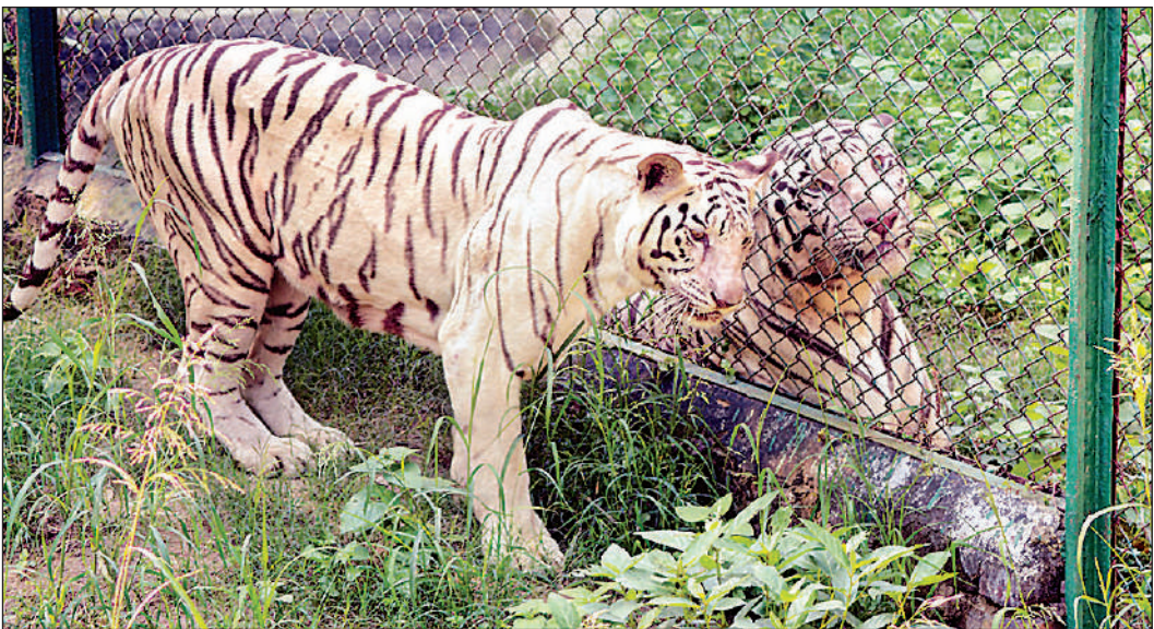
नवाब वाजिद अली शाह प्राणि उद्यान में अपने बाड़े में अठखेलियां करते शेर।