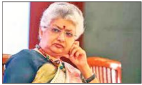
● सोनीपत में एक कार्यक्रम में हाल की ऐसी घटनाओं पर चिंता जताई

न्यायमूर्ति नागरत्ना शनिवार को हरियाणा के सोनीपत में ओपी ज़िंदल ग्लोबल यूनिवर्सिटी में न्यायपालिका की स्वतंत्रता पर अंतरराष्ट्रीय सम्मेलन में बोल रही थीं। उन्होंने कहा कि न्यायिक स्वतंत्रता की विकसित समझ वह अपेक्षा करती है कि ‘‘हमारा विधिक तंत्र यह आश्वासन दे’’ कि किसी न्यायाधीश द्वारा दिया गया फैसला समय की कसौटी पर कायम रहे, क्योंकि वह ‘‘स्याही से लिखा जाता है, रेत पर नहीं’। उन्होंने कहा, कानूनी विरादरी और प्रशासनिक ढांचे के सभी प्रतिभागियों का यह कर्तव्य है कि वे किसी निर्णय का सम्मान करें, केवल कानून में निहित परंपराओं के अनुसार ही आपत्तियां उठाएं और केवल इसलिए उसे खारिज न करें,