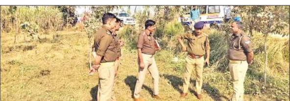
सूचना पर मौके पर पहुंचे सीओ और प्रभारी निरीक्षक।