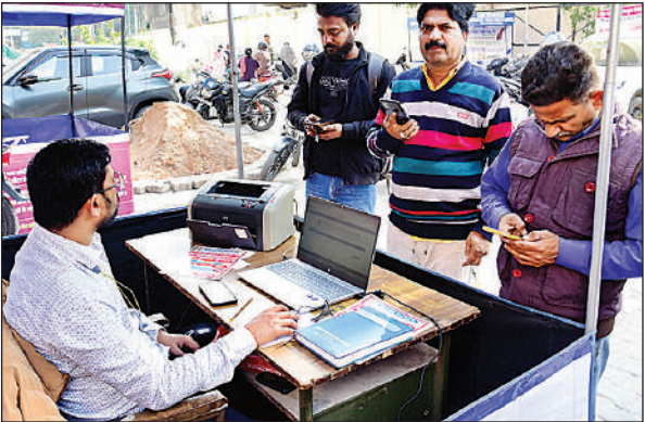
ओटीएस योजना के तहत लगाए गए स्टॉल पर जानकारी लेते उपभोक्ता।