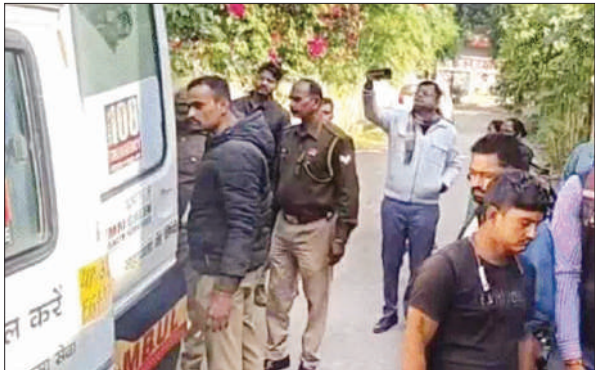
एंबुलेंस के पास मौजूद परिजन व पुलिसकर्मी।