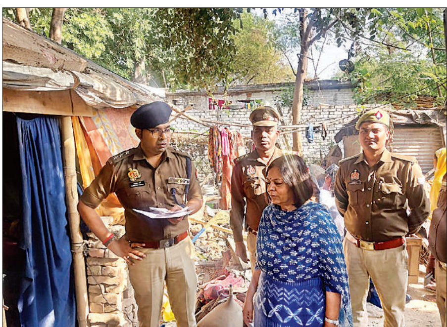
झुग्गी झोपड़ी में जाकर अभियान चलाने पुलिस अधिकारी