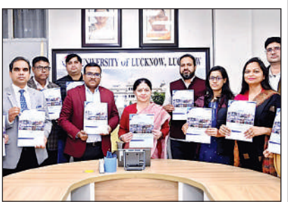
वार्षिक न्यूज लेटर का विमोचन करतीं कुलपति व अन्य।