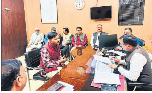
नगर निगम कार्यालय में जन सुनवाई दिवस में लोगों की समस्याएं सुनते अधिकारी ।