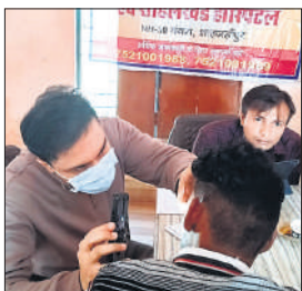
शिविर में जांच कराते ग्रामीण।

शिविर में 86 मरीजों की ब्लड शुगर जांच और लगभग 109 मरीजों की ब्लड प्रेशर जांच निशुल्क की गई। इसके साथ ही 414 मरीजों को मुफ्त दवाइयों का वितरण किया गया। एमआरआई, सीटी स्कैन और अन्य जांचों पर छूट के कूपन भी