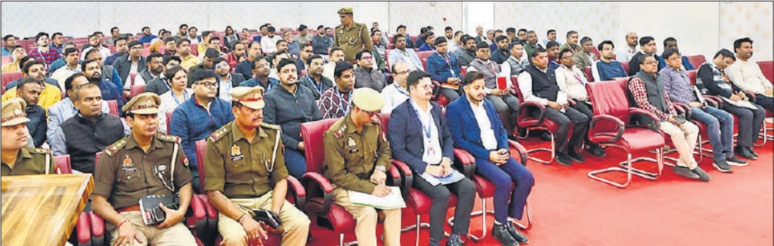
पुलिस लाइन सभागार में आयोजित साइबर सुरक्षा गोष्ठी में उपस्थित पुलिस अधिकारी।

अमृत विचार : पुलिस लाइन सभागार में जिले के विभिन्न बैंकों के शाखा प्रबंधकों के साथ एक महत्वपूर्ण साइबर सुरक्षा गोष्ठी आयोजित हुई। कार्यक्रम की अध्यक्षता पुलिस अधीक्षक शाहजहांपुर ने की। इस दौरान पुलिस अधीक्षक नगर, क्षेत्राधिकारी साइबर क्राइम, साइबर थाना-साइबर सेल के अधिकारी, प्रतिसार निरीक्षक और प्रमुख बैंकों के शाखा प्रबंधक उपस्थित रहे। गोष्ठी का उद्देश्य बैंकिंग क्षेत्र में बढ़ते साइबर अपराधों के प्रति जागरूकता बढ़ाना, बैंक पुलिस समन्वय को और सुदृढ़ करना तथा वित्तीय धोखाधड़ी की रोकथाम के प्रभावी उपायों पर संयुक्त रणनीति तैयार करना रहा। कार्यक्रम को संबोधित करते हुए एसपी ने कहा साइबर अपराध आज का सबसे बड़ा वित्तीय खतरा है। सतर्कता, जागरूकता और त्वरित कार्रवाई ही इसका सबसे प्रभावी बचाव है। उन्होंने निर्देश दिए कि कई शाखाओं में म्यूल अकाउंट संचालित पाए गए हैं जिनमें कुछ कर्मचारियों की भूमिका संदिग्ध प्रतीत होती है। ऐसे कर्मचारियों को चिन्हित कर आवश्यक कार्रवाई करने और सूचना उपलब्ध कराने के निर्देश दिए। उन्होंने कहा कि कई मामले ऐसे होते हैं जिनमें बैंक की त्वरित सहायता से पीड़ित की धनराशि वापस कराई जा सकती है, इसलिए साइबर सेल और सभी थानों में गठित साइबर टीम को आवश्यक सहयोग दिया जाए।