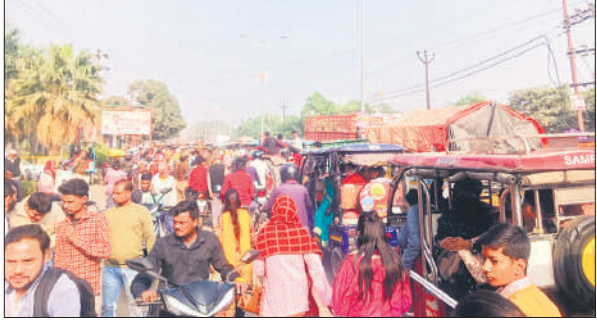
अस्पताल गेट के बाहर जाम लगाए परिवार वाले ।