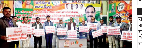
स्लोगन लिखी तख्तियां लेकर निकले संगठन के लोग।