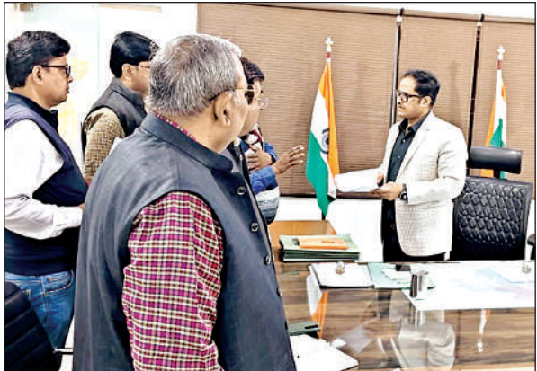
जिलाधिकारी पुलकित गर्ग को ज्ञापन देते सचिव।