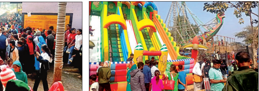
मेले में लगे बड़े-बड़े झूलों का आनंद लेते लोग।