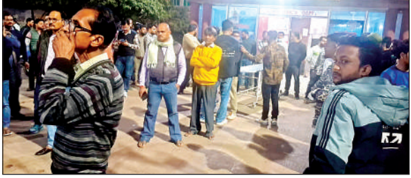
हादसे की सूचना पर जिला अस्पताल में लगी भीड़।