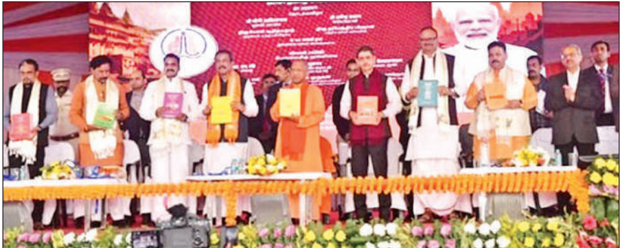
वाराणसी : काशी तमिल संगमम् कार्यक्रम में पुस्तक का विमोचन करते मुख्यमंत्री योगी, केंद्रीय शिक्षा मंत्री धर्मेंद्र प्रधान, तमिलनाडु के राज्यपाल आरएन रवि, पुडुचेरी के उपराज्यपाल के. कैलासनाथन, केंद्रीय राज्य मंत्री डॉ. एल मुरुगन, उप मुख्यमंत्री ब्रजेश पाठक व अन्य