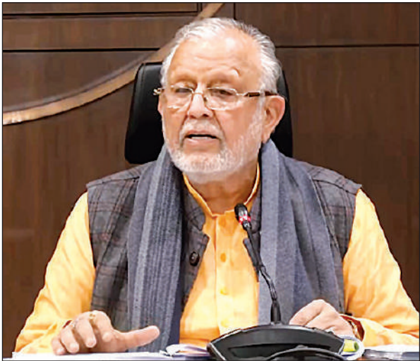
कैबिनेट के फैसलों की जानकारी देते वित्त मंत्री सुरेश खन्ना।

यूपी कैबिनेट के फैसले : 582.74 करोड़ रुपये की परियोजनाओं से लाखों लोगों को मिलेगा फायदा