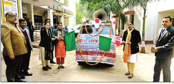
प्रचार वाहन को हरी झंडी दिखाकर रवाना किया गया।