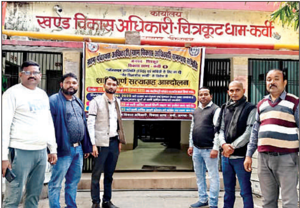
आनलाइन उपस्थिति पर विरोध जताते सचिव।

(पी0डी0 विश्वकर्मा) जिला कार्यक्रम अधिकारी / नियुक्ति प्राधिकारी चित्रकूट।