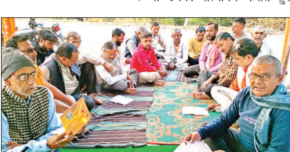
बैठक के दौरान चर्चा करते पदाधिकारी।

फर्रुखाबाद। पुलिस अधीक्षक के निर्देश पर अमृतपुर थाना पुलिस ने अपने क्षेत्र में शांति और कानून-व्यवस्था बनाए रखने के लिए एक विशेष पैदल गश्त अभियान चलाया। पुलिस टीमों ने अमृतपुर क्षेत्र के प्रमुख बाजारों, भीड़भाड़ वाले इलाकों और मुख्य मार्गों पर पैदल भ्रमण किया। इस दौरान सुरक्षा व्यवस्था का जायजा लिया गया और संदिग्ध व्यक्तियों पर कड़ी निगरानी रखी गई।