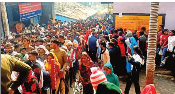
मंदिर में दर्शन को उमड़ी आस्थावानों की भारी भीड़।