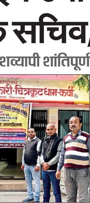
आनलाइन उपस्थिति पर विरोध जताते सचिव।

कार्तिक पूर्णमासी से आगहन मास की पूर्णिमा तक तुलसीतीर्थ में मेला लगता है। अंतिम मंगलवार को