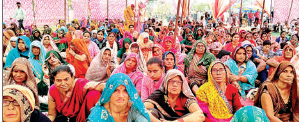
शतचंडी महायज्ञ में कथा की अमृत वर्षा से सराबोर हुए श्रद्धालु।