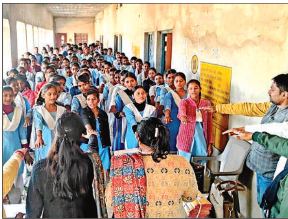
बाल विवाह की रोकथाम के लिए शपथ दिलाई गई।