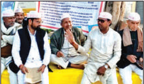
बेमियादी धरने पर बैठे किसान।