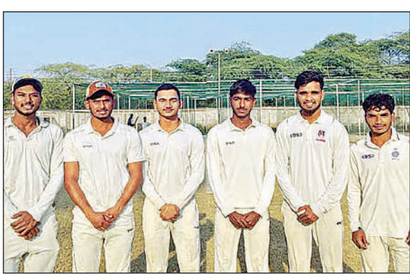
टीम में चयनित क्रिकेट खिलाड़ी।