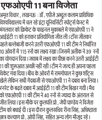
एफओएपी 11 बना विजेता