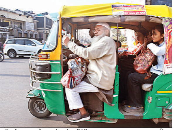
परमिट तीन का सवारी छह, ओवरलोड ऑटोरिक्षा।