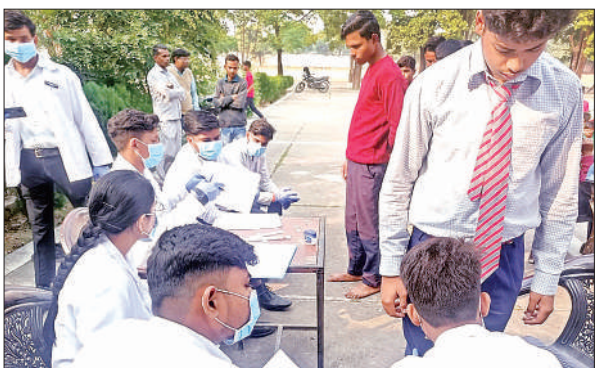
बच्चों का परीक्षण करते विश्वविद्यालय के छात्र।

कैप में बच्चों और अभिभावकों को कृत्रिम अंग, ऑर्थोटिक