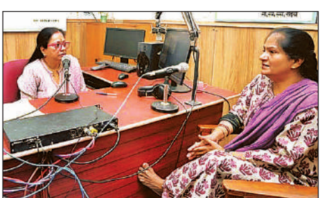
एड्स के बारे में अकागत कराती शिक्षिका।