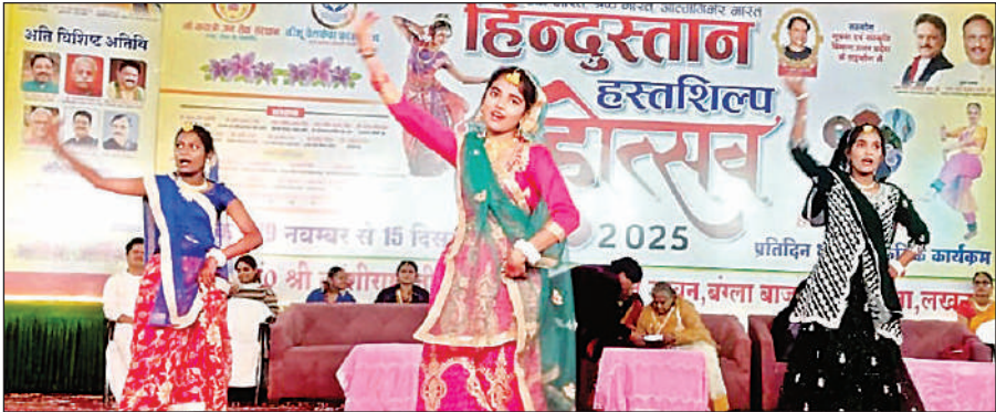
आशियाना स्थित कांशीराम स्मृति उपवन में चल रहे हिन्दुस्तान हस्तशिल्प महोत्सव में नृत्य करते बच्चे।