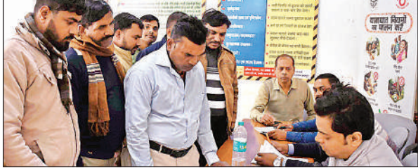
संविदा भर्ती के लिए रोजगार मेले में पहुंचे अभ्यर्थी।

अवध बस स्टेशन कैम्प में चल भर्ती प्रक्रिया चल रही है। अवध डिपो के सहायक क्षेत्रीय प्रबंधक ने बताया कि शार्दियों का सौजन चलने के कारण ज्यादातर चालक निजी आयोजनों में काम कर रहे हैं। वहां उन्हें बेहतर