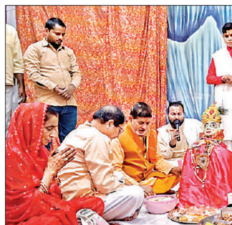
भागवत कथा सुनते भक्त।