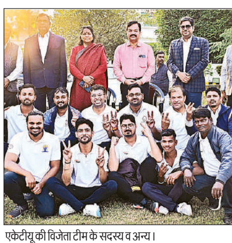
एकेटीयू की विजेता टीम के सदस्य व अन्य।