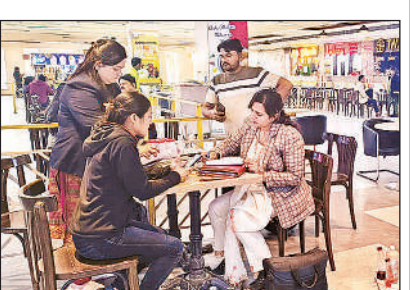
मॉल के फूड कोर्ट से नमूने लेती एफएसडीए टीम।