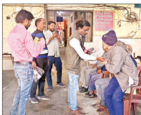
बुजुर्ग को वस्त्र देते अखिल भारतीय उद्योग व्यापार मंडल के पदाधिकारी।