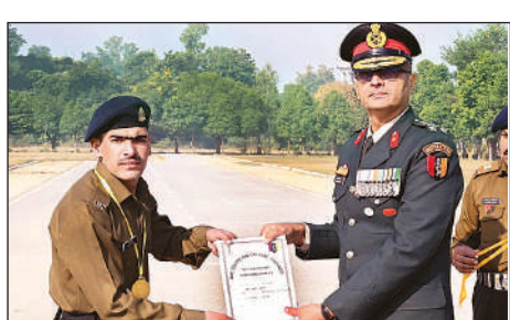
छावनी स्थित एएमसी सेंटर प्रांगण में प्रमाण पत्र देते सेना के उच्च अधिकारी।