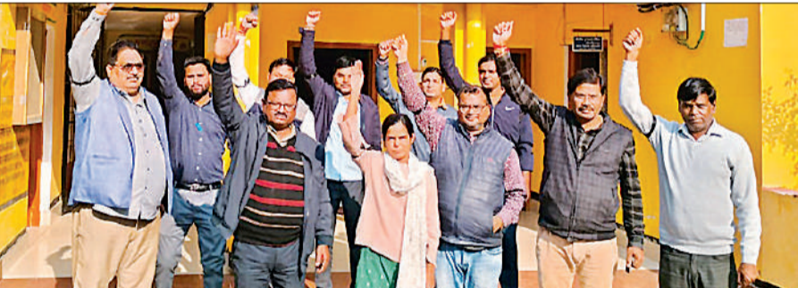
ऑनलाइन हाजिरी का विरोध करते पंचायत सचिव।

बाद में संगठन जिलाधिकारी डॉ. राजागणपति आर. से मिला और विधिक कार्रवाई सहित अन्य मांगों पर उपलब्ध करा दी गयी हैं। उन्होंने कहा कि दावे व आपत्तियां 16 दिसंबर तक दाखिल की जा सकती हैं।