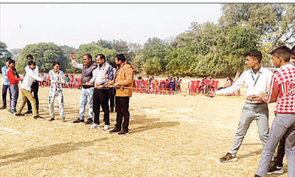
रस्साकशी प्रतियोगिता में भाग लेते दिव्यांग बच्चे।

सीतापुर, अमृत विचार : अटरिया के कंटाईन मजरा अंबरपुर में हरिपाल की झोपड़ी में शाम करीब 4 बजे आग लग गई। झोपड़ी में बंधी बकरियां बाहर नहीं निकल सकीं और आठ की मौके पर ही मौत हो गई, जबकि 11 खुदस गईं।