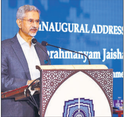
मोबिलिटी इम्प्रेरेटिव पर भारत के विश्व वार्षिक सम्मेलन के दौरान सभा को संबोधित करते विदेश मंत्री एस जयशंकर ।

विदेश मंत्री एस. जयशंकर ने बुधवार को कहा कि सीमाओं के पार पेशेवरों के प्रवाह में बहुत अधिक बाधाएं पैदा करने वाले देशों को कुल मिलाकर नुकसान होगा और भारत को अन्य देशों को यह समझाने की जरूरत है कि प्रतिभा का इस्तेमाल पारस्परिक लाभ के लिए है। गतिशीलता पर एक सम्मेलन में आयोजित संवादात्मक सत्र के दौरान दिए गए उनके बयान ट्रंप प्रशासन की आब्रजन पर सख्ती के अनुरूप अमेरिका द्वारा एच-1बी वीजा पर नया शुल्क लगाने के फैसले की पुष्ट्युभि में आए हैं। जयशंकर ने कहा कि अगर वे प्रतिभा के प्रवाह में बहुत ज्यादा रुकावटें खड़ी करते हैं, तो उन्हें कुल मिलाकर नुकसान होगा। खासकर अगर आप उन्नत विनिर्माण के युग में प्रवेश कर रहे हैं, तो आपको और ज्यादा प्रतिभा की जरूरत होगी।वह एच-1बी वीजा कार्यक्रम पर चिंताओं सहित आब्रजन से जुड़े व्यापक मुद्दों पर पूछे गए एक प्रश्न का उत्तर दे रहे थे। किसी देश का नाम लिए बगैर