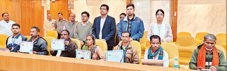
कार्यक्रम में प्रशस्ति पत्र के साथ दिव्यांगजन व मौजूद अधिकारी।