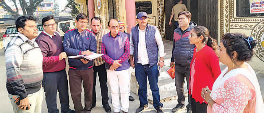
पीएचसी के निरीक्षण के दौरान जानकारी लेते जिलाधिकारी।