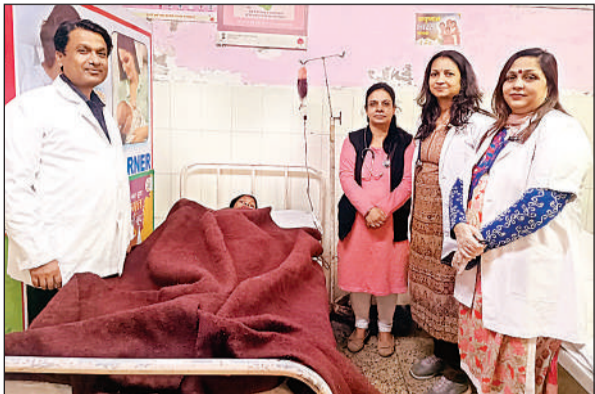
एफआरयू ऊंचाहार में भर्ती महिला रोगी।