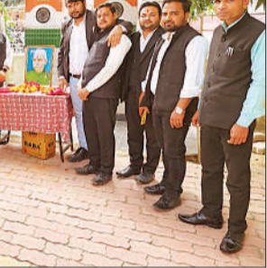
प्रथम राष्ट्रपति के चित्र पर माल्यार्पण करते अधिवक्ता।