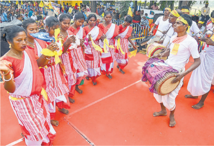
कोलकाता में अंतर्राष्ट्रीय विकलांग दिवस के अवसर पर आयोजित एक कार्यक्रम के दौरान प्रस्तुति देते हुए लोक कलाकार ।