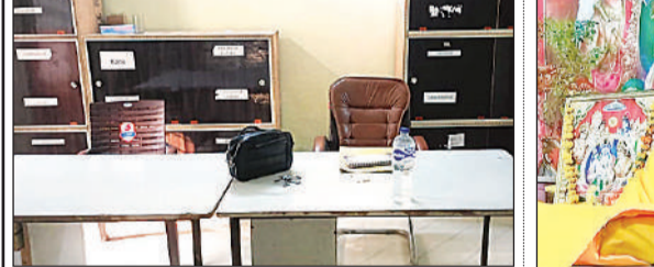
ब्लॉक में अधिकारी की खाली पड़ी कुर्सी।

ब्लॉक दिवस का नहीं हुआ आयोजन संग्रामपुर (अमेठी)। महीने के प्रथम तृतीय बुधवार को ब्लॉक दिवस का आयोजन खंड विकास अधिकारी के अध्यक्षता में किया जाता है जिसमें सरकार की विभिन्न योजनाओं की जानकारी दी जाती है साथ में ब्लॉक पर आए फरियादी की समस्या सुनकर उसका समाधान किया जाता है। लेकिन अमेठी जिले के ब्लॉक संग्रामपुर में ऐसा कुछ नहीं हुआ। ब्लॉक पर तैनात खंड विकास अधिकारी नहीं आई वहीं अन्य अधिकारी इसमें कोई रुचि नहीं दिखाई दी। यही कारण है कि संग्रामपुर ब्लॉक में नियमित कार्यक्रम समाप्त होते जा रहे हैं। और जनमानस को लाभ नहीं मिल पा रहा है। ब्लॉक पड़ता है नाथ सभी ग्राम विकास अधिकारी व पंचायत अधिकारी समय-समय पर आलाइन हाजिरी के विरोध पर मनमर्जी से कम कर रही है व अपने इच्छा अनुसार काम कर रहे हैं।