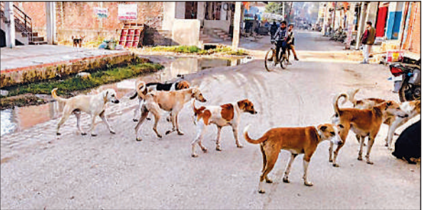
नगर के बीचों-बीच सड़क पर घूमते आवारा कुत्ते।

बेनीगंज, हरदोई, अमृत विचार। नगर में आवारा कुत्तों से लोग पहले ही परेशान थे, अब पिछले कुछ समय से बंदरों का आतंक भी शुरू हो गया है। सुबह-सुबह घर से निकलना हो या बाजार में खरीदारी करना, हर जगह बंदरों और कुत्तों के हमले का डर लोगों को सताता रहता है। नगर की गलियों में अब हर कदम पर खौफ का साया मंडरा रहा है। स्कूल जाते-आते बच्चों को सबसे ज्यादा भय रहता है कि कहीं बंदर या कुत्ते के हमले के शिकार न हो जाएं। बंदर कब पीछे से आकर चुपके से हाथ से सामान छीन ले जाए कोई पता नहीं। नगर के लोगों ने बताया आए दिन बंदर घरों के बाहर तोड़-फोड़ करते हैं, बालकनी में रखे फूलों के गमले नीचे गिरा देते हैं, घर के बाहर धूप में सूख रहे कपड़े लेकर भाग जाते हैं, उन्हें गंदा कर देते हैं, पक्षियों के लिए रखा गया दाना-पानी भी ड़धर-उधर फेंक देते हैं, बंदरों की