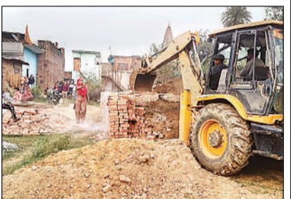
अतिक्रमण दहाता बुलडोजर।