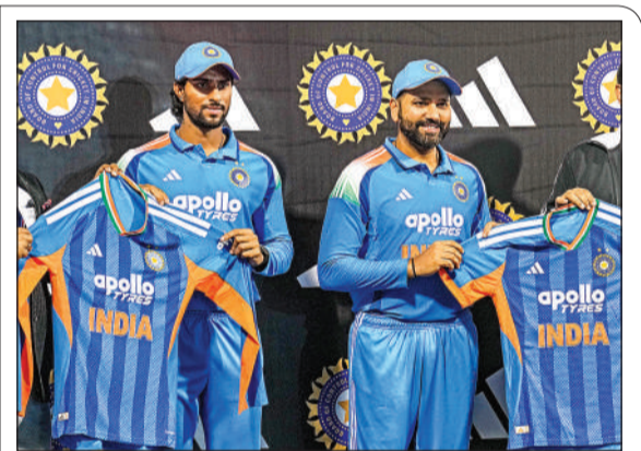
टी-20 विश्व कप की जर्सी का अनावरण करते तिलक वर्मा व रोहित शर्मा।

वह गर्दन की चोट के कारण गुवाहाटी में खेले गए दूसरे टेस्ट और मौजूदा एकदिवसीय श्रृंखला में नहीं खेल पाए। बोर्ड ने एक बयान में कहा कि गिल की भागीदारी हालांकि बीसीसीआई के ‘सेंटर ऑफ एक्सीलेंस’ से उनकी फिटनेस पर मिलने वाली मंजूरी पर निर्भर करेगी। एशिया कप 2025 फाइनल और ऑस्ट्रेलिया में पांच मैच की श्रृंखला में नहीं खेलने वाले पंड्या ने भी मंगलवार को हैदराबाद में पंजाब के खिलाफ सैयद मुश्ताक अली ट्रॉफी मैच के दौरान अपनी फिटनेस साबित करने के बाद भारतीय टीम में वापसी की। भारत और दक्षिण अफ्रीका के बीच पांच मैच की टी20 सीरीज नी दिसेंबर से कटक में शुरू होगी। इसके लिए टीम का चयन करने के लिए बुधवार को यहां चयन समिति की बैठक हुई। सूर्यकुमार यादव भारत के नियमित टी20 कप्तान हैं।