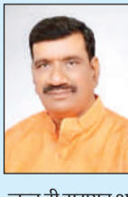
जल्द ही सरायन अपने पुराने स्वरूप में देखी जाएगी।

आदेश पर उन्होंने सीतापुर आकर बैठक की। उन्होंने स्थलीय निरीक्षण कर संबंधित अफसरों के साथ बैठक कर डीपीआर तैयार की गई। इस प्रोजेक्ट को राष्ट्रीय स्वच्छ गंगा मिशन के प्रोजेक्ट डायरेक्टर को भेजा गया था। इसके बाद नदी में जलस्तर बढ़ाया जाना था। हालांकि