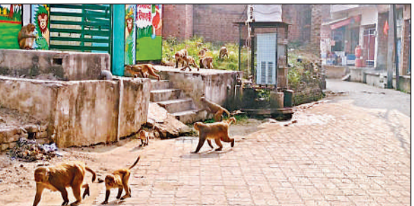
नगर के मोहल्लों में निकलते बंदरों का झुंड।

वजह से टहलने और सर्दी में धूप सेकने से भी लोग बचते हैं। बंदरों का झुंड आकर बुजुर्गों, महिलाओं और बच्चों को परेशान करते हैं,