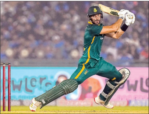
शतकीय पारी के दौरान शॉट लगाते दक्षिण अफ्रीका के एडेन मार्करम।

इससे पहले कोहली ( 102 रन, 93 गेंद, सात चौके, दो छक्के) और गायकवाड़ ( 105 रन, 83 गेंद, 12 चौके, दो छक्के) ने शतक जड़ने के अलावा तीसरे विकेट के लिए 195 रन की सझेदारी भी की जो दक्षिण अफ्रीका के खिलाफ एकदिवसीय अंतरराष्ट्रीय में इस विकेट की भारत की सबसे बड़ी साझेदारी है। कप्तान लोकेश राहुल ने भी अंतिम ओवरों में 43 गेंद में छह चौकों और दो छक्कों से नाबाद 66 रन की उम्दा पारी खेली। भारत को एक बार फिर टॉस गंवाने के बाद पहले बल्लेबाजी का मौका मिला। टीम की शुरुआत खराब रही। रोहित