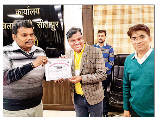
बीएलओ को सम्मानित करते जिलाधिकारी।

विधायक ने कहा कि किसानों की आय बढ़ाने के लिए सरकार निरंतर प्रयास कर रही है और आधुनिक तकनीक, गुणवत्तापूर्ण बीज व सरकारी योजनाओं का लाभ हर किसान तक पहुंचाना प्राथमिकता है। कार्यक्रम में किसानों को रबी फसलों की उन्नत कृषि तकनीक, उर्वरक प्रबंधन, रोग-कीट नियंत्रण और जल संरक्षण जैसी जानकारीयों दी गई। साथ ही किसानों को निशुल्क मसूर बीज भी वितरित किए गए।