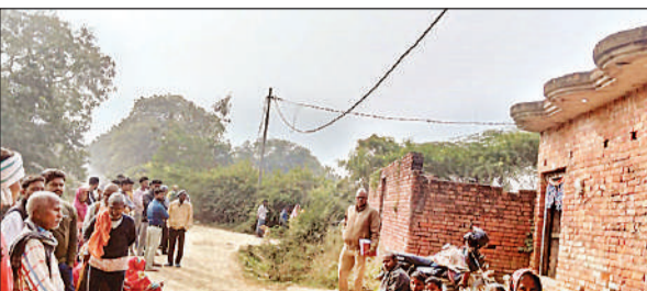
मृतक के घर के बाहर लगी भीड़ व मौजूद पुलिस।