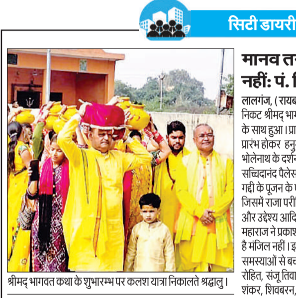
श्रीमद् भागवत कथा के शुभारम्भ पर कलश यात्रा निकालते श्रद्धालु।

के बाद अमानक बीज पाए जाने पर संबंधित विक्रेताओं पर नियमानुसार कड़ी कार्रवाई की जाएगी। विभाग ने किसानों को गुणवत्तापूर्ण बीज उपलब्ध कराने के लिए यह अभियान चलाया है। इसी के साथ