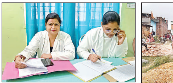
कार्य का संचालन करतीं स्वास्थ्यकर्मी।