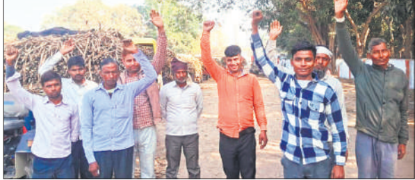
चीनी मिल यार्ड में नारेबाजी करते किसान।