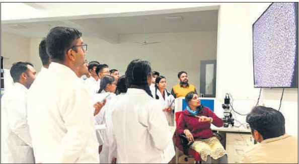
छात्र-छात्राओं को जानकारी देते डॉक्टर।