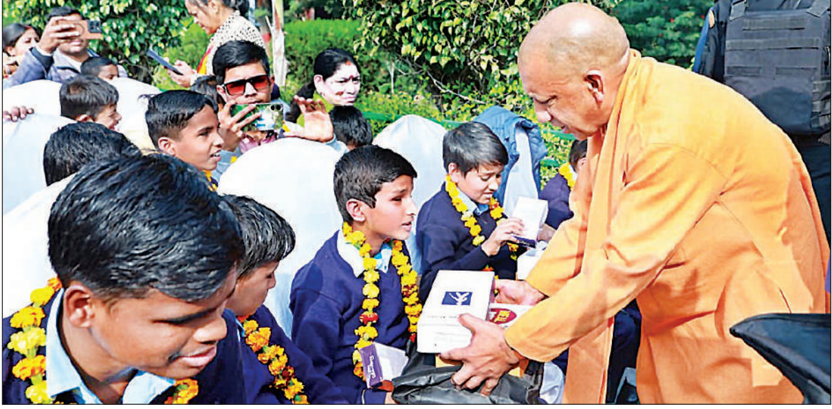
विश्व दिव्यांग दिवस के मौके पर लखनऊ में आयोजित राज्यस्तरीय कार्यक्रम में दिव्यांग छात्रों को उपहार देते मुख्यमंत्री योगी आदित्यनाथ।