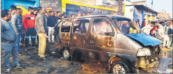
जली हुई कार के पास लगी भीड़।