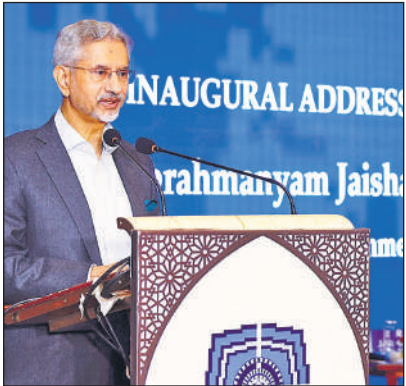
मोबिलिटी इम्प्रेरेंटिव पर भारत के विश्व वार्षिक सम्मेलन के दौरान सभा को संबोधित करते विदेश मंत्री एस जयशंकर।

विदेश मंत्री एस. जयशंकर ने बुधवार को कहा कि सीमाओं के पार पेशेवरों के प्रवाह में बहुत अधिक बाधाएं पैदा करने वाले देशों को कुल मिलाकर नुकसान होगा और भारत को अन्य देशों को यह समझाने की जरूरत है कि प्रतिभा का इस्तेमाल पारस्परिक लाभ के लिए है। गतिशीलता पर एक सम्मेलन में आयोजित संवादात्मक सत्र के दौरान दिए गए उनके बयान ट्रंप प्रशासन की आग्रजन पर सख्ती के अनुरूप अमेरिका द्वारा एच-1बी वीजा पर नया शुल्क लगाने के फैसले की पृष्ठभूमि में आए हैं। जयशंकर ने कहा कि अगर वे प्रतिभा के प्रवाह में बहुत ज्यादा रुकावटें खड़ी करते हैं, तो उन्हें कुल मिलाकर नुकसान होगा। खासकर अगर आप उन्नत विनिर्माण के युग में प्रवेश कर रहे हैं, तो आपको और ज्यादा प्रतिभा की जरूरत होगी।वह एच-1बी वीजा कार्यक्रम पर चिंताओं सहित आग्रजन से जुड़े व्यापक मुद्दों पर पूछे गए एक प्रश्न का उत्तर दे रहे