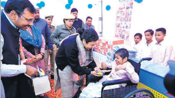
दिव्यांग बच्चे को व्हील चेयर पर बिठाकर दुलार करतीं डीएम।