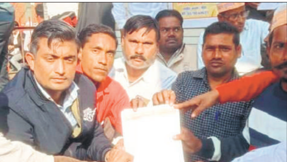
गोला में तहसीलदार को ज्ञापन देते दिव्यांग।