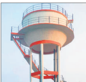
गांव त्रिलोकपुर में सफेद हाथी बनी टंकी।

● पांच साल से दूषित पानी पी रहे गांव त्रिलोकपुर के लोग ● चार सप्ताह में जवाब दाखिल करने का कोर्ट ने दिए आदेश