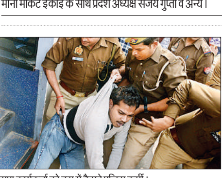
सपा कार्यकर्ता को बस में बैठाते पुलिस कर्मी।