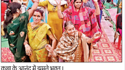
कथा के आनंद में झूमते भवत।