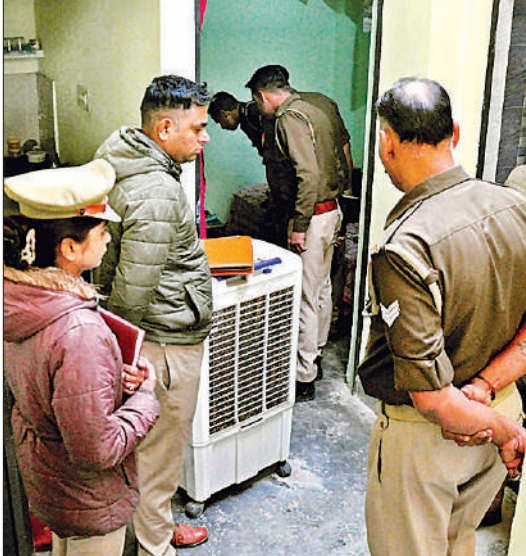
घर के अंदर तत्परीश करते पुलिसकर्मी।