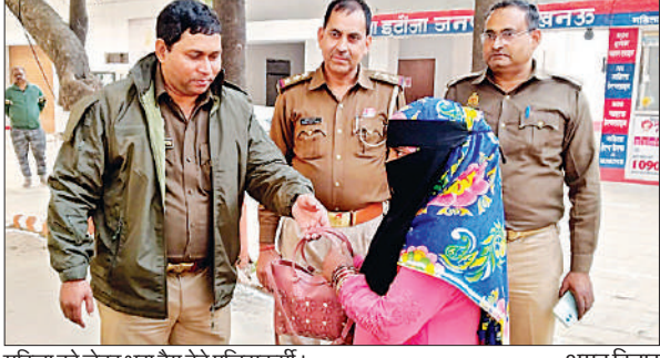
महिला को जेवर भरा बैग देते पुलिसकर्मी।