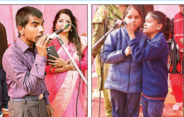
सरस्वती वंदना और युगल गायन प्रस्तुत करते दृष्टि बाधित बच्चे।