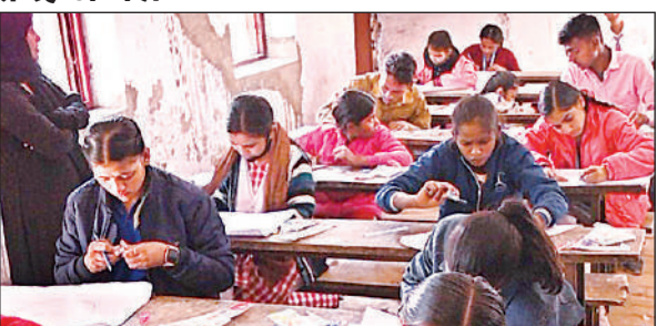
प्रतियोगिता में सुलेख लिखते दिव्यांग विद्यार्थी।