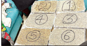
एयरपोर्ट पर यात्रियों के पास से बरामद विदेशी गांजा।