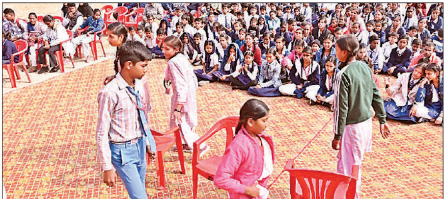
श्व दिव्यांगता दिवस पर आयोजित कुर्सी दौड़ प्रतियोगिता में प्रतिभाग करते दिव्यांग बच्चे।