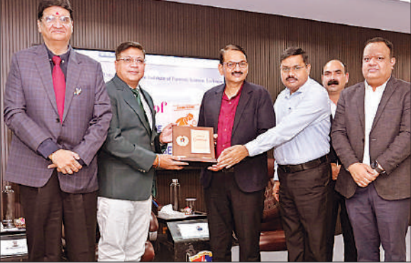
क्राइम सीन मैनेजमेंट कोर्स शुभारंभ करते अधिकारी।