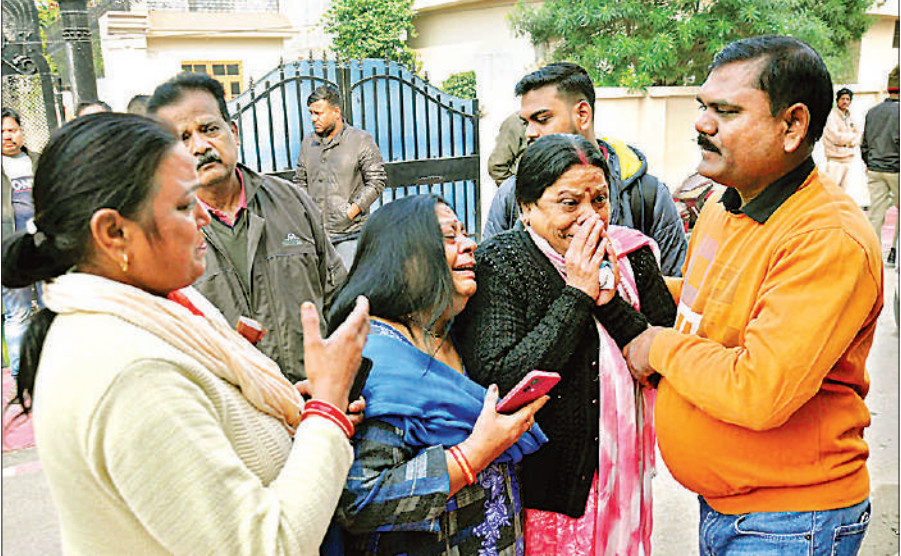
घटनास्थल पर रोती मृतका की बहनें।