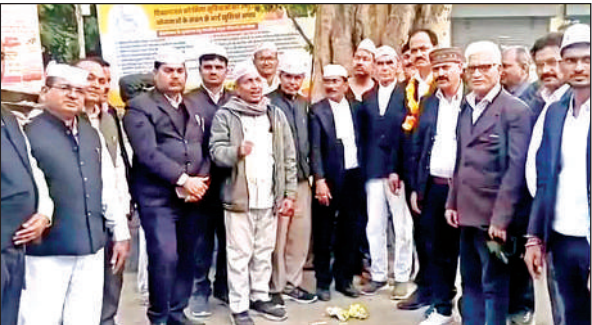
घरने के दौरान खड़े अधिवक्ता व किसान।

पीड़िता ने बताया कि बीती रात दहेज कम दिए जाने का ताना मारते हुई पति, सास ससुर व ननद ने मिलकर मारपीट कर जान से मारने की धमकी दी।