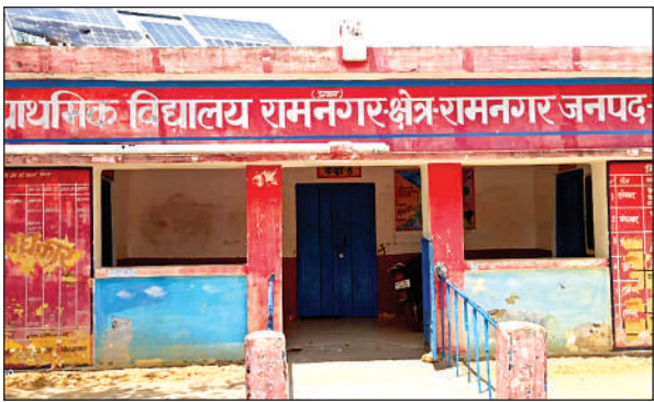
बंद पड़ा उच्च प्राथमिक विद्यालय।

बैठने तक को जगह नहीं: शुरुआत में बीआरसी के संसाधन भी कम थे। ऐसे में जगह भी ज्यादा नहीं लगती थी। पर बेसिक शिक्षा विभाग