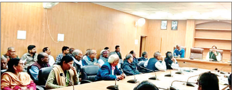
बैठक में एडीएम व मौजूद पेंशनर।

किसान नेता ने यह भी आरोप लगाया कि उन्हें धरना समाप्त करने के लिए लगातार दबाव बनाया जा रहा है। किसानों की इस लड़ाई में अधिवक्ताओं ने जुड़कर उनको मजबूती प्रदान की है। अधिवक्ताओं ने किसानों के बीच बैठकर कहा कि यह न्याय की लड़ाई है। पैसे हड़पने वालों को सजा दिलाने और निष्पक्ष व पारदर्शी जांच की मांग की।