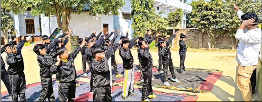
वार्षिक महोत्सव की तैयारी करते नन्हें बच्चे।