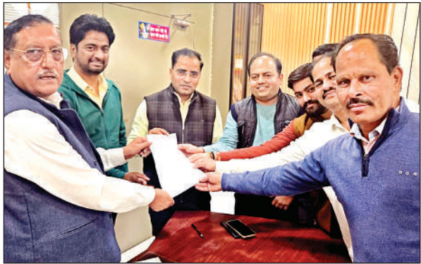
चेयरमैन व ईओ को ज्ञापन सौंपते संगठन के लोग।