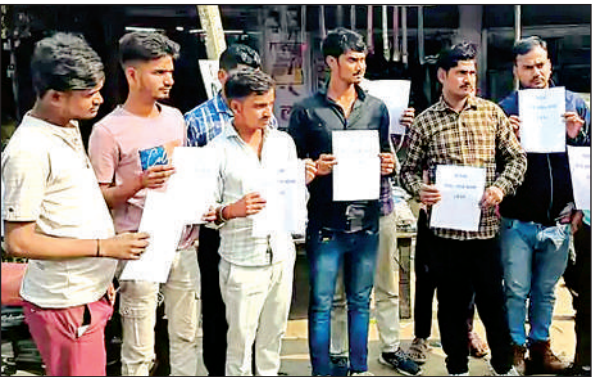
साइबर टगी से सम्बन्धित उपलब्ध करए गए पत्रकों के साथ छात्र।