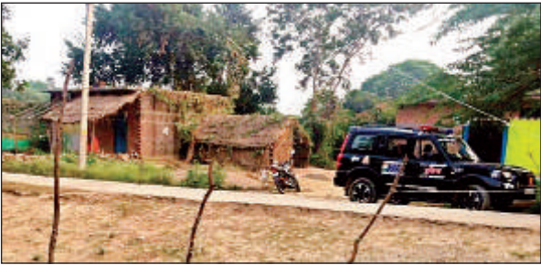
उमराहट के पुरवा में पसरा सन्नाटा व खड़ी यूपी 112 की गाड़ी।