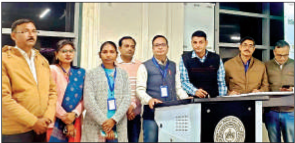
आईआईटी कानपुर में मौजूद शिक्षक।