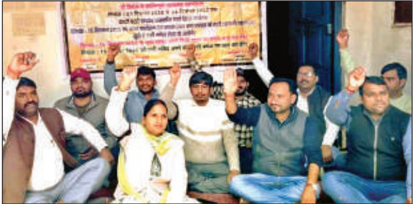
धरना-प्रदर्शन करते पंचायत सचिव।

प्रशिक्षण का उद्देश्य शिक्षकों को आधुनिक डिजिटल तकनीक, कंप्यूटर संचालन, ऑनलाइन शिक्षण प्लेटफॉर्म, डेटा प्रबंधन, साइबर सुरक्षा और कृत्रिम बुद्धिमत्ता (एआई) आधारित शैक्षिक उपकरणों की उन्नत जानकारी प्रदान करना था। साथ ही जूनियर कक्षाओं के नए विज्ञान पाठ्यक्रम में शामिल एमएस वर्ड, एमएस