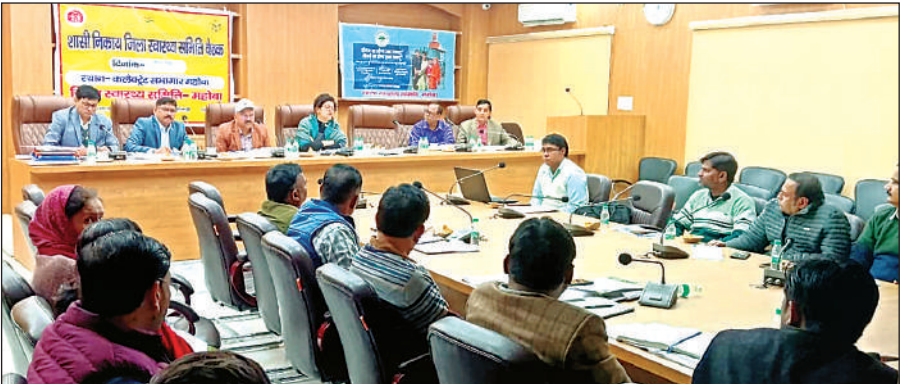
जिला स्वास्थ्य समिति की बैठक में निर्देश देती जिलाधिकारी गजल भारद्वाज।

बैठक में जिलाधिकारी ने जनपद के 102, 108 एवं एएलएस एंबुलेंस के मैनेजर को निर्देशित किया कि किसी भी परिस्थिति में किसी मरीज को लाने ले जाने में विलंब न हो अन्यथा उक्त के विरुद्ध अनुशासनात्मक कार्रवाई की जाएगी। उन्होंने सभी मुख्य