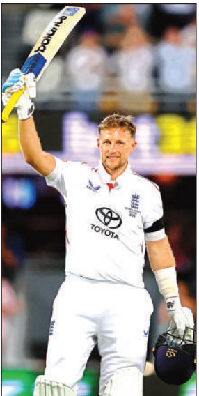
एशेज सीरीज में शतक लगाने के बाद जश्न मनाते इंग्लैंड के जो रूट।

चिली, ओमान और स्विट्जरलैंड के साथ पूल बी में शामिल भारत ने शानदार प्रदर्शन करके पहले स्थान पर रहते हुए नाकआउट दौर में प्रवेश किया। भारतीय टीम ने पूल चरण में 29 गोल किए और एक भी गोल नहीं सकता है। भारत ने आखिरी बार सभी 24 टीमों में सर्वश्रेष्ठ स्टाइक रेट है। लेकिन पीआर श्रीजेश की कॉचिंग वाली टीम यह बात अच्छी तरह जानती है कि इन परिणामों का आगे कोई महत्व नहीं होगा, क्योंकि टूर्नामेंट के अंतिम चरण में उनका सामना मजबूत टीमों से होगा।