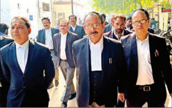
जिलाधिकारी से मिलने जाने अधिवक्ता ।

वकीलों ने कहा कि उपरोक्त अधिकारी के समक्ष कर्मकार क्षतिपूर्ति सम्बन्धी पत्रावलिया विचाराधीन चल रही हैं। उक्त पत्रावलियों में आदेश पारित करने के