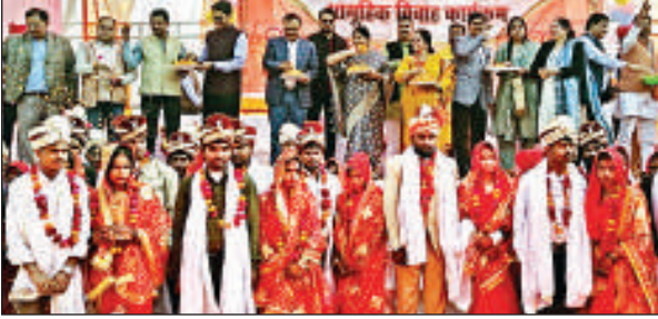
सामूहिक विवाह कार्यक्रम में वर- वधु को आशीर्वाद देती सदर विधायक, डीएम व अन्य ।

मालायें पहनाई । कार्यक्रम की मुख्य अतिथि सदर विधायक सरिता भदौरिया ने सभी वर, वधुओं को आशीर्वाद देते हुए कहा कि सभी जोड़े सलामत रहे आगे आने वाला आप सबका जीवन सुखमय हो यही कामना है। उन्होंने कहा कि जितने जोड़े आज विवाह के बन्धन में बंध रहे हैं सभी एक दूसरे का सम्मान करें, घर के बड़े बुजुर्गों का सम्मान कर उनका भी आशीर्वाद लें, जब आप एक दूसरे का सम्मान करेंगे तो समाज में आपका भी सम्मान होगा। उन्होंने कहा कि प्रदेश सरकार द्वारा गरीब, निर्धन, परिवारो की पुत्रियों को शादी कराने का लिया गया निर्णय बहुत ही सराहनीय है।