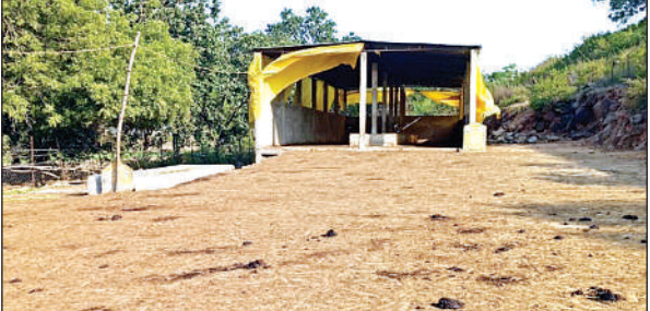
रामनगर अंतर्गत पहाड़ी गांव की खाली पड़ी गौशाला।

रामनगर क्षेत्र की एक आध गौशालाओं को छोड़कर बाकी जगहों की स्थिति गंभीर है। गांववाले नाम छिपाते हुए आरोप लगाते हैं कि गौशालाओं में अन्ना मवेशियों को भूसा नहीं सिर्फ खड़ी पराली खाने को दी जा रही है, जो टंड में घातक है। अधिकांश गौशालाओं के बाहर पराली का पहाड़ लगा हुआ है। गुरुवार को रामनगर क्षेत्र के ग्राम पंचायत पहाड़ी की गौशाला में एक भी मवेशी दिन के दो बजे तक नजर नहीं आए। जानकारी पर ग्रामीणों ने बताया कि यहां दिन में गोवंश चरने