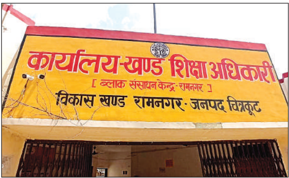
खंड शिक्षाधिकारी और बीआरसी कार्यालय।

आकांक्षी ब्लॉक रामनगर में बेसिक शिक्षा विभाग का ब्लॉक स्तरीय कार्यालय जगह के अभाव में विद्यालय के भवन में संचालित हो रहा है। शिक्षकों की मानें तो कई साल से ऐसे ही चल रहा है। रामनगर के बुजुर्ग बताते हैं कि पहले जिले के अधिकारी ही स्कूल की निगरानी करते थे बाद में स्कूलों की संख्या बढ़ी और सुदूर ग्रामीण अंचलों तक स्कूलों का विस्तार हुआ। ब्लॉक स्तर पर भी एक अधिकारी