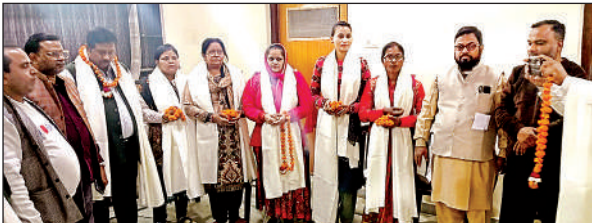
बीएलओ को सम्मानित करते वार्ड नागरिक।