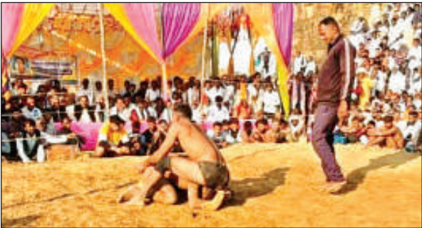
दंगल में दांवपेच दिखाते पहलवान।