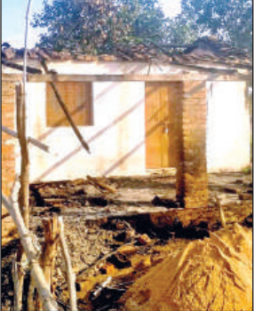
आग से जली बाबा की कुटिया।

जखेला गांव में बुधवार की रात्रि करीब 9 बजे हनुमान तालाब के किनारे बनी बाबा की कुटिया में आराजकतत्वों ने आग लगा दी। आग से कुटिया पूरी तरह से जल कर खाक हो गई। वहीं जब आग लगी तो बाबा कुटिया में नहीं थे। आग की लपटों को देख ग्रामीणों की भीड़ जमा हो गई और ग्रामीणों ने डायल 112 को सूचना दी। मौके पर पहुंची