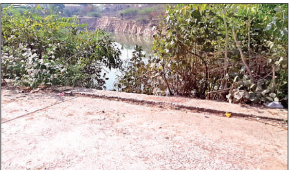
सड़क किनारे बना बिना रेलिंग का तालाब।

तालाब की खुदाई करने वालों और जिला प्रशासन ने सड़क किनारे कोई रेलिंग की व्यवस्था नहीं की है, जिससे 24 घंटे आवागमन में खतरा बना रहता है। इतना ही नहीं अब इस रोड पर मेरिज हाउस और होटल भी खुल गए साथ ही तमाम लोगों ने अपने मकानों का भी निर्माण करा लिया, जिस कारण अब इस रोड में पहले से ज्यादा आवागमन होने