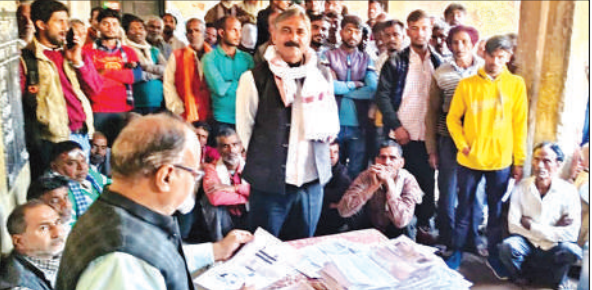
खाद लेने के लिए समिति पर मौजूद किसान।

इस कार्यक्रम में लोगों को एचआईवी एड्स के प्रति जागरूक किया गया तथा बताया गया कि एचआईवी एड्स से घबराये नहीं बल्कि कैसे बचाव एवं इलाज कराएं इसके लिए सचिव जिला विधिक सेवा प्राधिकरण फर्रुखाबाद एवं सीएमएस तथा उनके महिला एवं पुरुष स्टाफ ने लोगों को जागरूक कर प्रेरित किया।