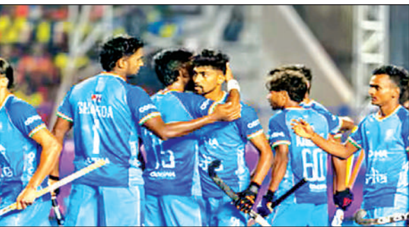
जूनियर हॉकी विश्व कप के एक मैच दौरान भारतीय खिलाड़ी।