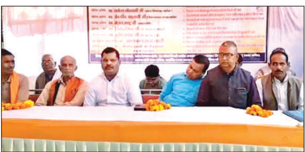
कार्यक्रम में मौजूद मुख्य अतिथि व अन्य।