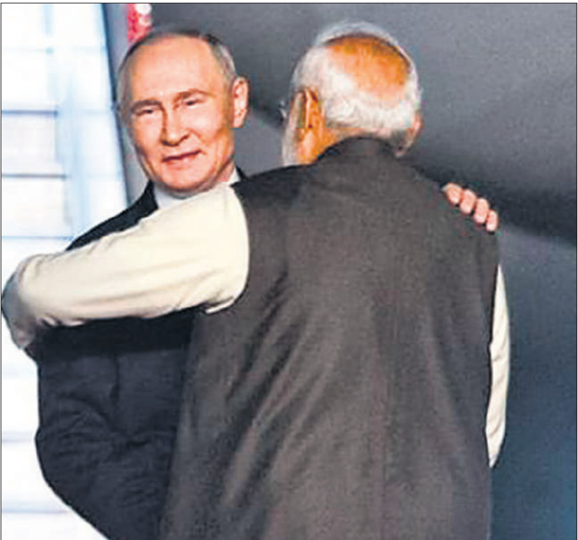
रूसी राष्ट्रपति व्लादिमीर पुतिन के नई दिल्ली आगमन पर उनका स्वागत करते प्रधानमंत्री नरेंद्र मोदी।

दोनों नेताओं के बीच बैठक से पहले शुक्रवार सुबह राष्ट्रपति भवन में पुतिन का औपचारिक स्वागत किया जाएगा। बैठक हैदराबाद हाउस में होगी, जहां मोदी राष्ट्रपति पुतिन और उनके प्रतिनिधिमंडल के लिए भोज