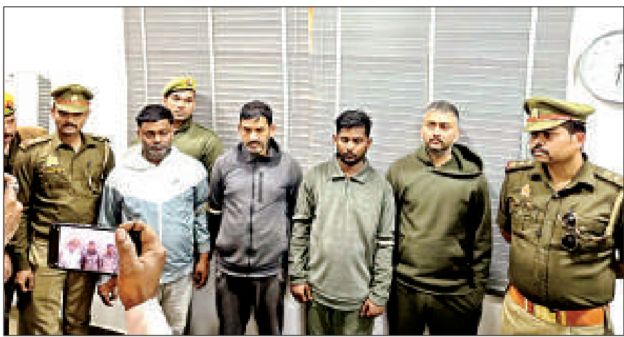
पकड़े गए कार चोर गिरोह के सदस्यों के साथ पुलिस टीम।