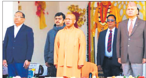
गोरखपुर में समारोह के उद्घाटन अवसर पर मुख्यमंत्री योगी व अन्य।

गुरुवार को महाराणा प्रताप शिक्षा परिषद के संस्थापक सप्ताह समारोह-2025 के उद्घाटन अवसर पर योगी बोल रहे थे। इसके पहले योगी के साथ राज्य आपदा प्रबंधन प्राधिकरण के