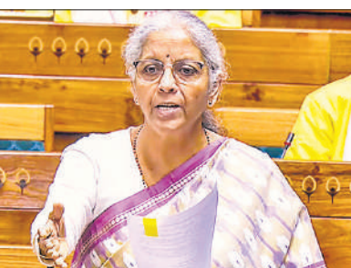
लोकसभा में विधेयक पर चर्चा करती निर्मला सीतारमण