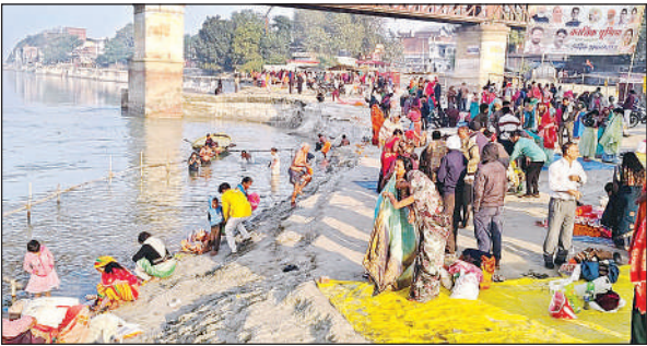
पूर्णिमा पर गंगा स्नान करते श्रद्धालु।

बता दें कि हिन्दू मान्यता के अनुसार पूर्णिमा तिथि के दिन गंगा स्नान विशेष रूप से की जाती है। लेकिन मार्गशीर्ष पूर्णिमा को मोक्षदायिनी पूर्णिमा कहा जाता है। मान्यता है कि स्नान-दान करने से 32 गुना अधिक पुण्य मिलता