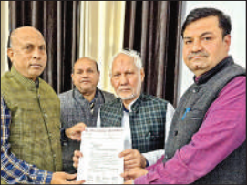
ज्ञापन सौंपते संगठन के पदाधिकारी।