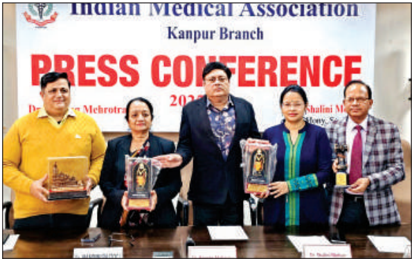
अवॉर्ड के साथ आईएमए के पदाधिकारी।