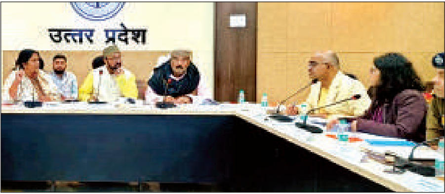
विकास कार्यों और कानून-व्यवस्था की समीक्षा बैठक करते जिले के प्रभारी व उच्च शिक्षा मंत्री योगेन्द्र उपाध्याय।

बैठक में जनप्रतिनिधियों ने प्रभारी मंत्री से कहा कि शहर में पशुओं के दुर्घटनाग्रस्त हो जाने पर उनके उपचार के लिए मथुरा तक लेकर जाना पड़ता है। इसपर प्रभारी मंत्री ने कहा कि कानपुर जैसे महानगर में गंभीर रूप से घायल पशुओं के समुचित उपचार के लिए उपयुक्त चिकित्सकीय व्यवस्था के लिए संबंधित विभाग शासन स्तर पर पत्राचार करें। यह जरूरी है, जिससे पशुओं को गंभीर स्थिति में जनपद स्तर पर ही समुचित उपचार मिल सके। प्रभारी मंत्री ने दक्षिण क्षेत्र