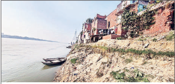
मिश्रा कॉलोनी में कटान के मुहाने पर इस तरह खड़े हैं कई मकान।