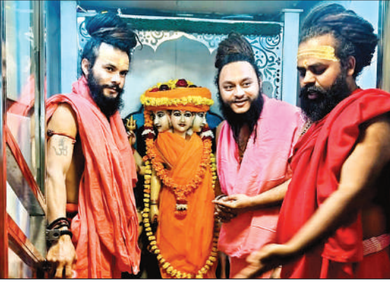
जूना अखाड़ा के संतों ने मनाई दत्तात्रेय की जयंती।