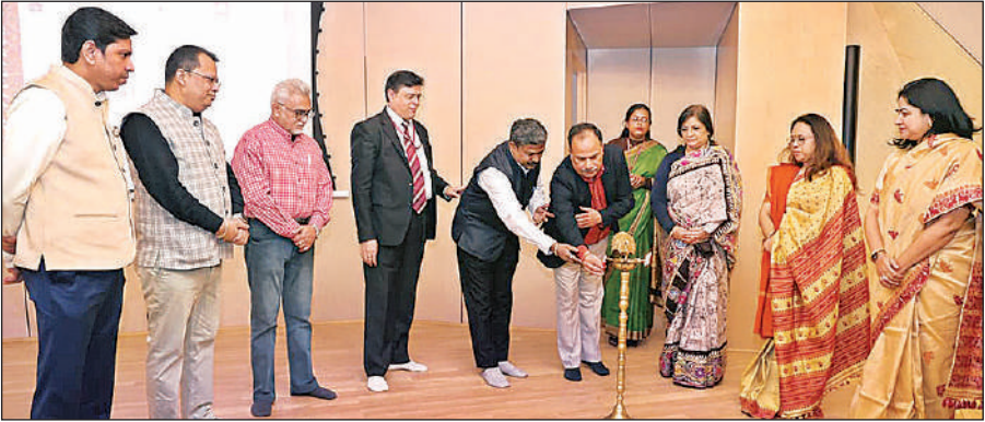
दीप जलाकर नेशनल सेमिनार का शुभारंभ करते अतिथि।