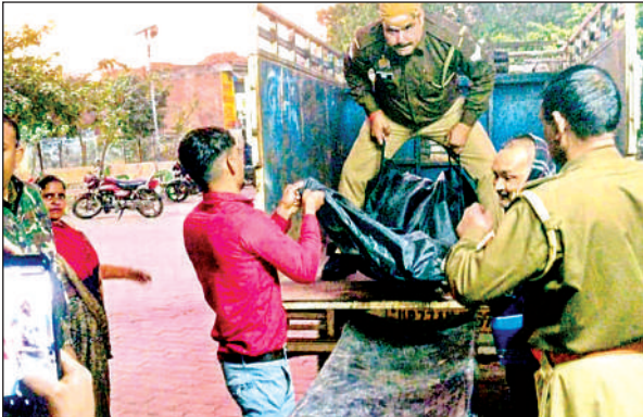
शव को ले जाते पुलिस कर्मी व अन्य।