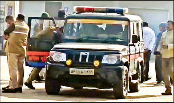
मांवर गांव के पेट्रोल पंप पर जांच को पहुंची एनआईए की टीम। कार्रवाई के दौरान वच्पे पर तैनात रही पुलिस।