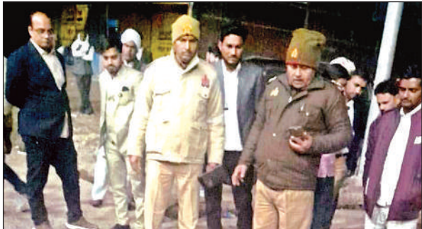
घटनास्थल पर जांच-पड़ताल करती सुमेरपुर पुलिस ।