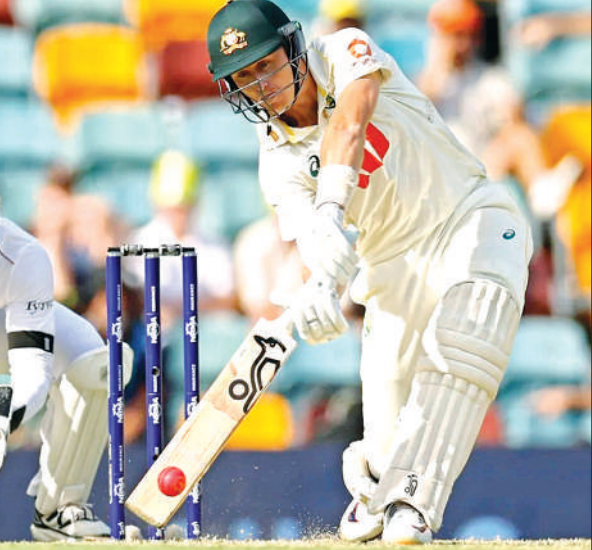
अर्धशतकीय पारी के दौरान शॉट लगाते ऑस्ट्रेलिया के बल्लेबाज मार्नस लाबुशेन।