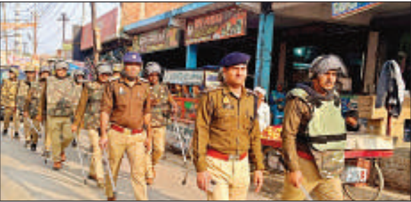
पैदल मार्च करती पुलिस।