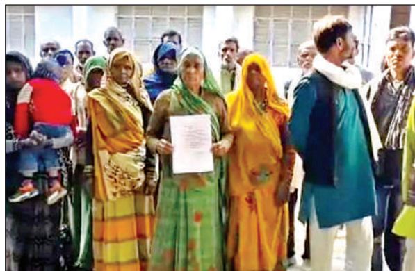
डीएम कार्यालय के बाहर ज्ञापन देने के लिए खड़े ग्रामीण।