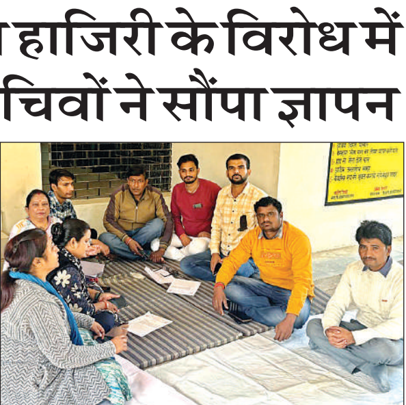
महेवा ब्लाक में शुक्रवार को धरना देते पंचायत सचिव।