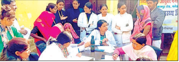
मरीजों का उपचार करते चिकित्सक।