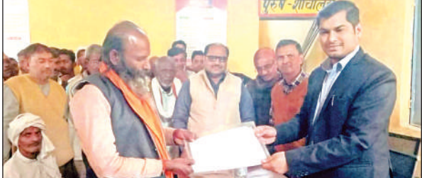
अभिलेख वितरण करते अधिकारी।