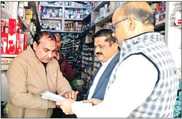
मेडिकल स्टोर में छापेमारी करते एसडीएम, सीओ और ड्रग इंस्पेक्टर ।

रही दवाओं की खरीद व विक्री का ब्योरा देने के लिए दुकानदार को तीन दिन का समय दिया गया है। इस कार्रवाई से कस्बा के मेडिकल स्टोर संचालकों में हड़कंप मच