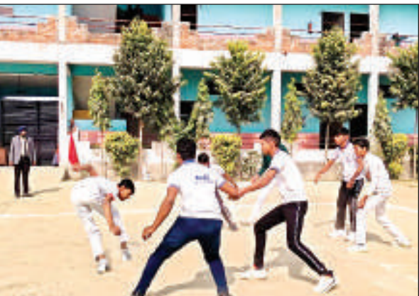
प्रतियोगिता के दौरान प्रतिभाग करते खिलाड़ी।

खिलाड़ियों को संबोधित करते हुए उन्होंने बताया कि आज का दिन सिर्फ ट्रॉफी जीतने के लिए नहीं, बल्कि अपनी क्षमताओं को परखने, खेल भावना, टीम वर्क और अनुशासन का जश्न मनाने का है। खेल हमें सिखाते हैं कि कैसे हार में भी मजबूत रहना है और जीत में विनम्र रहना है। इस प्रतियोगिता के प्रथम दिवस के समापन तक गंगा हाउस 14 गोल्ड, 6 सिल्वर तथा तीन ब्रॉन्ज के साथ प्रथम स्थान प्राप्त किया। इसके अलावा