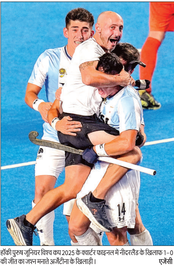
हॉकी पुरुष जूनियर विश्व कप 2025 के क्वार्टर फाइनल में नीदरलैंड के खिलाफ 1-0 की जीत का जश्न मनाते अर्जेंटीना के खिलाड़ी।

दुबई :पाकिस्तान के बैटर फखर जमां पर मैच फीस का 10 परसेंट जुर्माना लगाया गया है। 3उन्हे 29 नवंबर को श्रीलंका के खिलाफ ट्राई-सीरीज फाइनल के दौरान आईसीसी कोड ऑफ कंडक्ट के लेवल 1 को तोड़ने का दोषी पाया गया। जमाना को आईसीसी कोड ऑफ कंडक्ट के आर्टिकल 2.8 को तोड़ने का दोषी पाया गया, जो प्लेयर्स और लेवयर सपोर्ट स्टाफ के लिए है, जो इंटरनेशनल मैच के दौरान आप्थर के फैसले पर असहमति दिखाने से जुड़ा है।