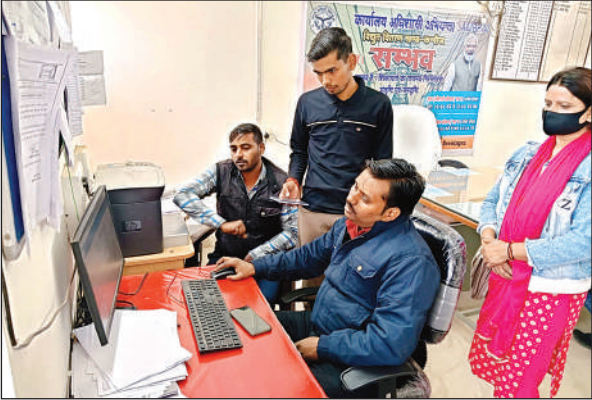
एक्सईएन विद्युत कार्यालय में कंप्यूटर पर अपना बिल दिखवाते उपभोक्ता।

सरकार की बिजली बिल राहत योजना खूब प्रचार प्रसार के बाद भी उपभोक्ताओं के गले नहीं उतर रही है। कारण जब छूट लेने लोग पहुंचते हैं तो विभाग की तरफ से पैदा की गई व्यवस्था उलझा देती हैं और संबंधित को बैरंग लौटना पड़ता है। खास यह है कि योजना के नियम ऐसे हैं जिससे यह गरीब उपभोक्ताओं को लाभ देने वाली नहीं मालूम होती। योजना की शर्त है कि यदि किसी के यहां 144