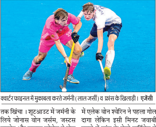
क्वार्टर फाइनल में मुकाबला करते जर्मनी (लाल जर्सी) व फ्रांस के खिलाड़ी।

दो साल पहले खेले गए फाइनल की यादें ताजा करते हुए जर्मनी ने एक बार फिर जोश से भरी फ्रांस टीम पर अपना दबदबा कायम रखा। मेयर राधाकृष्णन स्टेडियम पर यह मुकाबला देखने के लिए दोनों यूरोपीय दिग्गज टीमों के खिलाड़ियों के परिजन मौजूद थे जो लगातार हौसलाअफजाई कर रहे थे। निर्धारित समय तक स्कोर 2-2 से बराबर रहने के बाद मैच शूटआउट