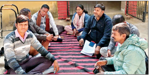
लॉक मुख्यालय पर धरना प्रदर्शन करते ग्राम पंचायत सचिव।