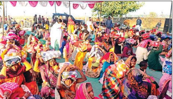
कंबल प्राप्त करने वाली महिलाएं।

आश्रम द्वारा जरूरतमंद व्यक्तियों हेतु केबल, गर्म टोपी, आंवला आहुत, आंवला रस सहित आवश्यक सामग्री का वितरण किया गया। इन सेवा कार्यों से लगभग 500 लाभार्थी लाभान्वित हुए। कार्यक्रम में योग वेदांत समिति एवं महिला मंडल की सक्रिय उपस्थिति रही। इसके अतिरिक्त युवा सेवा संघ