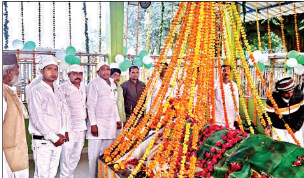
पठान बाबा की मजार पर वादरपोशी करते अकीदतमंद ।