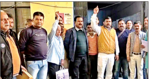
शुक्रवार को कलेक्ट्रेट में प्रदर्शन करते कोटेदार।

● मुख्यमंत्री के नाम जिला पूर्ति अधिकारी को सौंपा गया ज्ञापन