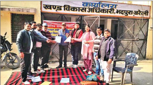
भदपुरा में बीडीओ को झापन देते सचिव।