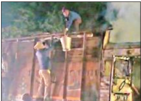
बाल्टियों में पानी लेकर आग बुझाई।

भुता, अमृत विचार : बरेली बीसलपुर मुख्य मार्ग पर चलते ट्रक में अचानक आग लग गई। ट्रक ड्राइवर ने कूद कर अपनी जान बचाई। सूचना पर पहुंची पुलिस ने स्थानीय लोगों की मदद से आग पर काबू पाया। आग लगने का कारण शर्ट सर्किट बताया जा रहा है। सड़क पर ट्रक में आग लगने से मार्ग के दोनों ओर वाहनों को रोक दिया गया। इससे वाहनों की लंबी कतारें लग गईं। शुक्रवार की रात लगभग नौ बजे बरेली बीसलपुर मुख्य मार्ग पर रसूला पेट्रोल पंप के सामने आटा मैदा भरे ट्रक में शॉर्ट सर्किट से आग लग गई। ट्रक ड्राइवर ने किसी तरह कूद कर अपनी जान बचाई। सूचना पर पहुंची पुलिस ने स्थानीय