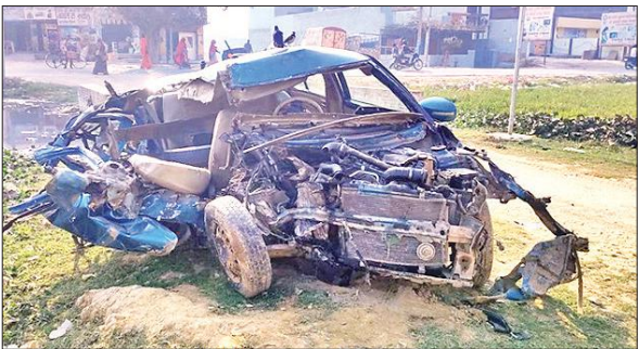
क्षतिग्रस्त कार की हालत बता रही है कि टक्कर कितनी जोरदार थी।