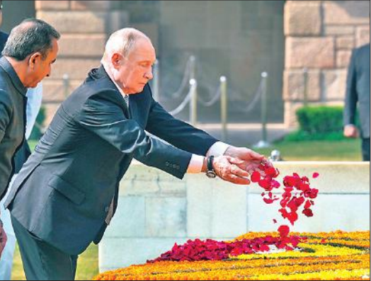
राजघाट पर महात्मा गांधी की समाधि पर श्रद्धांजलि देने पहुंचे पुतिन।

पुतिन ने राजघाट पर रखी स्मारिका में रूसी भाषा में लिखा, महात्मा गांधी ने अहिंसा और सच्चाई के जरिए हमारी धरती पर शांति के लिए एक अनमोल योगदान दिया, जिसका प्रभाव आज भी कायम है। उन्होंने लिखा कि महात्मा गांधी ने एक नई, ज्यादा निष्पक्ष और बहुधुवीय दुनिया की व्यवस्था का रास्ता दिखाया, जो अब बन रही है। रूस के राष्ट्रपति ने स्मारिका में लिखा, सामनता, आपसी सम्मान और सहयोग पर अपनी शिक्षाओं में आज भी भारत दुनिया के लोगों के साथ मिलकर और अंतरराष्ट्रीय मंच पर इन्हीं सिद्धांतों और मूल्यों की रक्षा करता है। उन्होंने यह भी लिखा, रूस भी ऐसा ही करता है।