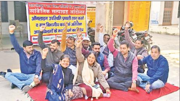
बिथरी चैनपुर में धरना देते सचिव।