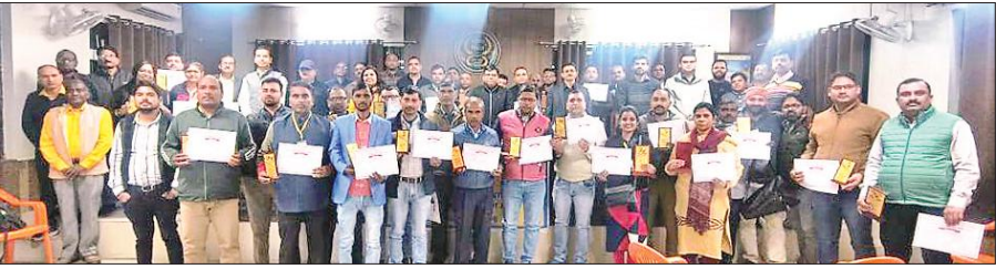
सदर तहसील में अधिकारियों के साथ सम्मानित होने वाले बीएलओ।