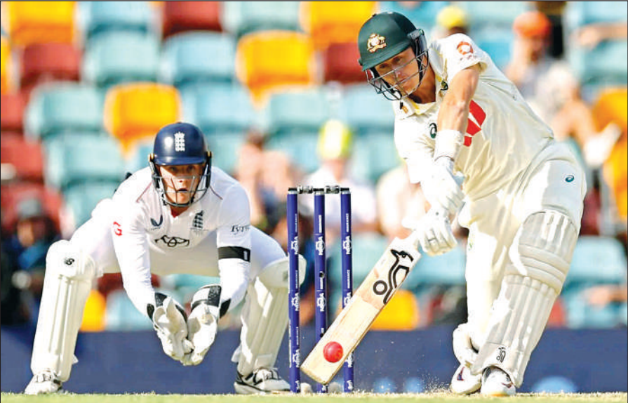
अर्धशतकीय पारी के दौरान शॉट लगाते ऑस्ट्रेलिया के बल्लेबाज मार्नस लाबुशेन।