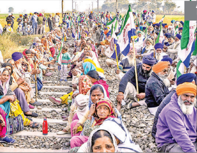
नई दिल्ली, एजेंसी

नई दिल्ली। भाजपा सांसद निशिकांत दुबे ने कांग्रेस पर 'मुस्लिम आरक्षण' को आगे बढ़ाने का आरोप लगाया और कहा कि केंद्र को अनुसूचित जाति, अनुसूचित जनजाति और ओबीसी के आरक्षण की सुरक्षा करनी चाहिए। उन्होंने लोकसभा में शून्यकाल के दौरान यह विषय उठाया। निशिकांत दुबे ने कहा कि कांग्रेस का हाथ मुसलमानों के साथ है... उसने मुस्लिम समुदाय को पहले आंध्र प्रदेश में चार प्रतिशत आरक्षण दिया और अब वही तेलंगाना और कर्नाटक में किया।