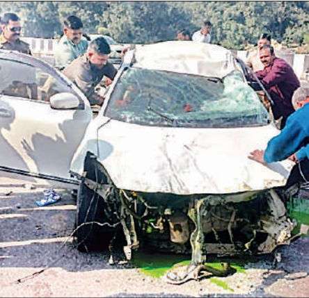
हादसे के बाद क्षतिग्रस्त कार।