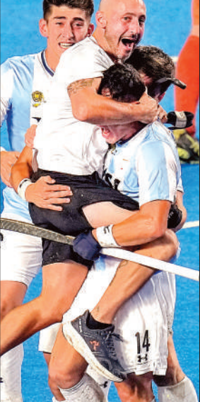
नीदरलैंड के खिलाफ जीत का जश्न मनाते अर्जेंटीना के खिलाड़ी।