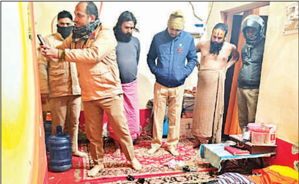
घटनास्थल की जांच करती पुलिस की टीम।