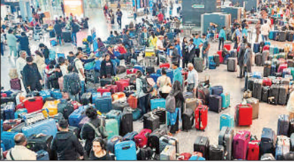
बंगलुरु हवाई अड्डे पर फैली भारी अव्यवस्था।

लोगों का गुस्सा बढ़ने और विपक्षी दलों के सरकार को घेरने के बाद डीजीसीए ने हस्तक्षेप करते हुए इंडिगो के पायलटों के लिए रात्रि ड्यूटी के कड़े नियमों से अस्थायी