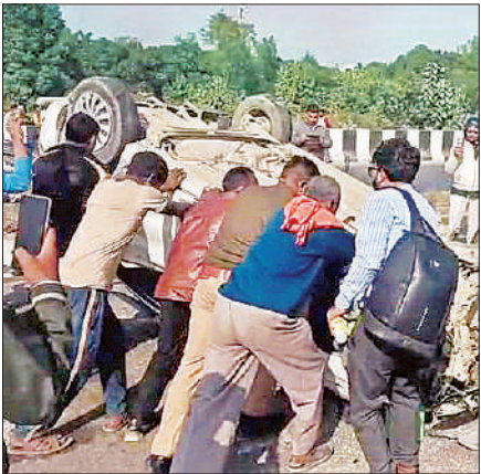
कार को सीधा करने का प्रयास करते लोग।