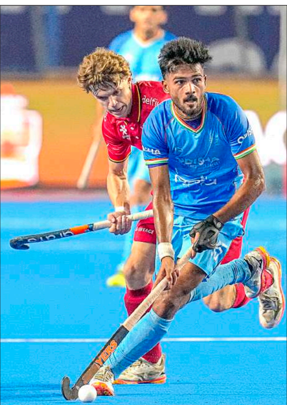
हॉकी पुरुष जूनियर विश्व कप 2025 के क्वार्टर फाइनल में भिड़ते भारत (नीली जर्सी) और बेल्जियम के खिलाड़ी।

दुबई :पाकिस्तान के बैटर फखर जमां पर मैच फीस का 10 परसेंट जुर्माना लगाया गया है। उन्हें 29 नवंबर को श्रीलंका के खिलाफ ट्राई-सीरीज फाइनल के दौरान आईसीसी कोड ऑफ कंडक्ट के लेवल 1 को तोड़ने का दोषी पाया गया। जमान को आईसीसी कोड ऑफ कंडक्ट के आर्टिकल 2.8 को तोड़ने का दोषी पाया गया, जो प्लेयर्स और प्लेयर सपोर्ट स्टाफ के लिए है, जो इंटरनेशनल मैच के दौरान अपायर के फैसले पर असहमति दिखाने से जुड़ा है।