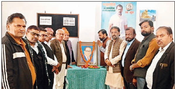
कार्यालय में बाबा साहेब के चित्र पर नमन करते कांग्रेसी।