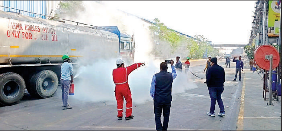
रनियां की वनस्पति फैक्ट्री में शनिवार को अग्निशमन टीम ने मॉकड्रिल कर आग से निपटने के तरीके समझाए। अमृत विचार

● उद्यमियों को फैक्ट्री के उपकरणों का परीक्षण करने के निर्देश