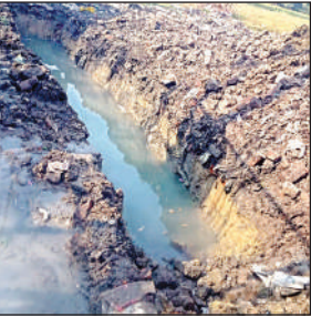
दो दिन से मरम्मत पूरी नहीं हो पा रही।

10 हजार की आबादी पानी समस्या से प्रभावित