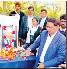
मात्न्यार्पण करते मुलायम सिंह यादव।

● संविधान रचयिता की पुण्यतिथि पर माती कचहरी में हुई गोष्ठी