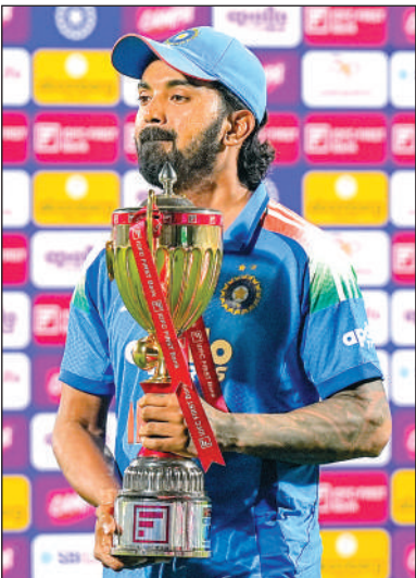
भारत के कप्तान कैपल राहुल ट्रॉफी के साथ।

गेंदबाजी : अर्शदीप 8-1-36-1, हर्षित 8-2-44-0, कृष्णा 9.5-0-66-4, जडेजा 9-0-50-1, कुलदीप 10-1-41-4, तिलक 3-0-29-0