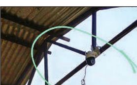
गौशाला में लगा कैमरा।