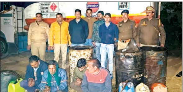
पुलिस की गिरफ्त में पकड़े गये आरोपी।

अमृत विचार। घाटमपुर में शनिवार को सम्पूर्ण समाधान तहसील दिवस का आयोजन किया गया। समाधान दिवस में उप जिलाधिकारी अविचल प्रताप सिंह मौजूद रहे और फरियादियों की समस्याओं को सुना। यहां पर कुल 177 शिकायत आई। इनमें से 19 शिकायतों का मौके पर निस्तारण किया गया। इनमें सबसे अधिक शिकायतें राजस्व विभाग की रहीं। एसडीएम ने कहा कि शिकायतों के निस्तारण में किसी भी प्रकार की