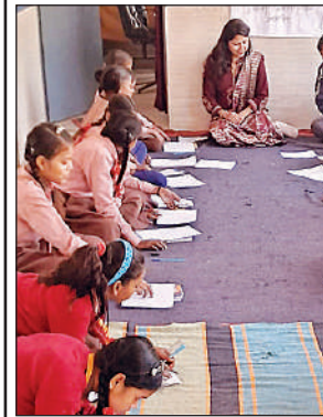
कविता लेखन करते छात्र-छात्राएं।