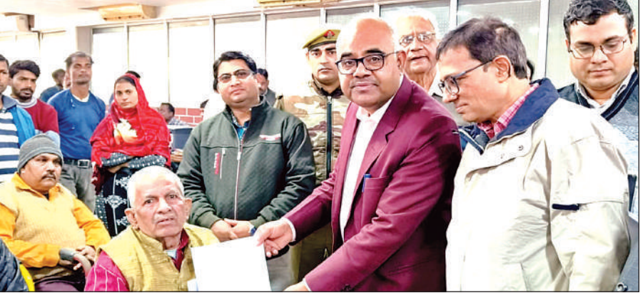
संपूर्ण समाधान दिवस में जिलाधिकारी ने लोगों की समस्याएं दूर कीं।