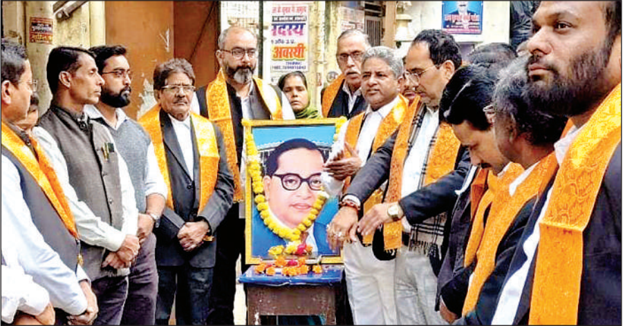
अधिवक्ताओं ने बाबा साहेब को नमन किया।