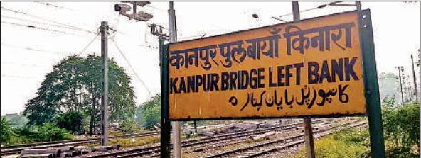
गंगाघाट रेलवे स्टेशन बोर्ड के पास लगाये गये हाईटेक कैमरे।