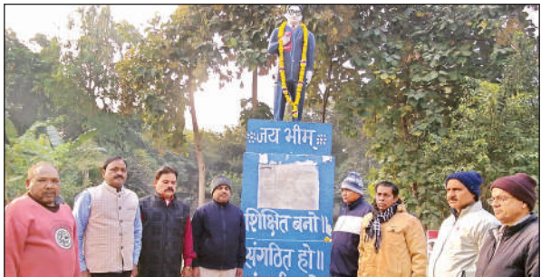
पंचशील बौद्ध विहार में बाबा साहेब को याद करते लोग।

शुक्लागंज उन्नाव, अमृत विचार। बाबा साहेब डॉ. भीमराव आंबेडकर के परिनिर्वाण दिवस पर शनिवार को पंचशील बुद्ध विहार संस्थान गंगाघाट के तत्वाधान