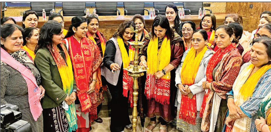
कार्यक्रम का शुभारंभ करतीं अतिथि।