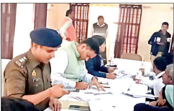
घाटमपुर में लोगों की शिकायतें सुनते अधिकारी।

अमृत विचार। बिल्हौर थाना क्षेत्र के लालपुर गांव में लंबे समय से टैकरो से डीजल-पेट्रोल चोरी कर ग्रामीण क्षेत्रों में बेचने वाले गैंग का शनिवार शाम को भंडाफोड़ हो गया। क्राइम ब्रांच और बिल्हौर पुलिस की संयुक्त टीम ने छापेमारी कर चार आरोपियों को गिरफ्तार किया और दो टैकरो समेत भारी मात्रा में ईंधन बरामद किया। सूत्रों के अनुसार लालपुर बाजार के एक हाते में रात के समय टैकरो से डीजल-पेट्रोल चोरी कर बड़े ड्रमों में भरकर रखा जाता