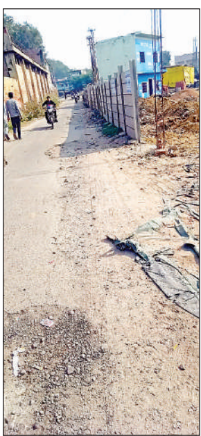
रोड किनारे खड़ी की गई दीवार।

इससे भविष्य में अज्ञात व्यक्तियों द्वारा पुनः अवैध कब्जा किए जाने की आशंका बनी हुई है।