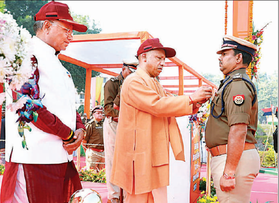
उत्तर प्रदेश होमगार्ड के 63वें स्थापना दिवस पर आयोजित कार्यक्रम के दौरान अधिकारियों को सम्मानित करते मुख्यमंत्री योगी।

उन्होंने जवानों की कर्तव्यनिष्ठा की सराहना करते हुए घोषणा की कि प्रदेश के सभी थानों में होमगार्ड जवानों के लिए एक आरक्षित कमरा उपलब्ध कराया जाएगा, जहां वे