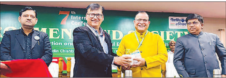
कॉफ्रेंस में पर्यावरणविद को सम्मानित करते कुलपति।