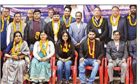
आयोजित चुनाव में निर्वाचित सदस्य।