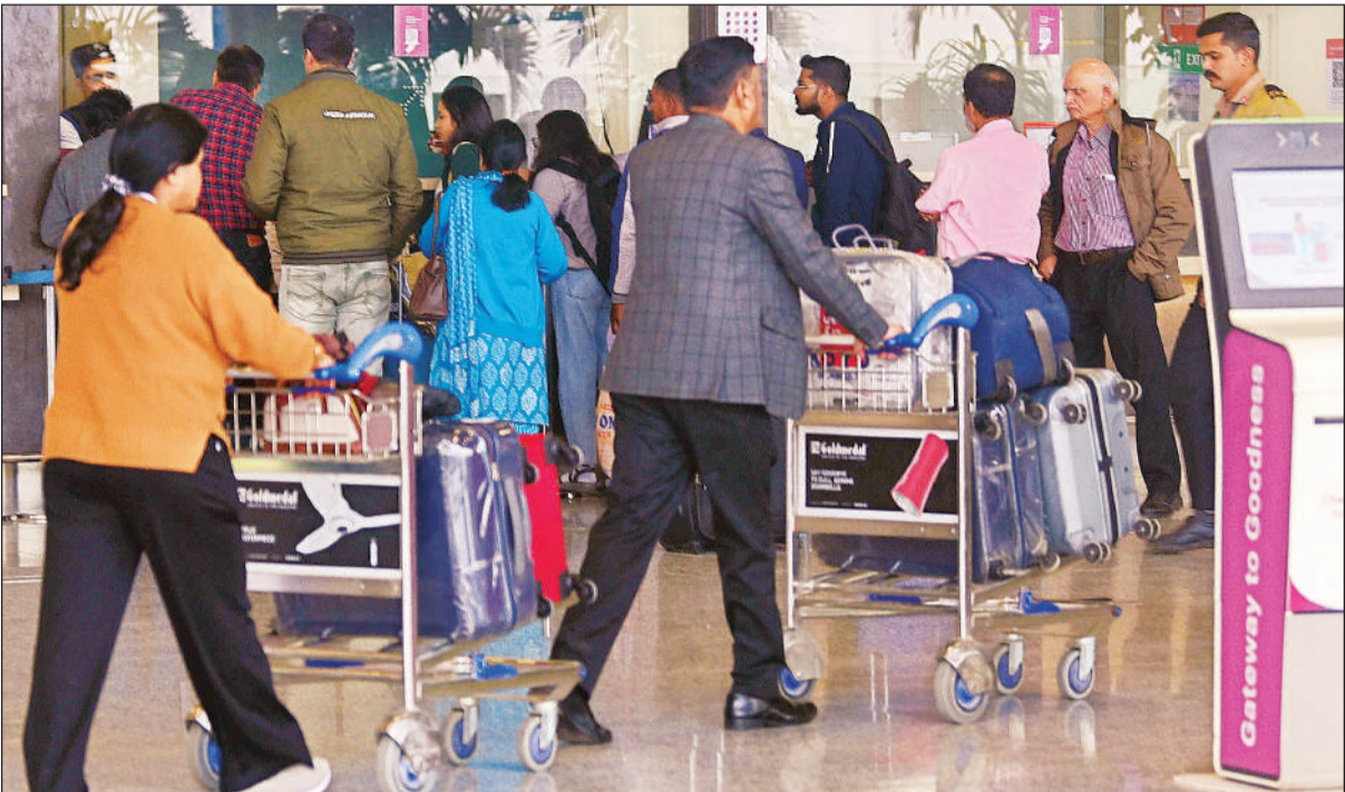
चौधरी चरण सिंह अंतरराष्ट्रीय एयरपोर्ट पर इंडिगो विमान रद्द होने के बाद सामान लेकर जाते निराश यात्री।

रविवार को लखनऊ से दिल्ली, मुंबई, चेन्नई, बंगलुरु, गुवाहाटी, चंडीगढ़ आदि मार्गों की उड़ानें रद्द रहीं। एयरपोर्ट प्रशासन ने कहा कि स्थिति पर निगरानी रखी जा रही है, जबकि यात्री उम्मीद में हैं कि जल्द व्यवस्थाएं पटरी पर लौटें।