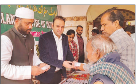
शिविर में मरीजों को दवा वितरित करते हुए डॉक्टर व संगठन के पदाधिकारी।