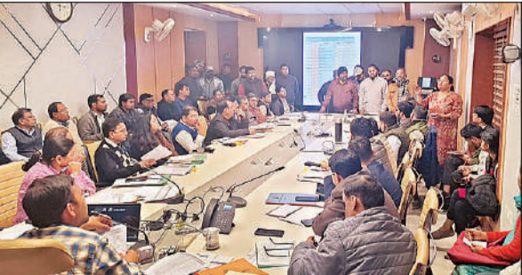
स्वच्छता को लेकर नगर निगम अधिकारियों के साथ बैठक करते नगर आयुक्त

■ अमृत विचार, लखनऊ :नगर आयुक्त गौरव कुमार ने रविवार को अधिकारियों के साथ स्वच्छता को लेकर उच्चस्तरीय समीक्षा बैठक की। जिसमें स्वच्छता सुधार के लिए 24 बिंदुओं पर त्वरित कार्रवाई के निर्देश दिए। सार्वजनिक शौचालयों की समीक्षा में उन्होंने कहा कि 25 दिसंबर तक शहर के सभी सार्वजनिक शौचालयों को पूरी तरह दुरुस्त किया जाए। इसके बाद वह स्वयं इन शौचालयों का औपेक्ष निरीक्षण करेंगे। नगर आयुक्त ने कहा कि जो शौचालय जर्जर हो गए हैं उनका ध्वस्तीकरण संयुक्त निरीक्षण एवं घोषणा के बाद ही किया जाएगा। नगर आयुक्त ने कूड़ा उठान व्यवस्था की समीक्षा में कहा कि किसी भी वार्ड का करार दूसरे वार्ड में डंप नहीं किया जाएगा। शहर के सभी अवैध डंपिंग प्वाइंट समाप्त किए जाएं नगर आयुक्त ने जोनल अधिकारियों और जेडएसओ से कहा कि हाउसहोल्ड कवरेज, नए हाउस होल्ड जौड़ने का डेटा सीमावर तक साझा किया जाए। घरों से कूड़ा उठाने की कितनी गाड़ियां बढ़ाई गई हैं और यूजर चार्ज कलेक्शन कितने बढ़े हैं, इसकी विस्तृत रिपोर्ट प्रस्तुत की जाए। बैठक में समस्त अपर नगर आयुक्त, उप नगर आयुक्त, चीफ इंजीनियर, जोनल अधिकारी, जोनल सेनेटरी अधिकारी, अधिशासी अभियंता, एलएसए एवं एलएसजी प्रतिनिधि तथा स्वच्छ भारत मिशन टीम शामिल रही।