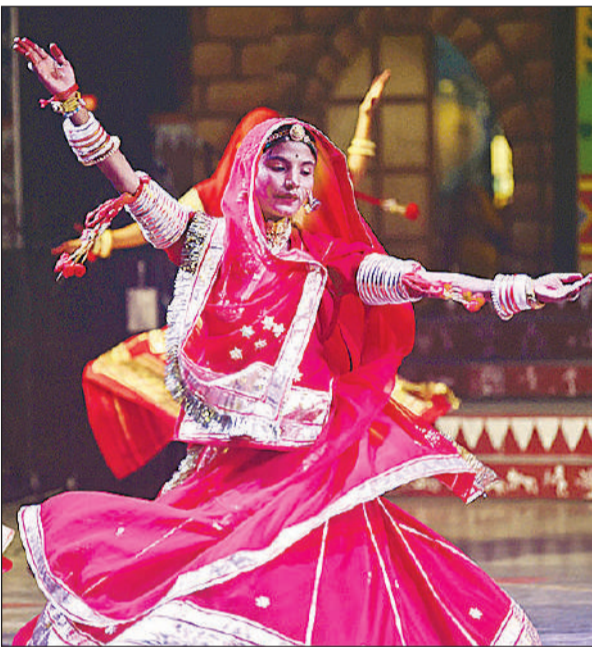
देशज में राजस्थानी लोकनृत्य प्रस्तुत करती महिला।