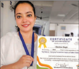
सम्मानित की गई शिक्षिका।