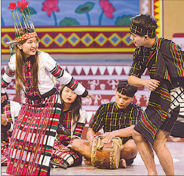
ऑ. राममनोहर लोहिया पार्क में आयोजित सोनचिरैया के पांचवें संस्करण देशज के अंतिम दिन लोकनृत्य प्रस्तुत करते छत्तीसगढ़ और मणिपुर के कलाकार।