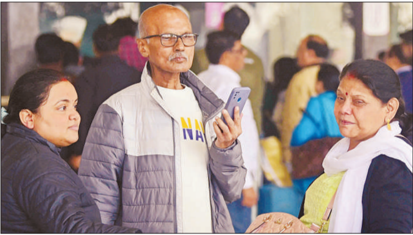
फोन करके घर पर विमान रद्द होने की सूचना देता यात्री, यात्रियों के उदास चेहरे उनकी परेशानी बयां कर रहे थे।