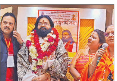
कार्यक्रम में मौजूद लोग।