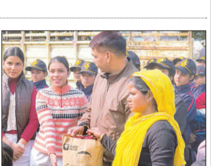
गर्म कपड़ों का वितरण करती एनसीसी कैडेट्स।