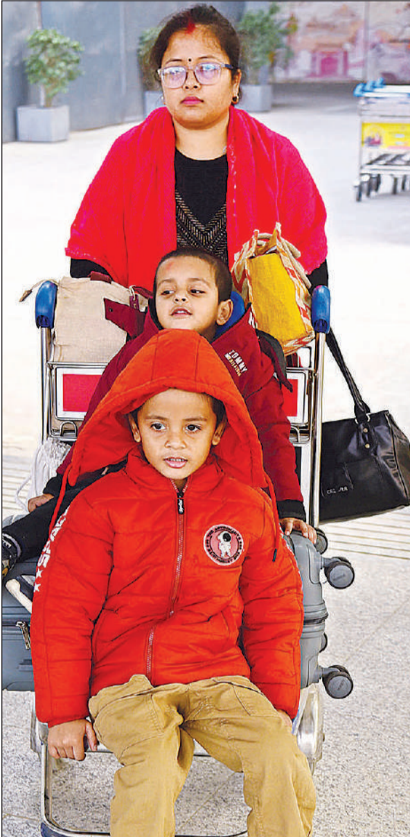
दिल्ली से इंडिगो विमान से लखनऊ पहुंची महिला यात्री सामान और बच्चे लेकर एयरपोर्ट से बाहर निकलती हुई।

■ लखनऊ से अन्य शहरों को जाने वाली कई उड़ानें भी रद्द की गईं। दोपहर 2 :35 बजे दिल्ली जाने वाला 6 ई 758, शाम 4 :20 बजे दिल्ली जाने वाला 6ई 2292, शाम 4 :50 बजे बंगलुरु जाने वाला 6ई 435, शाम 6 :05 बजे कोच्चि जाने वाला 6 ई 6255, शाम 7 :25 बजे हैदराबाद जाने वाला 6ई 515, रात 7 :25 बजे चेन्नई जाने वाला 6 ई 518, रात 8 :30 बजे चंडीगढ़ जाने वाला 6 ई 6552 और रात 9 :20 बजे पुणे जाने वाला 6 ई 118 विमान रद्द कर दिया गया।