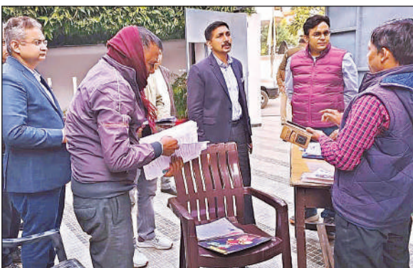
बूथ पर बीएलओ और सुपरवाइजर से गणना प्रपत्रों की जानकारी लेते जिलाधिकारी।