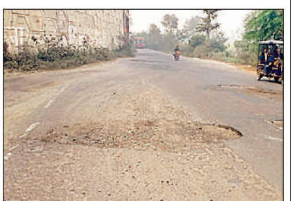
जरवलरोड-बहराइच मार्ग पर बना गड्ढा।