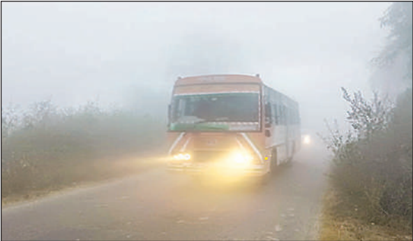
कोहरे के बीच हेड लाइट जलाकर चलते वाहन।

दिसंबर के दूसरे सप्ताह की शुरुआत होते ही सर्दी ने अपने तेवर दिखाने शुरू कर दिए हैं। सोमवार की सुबह जैसे ही शहर नींद से जागा, पूरा इलाका घने कोहरे की मोटी चादर में लिपटा हुआ नजर आया। दृश्यता इतनी कम रही कि वाहन चालकों को सुबह से ही हेडलाइट जलाकर सड़क पर रेंगना पड़ा। पिछले दो दिनों से चल रही