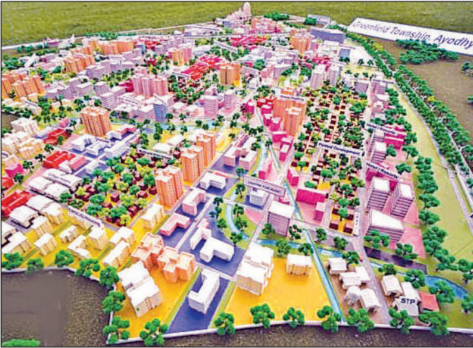
ग्रीन फील्ड टाउनशिप की प्रस्तावित योजना का मानचित्र।

अब दूसरे चरण में ली जाने वाली लगभग 762 एकड़ जमीन को लेकर कार्रवाई तेज कर दी गई है। परिषद ने इसके लिए भूमि विकास, गृहस्थान एवं बाजार योजना के