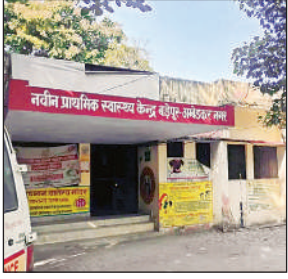
नवीन प्राथमिक स्वास्थ्य केंद्र बड़ेपुर ।

चारदीवारी न होने के कारण अस्पताल परिसर में आवासीय स्टाफ को आप दिन जंगली जानवरों के आतंक का सामना करना पड़ता है। स्थिति यह है कि कर्मचारी असुरक्षा के बीच कार्य करने को