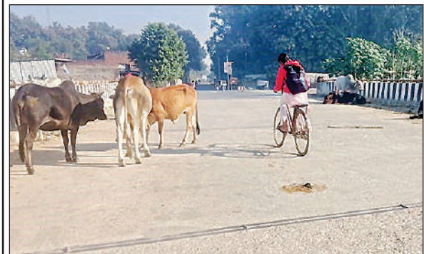
गिलौला-खुटेहना मार्ग पर गिलौला थाने के निकट नहर पुल पर मौजूद छुट्टा मवेशी।