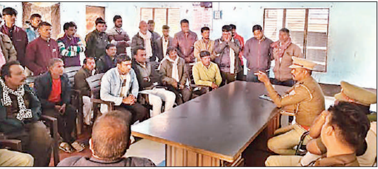
● ग्राम सचिवालय दुल्लापुर में ऑटो रिक्शा चालकों के साथ पुलिस अधिकारियों ने की बैठक

इसके बाद ऑटो-ई-रिक्शा चालकों के साथ बैठक कर उन्हें कड़े निर्देश दिए। स्पष्ट कहा कि हाईवे पर ई-रिक्शा, ऑटो या किसी भी वाहन को खड़ा करना पूरी तरह प्रतिबंधित रहेगा।