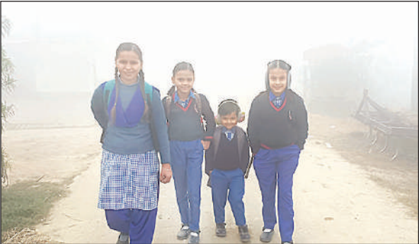
कोहरे और ठंड के बीच स्कूल जाते बच्चे।