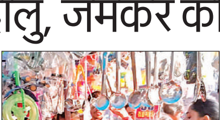
मेले में खरीदारी करते श्रद्धालु ।

का उल्लेख पुराणों में भी मिलता है। हिंदू समाज के लोगों में इस स्थान को लेकर गहरी आस्था है। वर्ष भर में ऐसे कई मौके होते हैं। जब श्रवण धाम मेले में जनपदवासियों के अलावा पड़ोसी जनपद अयोध्या, सुल्तानपुर और आजमगढ़ के भी श्रद्धालुओं