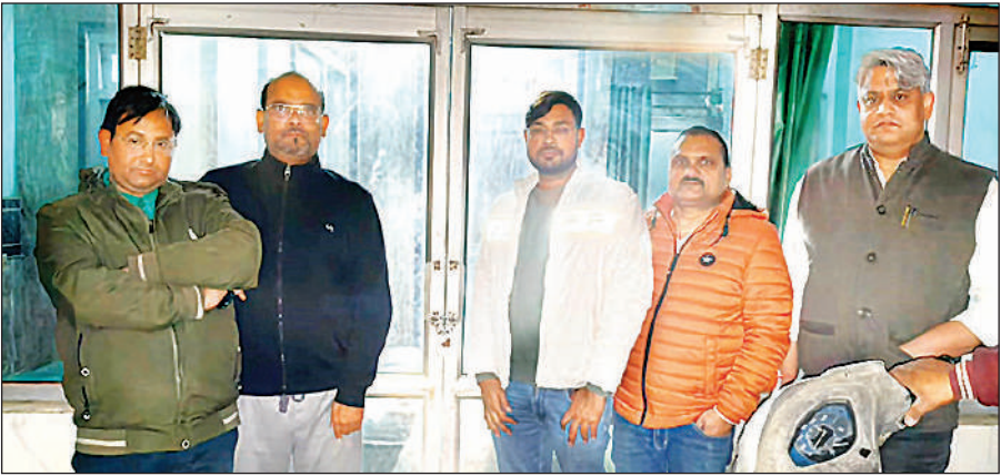
ओम हॉस्पिटल को सील करने के बाद स्वास्थ्य विभाग के अधिकारी व कर्मचारी।