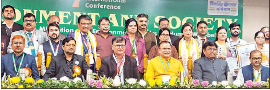
इंटरनेशनल कॉन्फ्रेंस ऑन एनवायर्नमेंट एंड सोसायटी के कार्यक्रम में सम्मानित शिक्षकगण ।