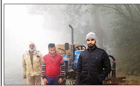
अवैध खनन में पकड़ी गई ट्रैक्टर-ट्राली।