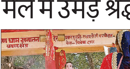
श्रवण धाम में पूजन करते श्रद्धालु ।

श्रवण धाम मेला आस्था का केंद्र और स्थानीय व बाहरी व्यापारियों के लिए कमाई का अवसर भी साबित हो रहा है। मेले के पांचवे दिन सोमवार को उमड़ी भारी भीड़ देख दुकानदारों के चेहरे खिल गए। बता दें कि माता-पिता की भक्ति के प्रतीक श्रवण कुमार की तोपस्थली श्रवण क्षेत्र के नाम से प्रसिद्ध है। श्रवण क्षेत्र धाम