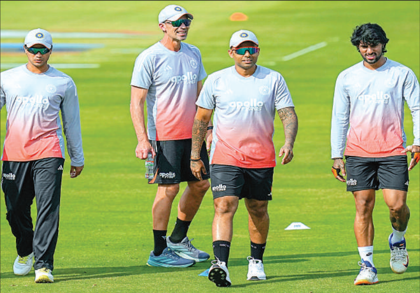
अभ्यास सत्र के दौरान टीम के साथ कप्तान सूर्यकुमार यादव (दाएं से दूसरे)।