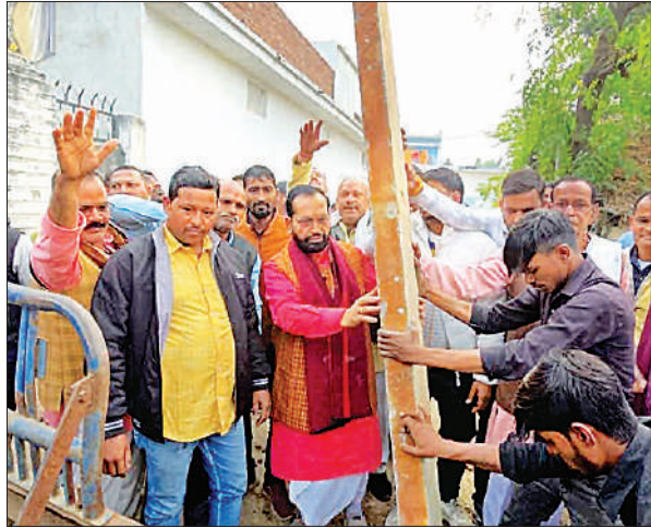
भूमि पूजन के बाद खंभा लगाते विधायक।