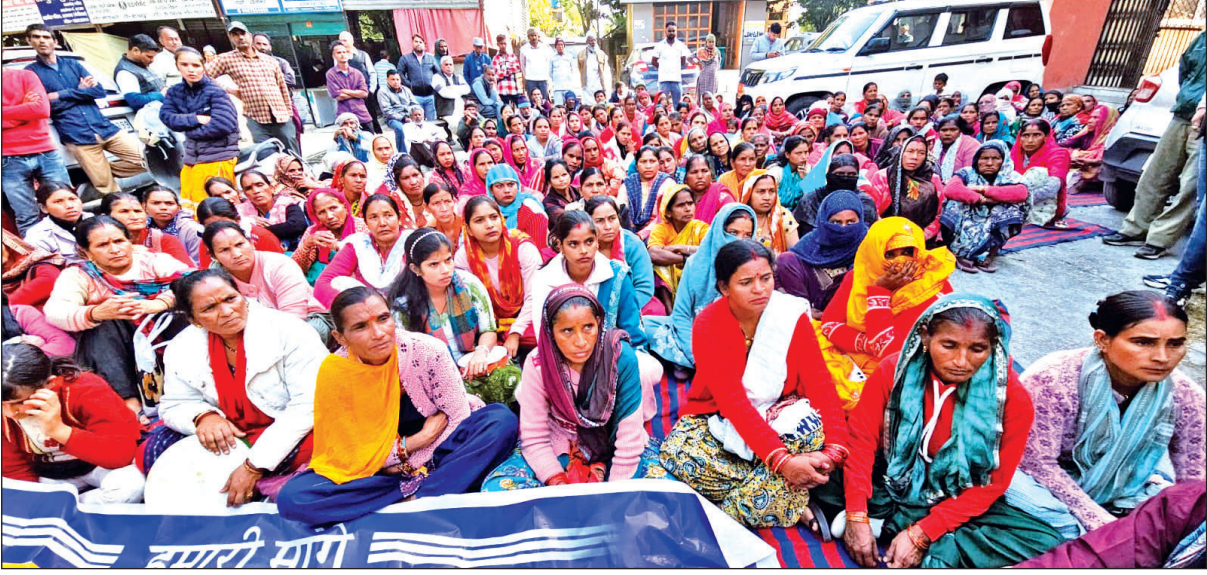
रामनगर के पूछड़ी में की गई अतिक्रमण हटाने की कार्रवाई के विरोध में धरने पर बैठी महिलाएं। ● अमृत विचार

तहसील परिसर में वक्ताओं ने कहा कि ग्राम पूछड़ी में विगत वर्ष ग्राम स्तरीय वन अधिकार