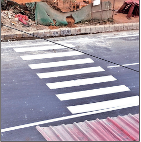
बाईपास मार्ग में बनाई गई जेब्रा क्रॉसिंग