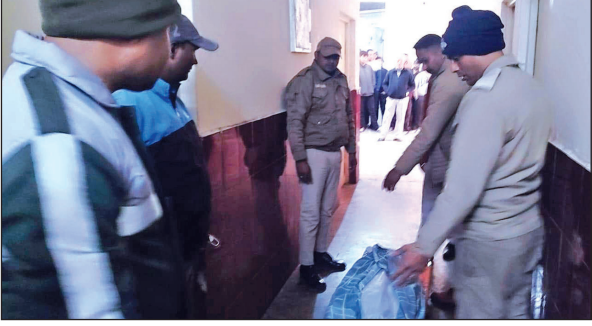
छात्रावास में जांच करती पुलिस । ● अमृत विचार

के नोटिस के उपरांत अतिक्रमण हटाने की कार्रवाई की जाएगी । उन्होंने बताया कि सिंचाई विभाग के हरिपुरा जलाशय की भूमि से पूर्व में प्रथम चरण में 1.13 हेक्टेयर भूमि से अतिक्रमण हटाया जा चुका है । द्वितीय चरण में 2.45 हेक्टेयर भूमि से अतिक्रमण हटाया