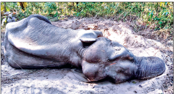
बरहैनी रेंज के जंगल में मिला नर हाथी का शव।