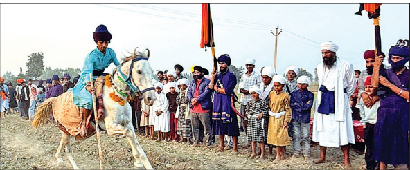
गुरुद्वारा साहिब नानकसर टाट गजरीला में हैरतअंगेज करतब दिखाते निहंग।