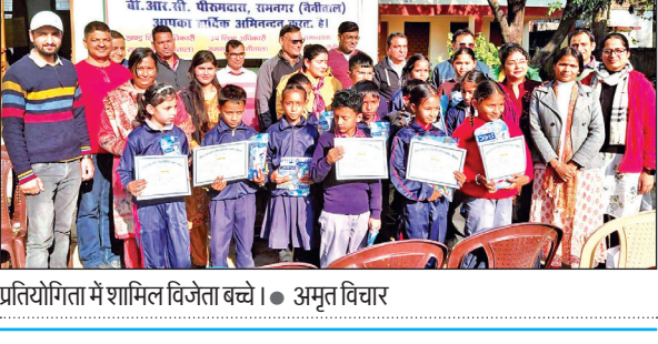
प्रतियोगिता में शामिल विजेता बच्चे।