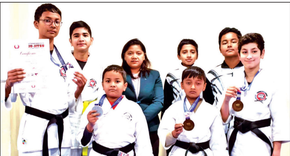
राज्य स्तरीय जू-जित्सु प्रतियोगिता में भीमताल के विजेता प्रतिभागी।

का पुल निर्माण जल्द पूरा करने के निर्देश दिए। पुल निर्माण से सिर्फ साचा, लमगड़ा, बेड़खेत, हैड़ाखान, पस्या, महाराखेत, कौडार, देवली, छीड़ा समेत एक दर्जन से अधिक गांवों को इसका फायदा होगा। कहा कि मुख्यमंत्री धामी की सरकार लगातार क्षेत्रीय समस्याओं के समाधान की दिशा में काम कर रही है।