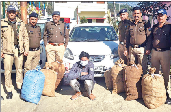
देघाट पुलिस की गिरफ्त में गांजा तस्करी का आरोपी।