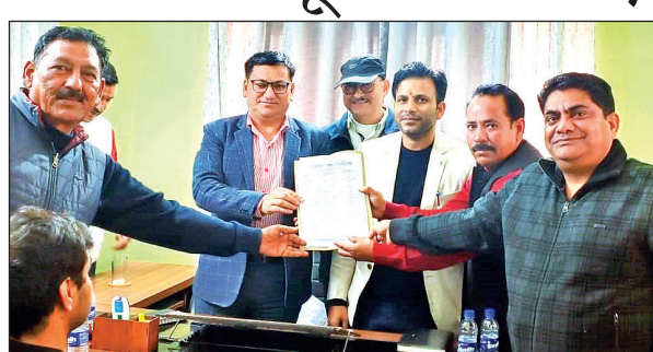
अधिकारियों को ज्ञापन सौंपते डंपर एसोसिएशन व गौला संघर्ष समिति के सदस्य।