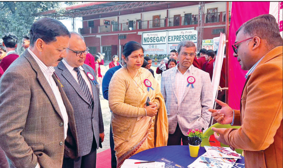
नोजगे पब्लिक स्कूल में आयोजित मेगा फेयर में निरीक्षण करते अतिथि।