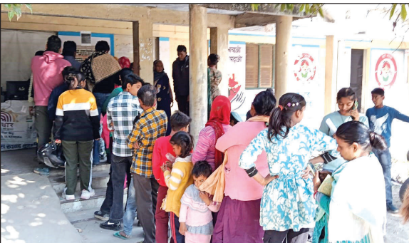
काशीपुर के ब्लॉक में आधार कार्ड बनाने के लिए लगी लाइन।