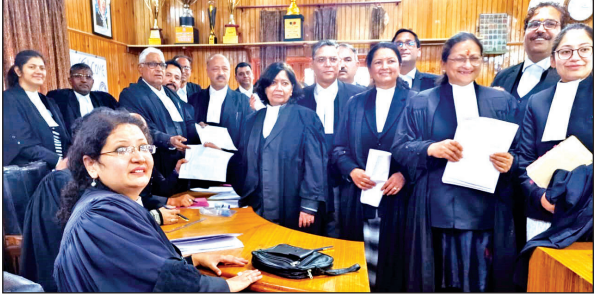
हाईकोर्ट बार एसोसिएशन के चुनाव के लिए नामांकन पत्र खरीदते अधिवक्ता।

अमृत विचार: उत्तराखंड हाईकोर्ट बार एसोसिएशन के चुनाव के लिए सोमवार को नामांकन पत्रों की बिक्री हुई। मुख्य निर्वाचन अधिकारी कुर्बान अली एवं मुख्य सलाहकार चुनाव समिति रविन्द्र बिष्ट की उपस्थिति में बार एसोसिएशन चुनाव कार्यालय द्वारा नामांकन पत्रों के विक्रय का कार्य प्रातः 10:30 बजे से दोपहर 3 बजे तक किया गया। इस दौरान अध्यक्ष पद के लिए 4, वरिष्ठ उपाध्यक्ष पद के लिए 2, उपाध्यक्ष पद के लिए एक, महिला उपाध्यक्ष पद के लिए 2, महासचिव पद के लिए 3, संयुक्त सचिव प्रशासन के लिए 2, संयुक्त सचिव प्रेस के लिए 2, कोषाध्यक्ष पद के लिए 2, पुस्तकालय अध्यक्ष के लिए 1, वरिष्ठ कार्यकारिणी सदस्य के 5