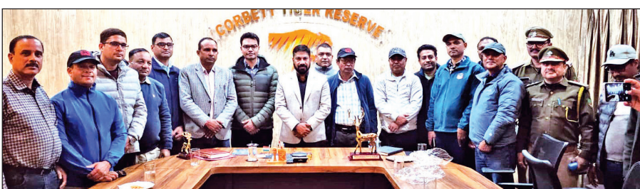
नेपाल और काबेट टाइगर रिजर्व के अधिकारियों एवं कर्मचारियों। ● अमृत विचार

द्वारे का उद्देश्य भारत के कॉर्बेट टाइगर रिजर्व और नेपाल के शुक्लाफांटा राष्ट्रीय उद्यान के बीच इको-टूरिज्म को जोड़ना और दोनों पार्कों के पर्यटन मॉडल को साझा