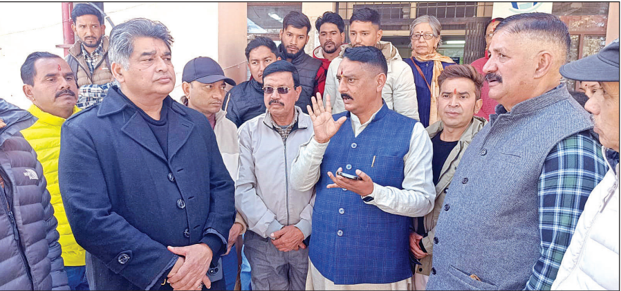
अल्मोड़ा मेडिकल कॉलेज में सोमवार को प्राचार्य से वार्ता करते जनप्रतिनिधि। ● अमृत विचार

इस मौके पर लोगों ने कहा कि लंबे समय से मेडिकल कॉलेज अल्मोड़ा में स्वास्थ्य सेवाएं बर्हाल बनी हुई हैं। कॉलेज में करोड़ों रुपये के संसाधनों के बाद भी मरीजों का