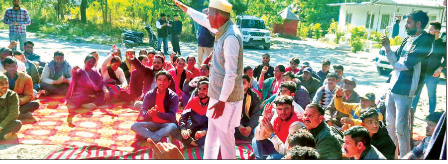
रोजगार की मांग को लेकर जमरानी में विरोध-प्रदर्शन करते लोग।