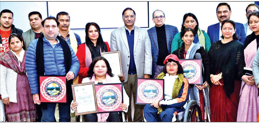
यूओयू में हौसलों की उड़ान विषय पर आयोजित कार्यक्रम में मौजूद कुलपति व अन्य।