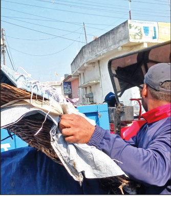
सामान जब्त करते कर्मचारी । ● अमृत विचार

टीम ने सबसे पहले बेरिया रोड पर सड़क किनारे खड़े फल व सब्जी के ठेलों को हटवाया । अधिकारियों ने संचालकों को स्पष्ट निर्देश दिए कि उन्हें सब्जी बाजार में चयनित स्थानों पर ही दुकानें लगाने की अनुमति है । टीम बाजार क्षेत्र में आगे बढ़ी तो सरकारी नाले पर किए गए पक्के और कच्चे अतिक्रमण भी पाए गए । कई लोग नाले पर तख्त लगाकर वर्षों से फड़-ठेले संचालित कर रहे थे । अधिकारियों ने मौके पर ही अतिक्रमण हटवाते हुए चेतावनी दी कि भविष्य में दोबारा कब्जा करने पर सख्त कार्रवाई की जाएगी । अभियान के दौरान दोपहर तक अधिकांश ठेला संचालक स्वयं ही अपना सामान समेटकर हट गए, लेकिन कुछ लोगों द्वारा