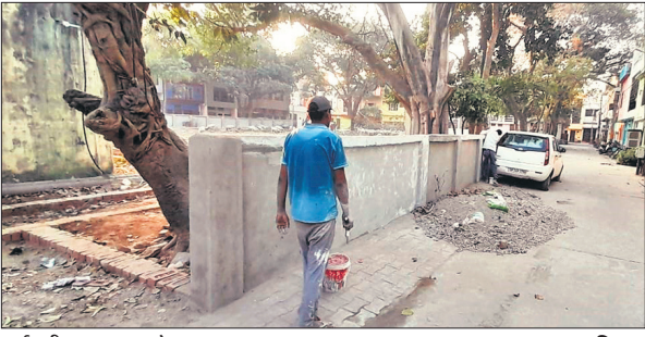
पार्क की मरम्मत करते मजदूर।

अमृत विचार: लंबे अंतराल से बदहाल पड़े पार्कों की सूरत बदलने लगी है। करीब 1.43 करोड़ की लागत से पार्कों की मरम्मत का कार्य कराया जा रहा है। इनकी मरम्मत होने के बाद पार्कों की कायाकल्प हो जाएगी। आवास विकास कॉलोनी को 1984 में विकसित किया गया था। उस दौरान कॉलोनी में बच्चों को खेलने कूदने के लिए छह पार्कों का निर्माण कराया गया था। कॉलोनी के विकसित होने के बाद इनकी दशा खराब होने लगी। लोगों ने पार्कों को पार्किंग स्थल में तब्दील कर दिया। उनकी दीवारें तक गिर चुकी थीं। साथ ही रात के समय अराजक तत्व आने लगे थे। पार्कों की दशा सुधारने के लिए कॉलोनी के लोग आवास विकास परिषद के अधिकारियों ने मांग कर रहे थे। तीन दशक के बाद पार्कों की कायाकल्प करने