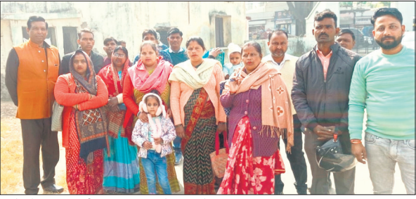
कलेक्ट्रेट पर अपनी फरियाद सुनाते निकाले गए युवक।

● कोर्ट ने दिए थे संविदा कर्मियों को ज्वाइन कराने के निर्देश