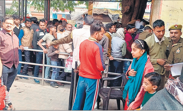
अस्पताल में पर्वी बनवाने को लाइन में लगे मरीज व तीमारदार।