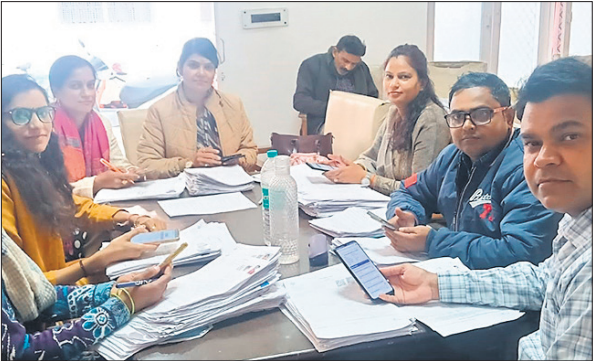
गणना प्रपत्र को डिजिटल करते बीएलओ।

जिले में चार नवंबर से मतदाता सूची के विशेष गहन पुनरीक्षण का कार्य चल रहा है। यह कार्य 4 दिसंबर तक पूर्ण होना था। कार्य चुनौती पूर्ण होने की वजह से निर्वाचन आयोग की ओर से 11 दिसंबर तक समय सीमा बढ़ा दी। अंतिम तिथि नजदीक है। मात्र तीन दिन का ही समय शेष बचा है। इस कार्य में लगे 2579 बीएलओ द्वारा गणना