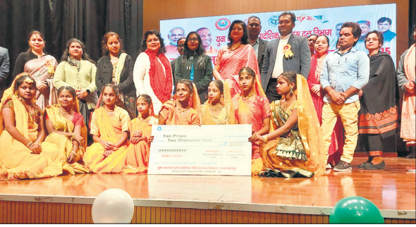
युवा उत्सव में मौजूद प्रतिभागी व आयोजक।

लाइन को हटाने का काम चल रहा है। अभी तक 34 स्कूल भवनों क ऊपर से गुजर रही हाईटेंशन लाइन को हटाया जा चुका है। शेष 113 स्कूलों के ऊपर से गुजर रही हाईटेंशन लाइन को हटाने का तेजी से चल रहा है। जो अगले तीन माह में पूरा कर लिया जाएगा।