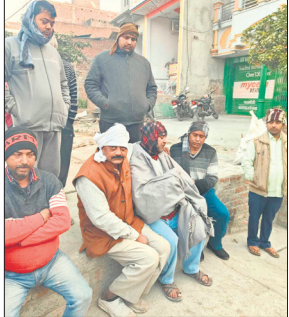
मृतक के घर के बाहर बैठे परिजन।

टीम का कहना है कि हाथियों का झुंड जंगल में लौट गया है। फिर भी निगरानी की जा रही है। हालांकि, अभी तक हाथियों की कोई लोकेशन नहीं मिली है। लगता है जंगल में हाथियों ने डेरा डाल रखा है। बता दे 6 दिसंबर को नेपाली हाथियों ने खुटार के गांव रायपुर पटियात, राठ, बरबटपुर, गेंहुआ, अठकोना, महेशापुर गांव में दस्तक दी थी। हाथियों ने कई बीघा फसलों को अपने पैरों तले रौंद दिया