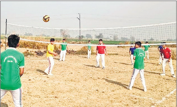
बालीवॉल खेलते बच्चे।