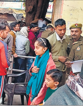
● अमृत विचार

मरीजों ने खांसी की दवा ली। जबकि ढाई सौ मरीजों का ब्लड टेस्ट कराने को लिखा गया। डॉक्टरों ने बताया कि इस समय सर्दी खांसी अधिक लोगों को हो रही है। अधिक समय तक सर्दी