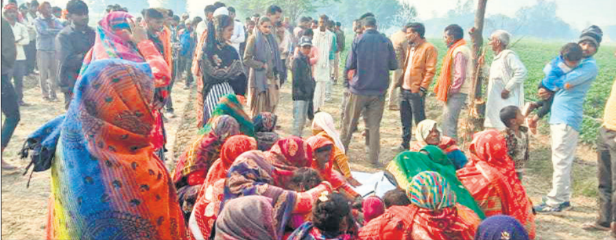
युवक की मौत के बाद रोते-बिलखते परिजन।