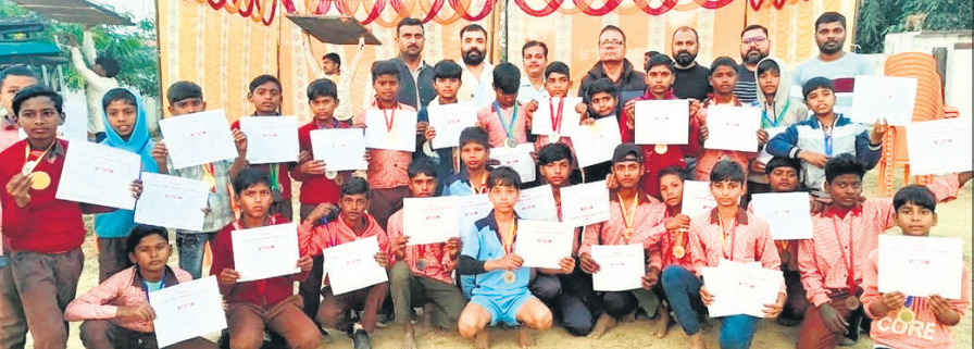
प्रमाण पत्रों के साथ प्रतियोगिता में भाग लेने वाले बच्चे।