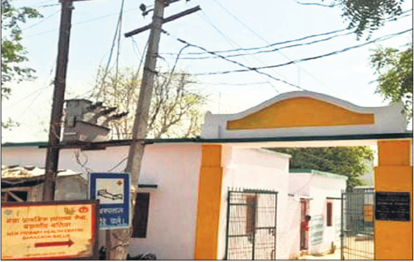
परिषदीय स्कूल के ऊपर से गुजरती हाईटेंशन लाइन।