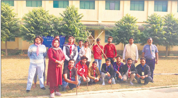
रोवर्स-रेंजर्स शिविर के चौथे दिन अभ्यास कराते ट्रेनर।