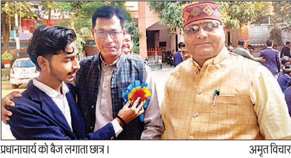
प्रधानाचार्य को बैज लगाता छत्र।