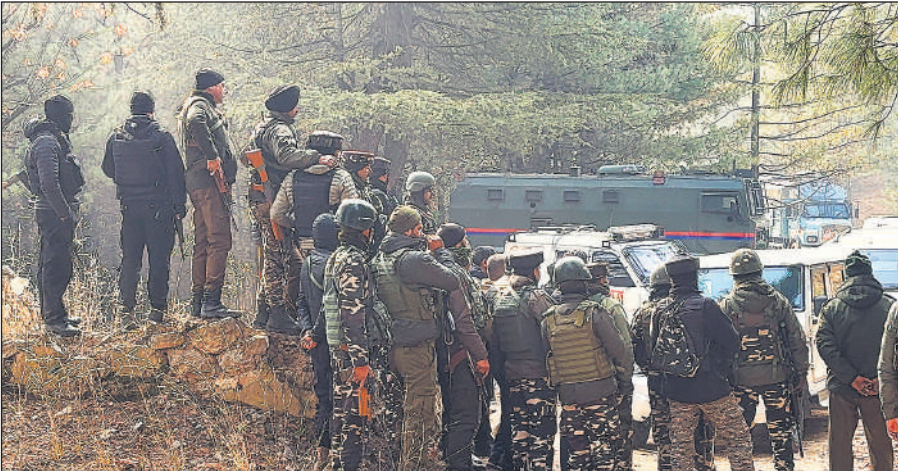
जम्मू-कश्मीर के अनंतनाग जिले के हुतमुराह वन क्षेत्र में सुरक्षाकर्मियों के साथ छानबीन करती एनआईए की टीम।

उठ जाता है और उसी उथल-पुथल से सुनामी की शुरुआत होती है। इसके अलावा समुद्र के भीतर होने वाले ज्वालामुखी विस्फोट, समुद्र में भूस्खलन और बहुत कम मामलों में उल्कापिंड का समुद्र में गिरना भी सुनामी का कारण बन सकता है। इस प्रकार, सुनामी एक प्राकृतिक आपदा है जो समुद्र में अचानक होने वाले बड़े परिवर्तनों के कारण उत्पन्न होती है और मनुष्य तथा प्रकृति दोनों पर गहरा प्रभाव डालती है।