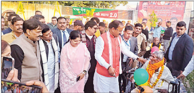
दिव्यांग को ट्राई-साइकिल देते डिटी सीएम केशव प्रसाद मौर्य।

हो गया है फिर भी मतदाता सूची में बना नहीं रह पाएगा। कोई घुसपैठिया अगर मतदाता सूची के अंदर घुस आया तो उसकी छानबीन कर उसे सूची से बाहर करने के लिए भाजपा चुनाव आयोग के माध्यम से जो कार्रवाई है वह करने के लिए दबाव बनाएगी। कहा कि कांग्रेस, समाजवादी पार्टी व डीएमके सहित जो भी भाजपा विरोधी राजनीतिक दल हैं इसका विरोध कर रहे हैं। लेकिन मुझे पता चला है कि अंदर से एसआईआर की प्रक्रिया में वो सभी भाग भी ले रहे हैं। कहा कि रोहिंग्या व घुसपैठियों को भी जांचा जा