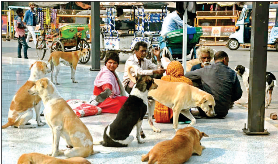
शहर के एक चौराहे पर कुत्तों का झुंड।

सुप्रीम कोर्ट ने आवारा कुत्तों के काटने की बढ़ती घटनाओं को देखते हुए शैक्षणिक संस्थानों, अस्पतालों, बस स्टैंड, खेल परिसरों और रेलवे स्टेशनों से आवारा कुत्तों को हटाने के आदेश दिये हैं। इन संस्थानों में सुरक्षा सुनिश्चित करने के लिए, परिसर में चाहरदीवारी या बाड़ आदि और