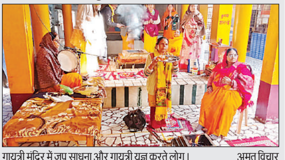
गायत्री मंदिर में जप साधना और गायत्री यज्ञ करते लोग।