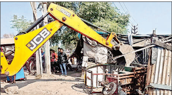
मरहला चौराहे पर अतिक्रमण हटाता बुलडोजर।