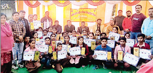
प्रमाण-पत्र व मोमेंटो के साथ प्रतिभागी छत्र-छात्राएं।