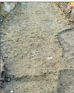
सूखा पड़ा मंगलपुर रजबहा।

दिया है लेकिन अभी भी रजबहों में पानी नहीं छोड़ा जा रहा है। फसलों को सिंचाई की आवश्यकता है। जरूरत के समय में उन्हें पानी नहीं मिल पा रहा है।