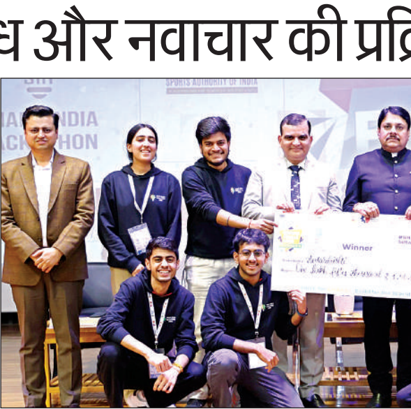
विजेता टीम को पुरस्कार दिया गया।

रचनात्मकता, तकनीकी क्षमता और टीमवर्क को सभी ने सराहा।