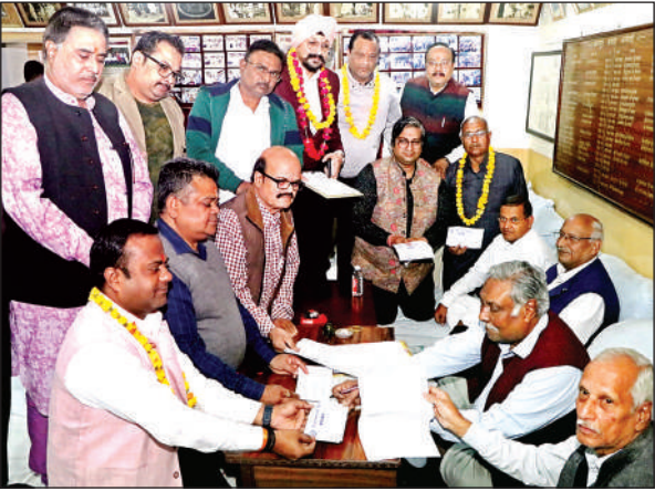
नामांकन करते व्यापारी।

सोमवार तक जिले की 10 विधानसभा सीटों पर कुल 35,38,261 मतदाताओं में 35,38,105 लोगों तक गणना प्रपत्र पहुंच चुके लेकिन सुधार के लिए जिन बिंदुओं का बारीकी से जांच होना है, वह अभी बाकी है। पुनरीक्षण के दौरान कुल 8,99,662 मतदाताओं के नाम सूची से हटाने के लिए चिह्नित किये गये हैं इसमें कई लोग मर चुके हैं, कुछ लोग पलायन कर चुके हैं पूरी जांच के बाद 15 से 20 प्रतिशत मतदाताओं के नाम सूची से बाहर कर दिये जाएंगे। आंकड़े बताते हैं कि 11,41,320 मतदाताओं की मैपिंग पूरी नहीं हो सकी है।