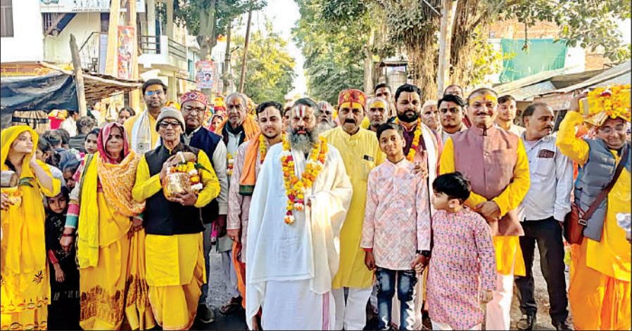
जवाहर नगर के महाकालेश्वर मंदिर से निकली पोथी एवं कलश यात्रा में साधु-संतों के साथ श्रद्धालु शामिल हुए।

अमृत विचार: सिकंदरा कस्बे के जवाहर नगर स्थित महाकालेश्वर मंदिर परिसर में मंगलवार को पांचवें विष्णु महायज्ञ के साथ ही श्रीमद्भागवत कथा प्रारंभ हुई। 108 कलश के साथ बैडबाजों और भक्ति गीतों की गूंज के बीच कस्बे के प्रमुख मार्गों पर यात्रा निकाली गई। कलश एवं पोथी यात्रा के दौरान सिकंदरा कस्बा के मोहल्ला राजेन्द्र नगर के काली माता मंदिर में पूजा अर्चना की गई। यात्रा पथरिया देवी मंदिर पहुंची। यहां पूजा अर्चना की गई। इसके उपरांत महाकालेश्वर मंदिर परिसर में यात्रा पहुंची जहां मंदिर में पूजा अर्चना के उपरांत श्रीमद्भागवत पंडाल में यात्रा को विश्राम करने के उपरांत सम्मिलित लोगों को प्रसाद वितरण