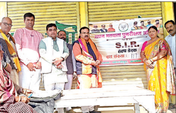
भोगनीपुर क्षेत्र के बूथ पर एसआईआर का जायजा लेते क्षेत्रीय अध्यक्ष।