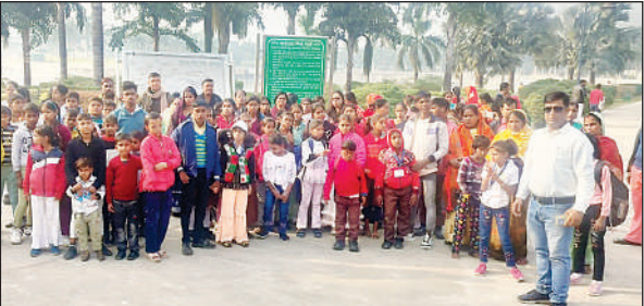
जनेश्वर पार्क लखनऊ में भ्रमण करते दिव्यांग बच्चे व स्पेशल एजुकटेर।