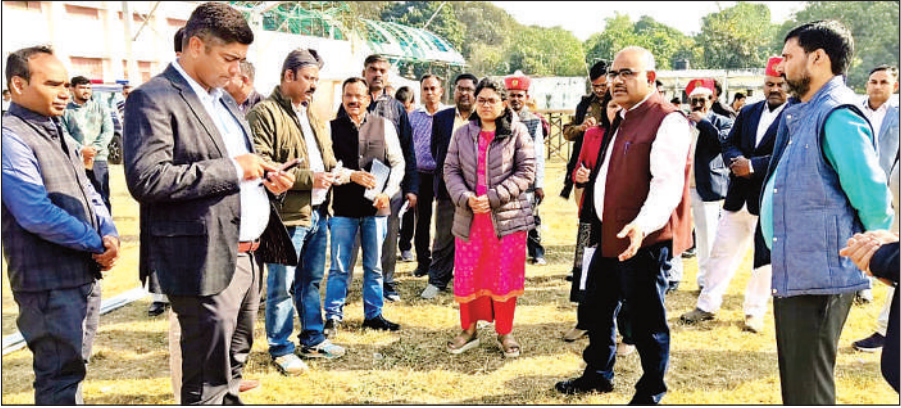
सामूहिक विवाह स्थल का निरीक्षण करते डीएम।