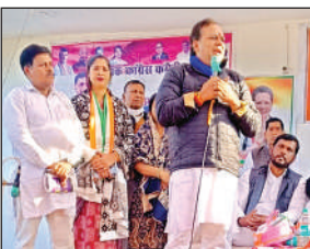
बैठक को संबोधित करते राष्ट्रीय सचिव