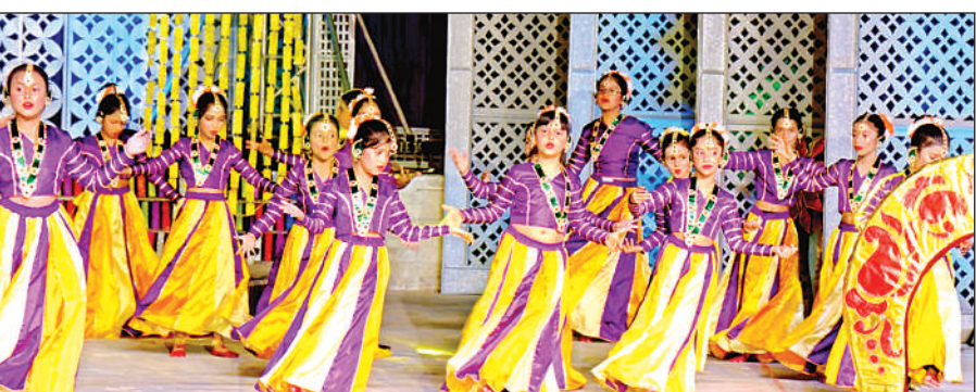
बच्चों ने नृत्य पेश किया।