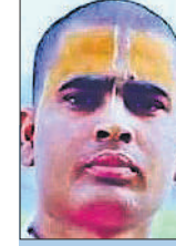
सरल जी ब्लॉगर

1956 में अमेरिका में एक जहाज तेल ले जा रहा था। जहाज अचानक मार्ग से भटक गया। वह समुद्र में एक चट्टान से टकराया और टूट गया। दुर्घटना के बाद जहाज के कप्तान को गिरफ्तार