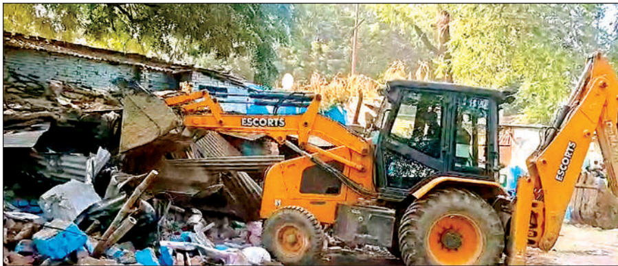
बीएस पार्क में कब्जों को गिराता बुलडोजर।

बी.एस पार्क में जलकल विभाग के सेवानिवृत्त कर्मचारी, नगर निगम के आउटसोर्स कर्मचारी तथा