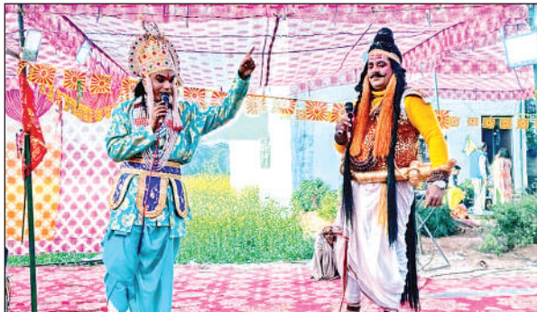
बारापुर की रामलीला में लक्ष्मण-परशुराम संवाद की एक झलक।

धनुष टूटने की घनघोर गर्जना सुन महेंद्रांचल पर्वत पर तपस्या में लीन महर्षि परशुराम की तंद्रा भंग हुई और वह मिथिलापुरी जा पहुंचे। राजा जनक से धनुष तोड़ने वाले के बारे में पूछते हुए कहा 'कहु जड़ जनक धनुष के तोरा'। राजा जनक को मौन देख परशुराम जी कहते हैं कि बेगि दिखाव मूढ़ न तौ आज उलटहूँ महि जहँ लौ युवराज्। श्रीराम जी परशुराम को शांत करने