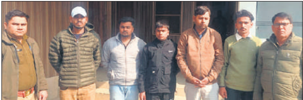
मझोला कोतवाली पुलिस की गिरफ्त में आरोपी।