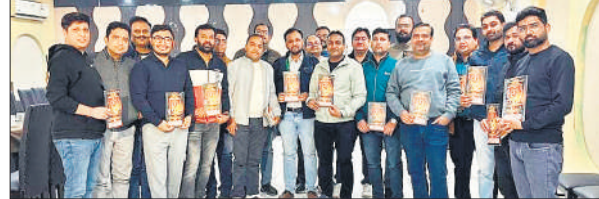
कार्यक्रम के दौरान मौजूद लोग।