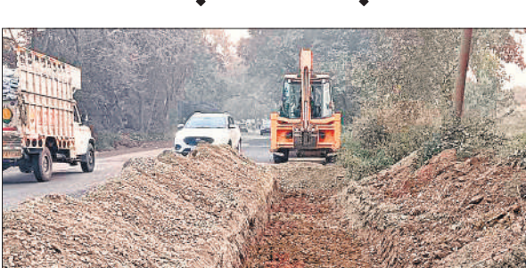
सड़क चौड़ीकरण के काम में लगी जेसीबी।

लोक निर्माण विभाग द्वारा सहसपुर बॉर्डर से छजलैट तक कांट मुरादाबाद हाईवे पर सड़क चौड़ीकरण का कार्य होना था। लगभग 6 माह के भीतर एसडीएम संत दास पवार के निर्देश के बाद गांधी आश्रम कांट से