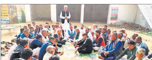
बैठक में उपस्थित भाकियू कार्यकर्ता।