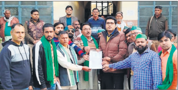
एसडीएम सदर को ज्ञापन देते किसान।