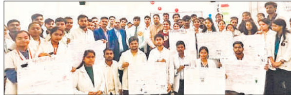
तीन दिनी उद्यमिता विकास कार्यक्रम के दौरान मौजूद विद्यार्थी और प्रोफेसर व अन्य।