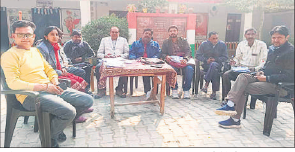
कंपोजिट विद्यालय सालारपुर में एसआईआर के संबंध में जानकारी देते बीएलओ।

बैठके बूथ संख्या 311 से 314 तक रहटा माफी, बूथ संख्या 273 से 275 तक धींगरपुर मूलावान, बूथ संख्या 275 से 279 सर्वोदय इंटर कॉलेज डिलारी तथा बूथ संख्या 315 से 318 रा.क. कॉलेज अल्लपुर सालारपुर में सम्पन्न हुई। बैठक में विशेष प्रगाढ़ पुनरीक्षण, एससी