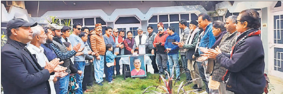
कांग्रेस अध्यक्ष सोनिया गांधी के चित्र के आगे दीप जलाने का कांग्रेसी।