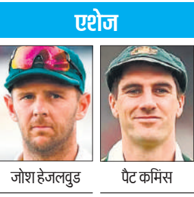
जोश हेजलवुड पैट कमिंस

ऑस्ट्रेलिया के तेज गेंदबाज जोश हेजलवुड हैमस्ट्रिंग और टखने की चोट से इंग्लैंड के खिलाफ एशेज श्रृंखला के बाकी बचे मैचों से बाहर हो गए हैं, लेकिन कप्तान पैट कमिंस पीठ की समस्या से उबरकर वापसी करने को तैयार हैं। हेजलवुड चोटिल होने के कारण पर्थ और ब्रिस्बेन में खेले गए पहले दो मैच में भी नहीं खेल पाए थे लेकिन उम्मीद की जा रही थी कि वह पांच मैचों की श्रृंखला के बाकी मैच में वापसी करेंगे। ऑस्ट्रेलिया पहले दो मैच जीतकर श्रृंखला में 2-0 से आगे है। ऑस्ट्रेलिया के कोच एंड्रयू मैकडोनाल्ड ने मंगलवार को कहा कि हेजलवुड अब अगले साल की शुरुआत में होने वाले टी-20 विश्व कप में वापसी करने का लक्ष्य रखेंगे। मैकडोनाल्ड ने कहा कि वह एशेज