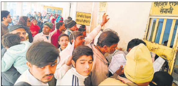
जिला अस्पताल की ओपीडी में दवाई के लिए लाइन में लगे लोग।

मौसम में लगातार बदलाव के चलते सर्दी, खांसी और बुखार के मरीजों की संख्या काफी बढ़ गई है। जिला अस्पताल के मेडिसिन