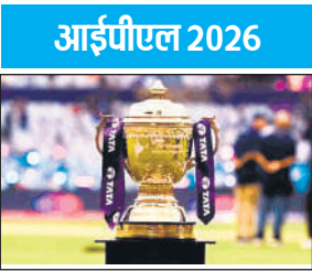
● 16 को अबुधाबी में नीलामी क्विंटन डिकॉक और स्टीव स्मिथ अंतिम सूची में शामिल

इंडियन प्रीमियर लीग (आईपीएल) की 16 दिसंबर को अबुधाबी में होने वाली नीलामी में कुल 350 क्रिकेटरों की बोली लगेगी जिनमें 240 भारतीय और 110 विदेशी खिलाड़ी शामिल हैं। हाल ही में वनडे में संन्यास से वापसी करने वाले दक्षिण अफ्रीका के विकेटकीपर बल्लेबाज क्विंटन डिकॉक का नाम भी अंतिम सूची में शामिल किया गया है। उनका आधार मूल्य एक करोड़ रुपये है। इस सूची में ऑस्ट्रेलियाई बल्लेबाज स्टीव स्मिथ भी शामिल हैं, जिनका आधार मूल्य दो करोड़ रुपये है। स्मिथ आखिरी बार 2021 में आईपीएल में खेले थे। आईपीएल के अनुसार नीलामी के लिए 1390 खिलाड़ियों ने पंजीकरण कराया था। इसे बाद में घटाकर 1005 किया गया था। इनमें से ही अंतिम 350 खिलाड़ियों की सूची तैयार हुई है। 10 फ्रेंचाइजी टीमों इन 350 खिलाड़ियों में से ही बाकी बचे 77 स्थान को भरेंगे। नीलामी में खिलाड़ियों के पहले सेट में भारत और मुंबई के बल्लेबाज पृथ्वी साव और सरफराज खान शामिल हैं। इन्होंने आधार मूल्य 75 लाख रखा है। साव 2018 से 2024 तक आईपीएल में खेले थे, लेकिन पिछली बार नीलामी में उन्हें कोई खरीदार नहीं मिला था। सरफराज 2021 के बाद से इस प्रतियोगिता में नहीं खेले हैं। आईपीएल द्वारा साक्षा की सूची में दो ऑस्ट्रेलियाई खिलाड़ी कैमरन ग्रीन और जेक फ्रेजर मैकगर्क के अलावा न्यूजीलैंड और चेन्नई सुपर किंग्स के पूर्व सलामी बल्लेबाज डेवॉन कॉनवे और दक्षिण अफ्रीका के डेविड मिलर भी शामिल हैं। इनमें से प्रत्येक का आधार मूल्य दो करोड़ है। केकेआर के रिलीज किए ऑलराउंडर वेकटेश