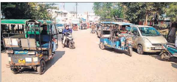
सवारियों की तलाश में घूमते ई- रिक्शा चालक एवं खड़े वाहन।

पुलिस कर्मी भी अनदेखी करते हैं जिसके कारण लोग जाम के झाम से जूझते रहते हैं। ऐसे में मरीजों की जान को खतरा बढ़ जाता है जिला अस्पताल की एंबुलेंस भी जाम में फंस जाती हैं और एंबुलेंस में लेटा मरीज अपनी सांसें गिनता रहता है।