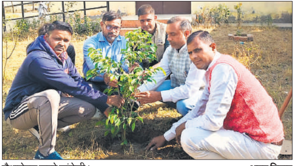
पौधारोपण करते कांग्रेसी।

कांग्रेस कार्यकर्ताओं ने नगर पंचायत सैदनगली स्थित प्राथमिक स्वास्थ्य केंद्र में मरीजों को फलों का वितरण किया। साथ ही अस्पताल परिसर में वृक्षारोपण और सफाई अभियान भी चलाया। जिलाध्यक्ष ने सोनिया गांधी को समर्पण और त्याग की प्रतिमूर्ति बताते हुए कहा कि