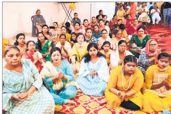
श्रीमद्भगवत पुराण कथा का श्रवण करते भक्त।