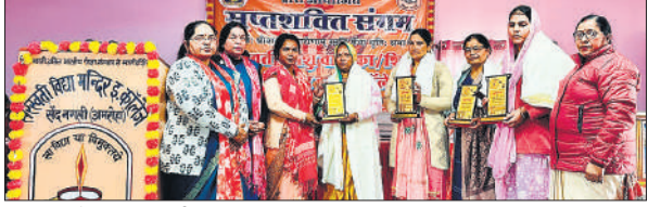
कार्यक्रम में सम्मानित की गई महिलाएं।

इस अवसर पर विद्यालय की छात्राओं और बहनों ने रानी लक्ष्मीबाई, रानी चेन्नम्मा, रानी