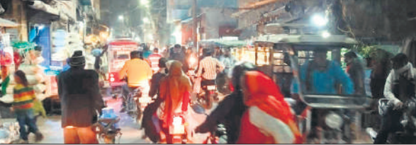
वर्मा मार्केट के निकट जाम में फंसे वाहन।

यह सम्मान जनपद अमरोहा में लाा किए गए ऑब्जेक्टिव इवैल्यूएशन सिस्टम के तहत दिया गया है। यह प्रणाली 1 जुलाई 2025 से प्रभारी निरीक्षक-थानाध्यक्षों के लिए और 1 अगस्त 2025 से उपनिरीक्षकों के कार्यों