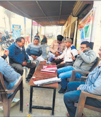
शिविर में मौजूद बिजली कर्मचारी।