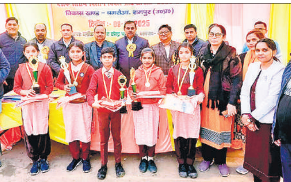
पुरस्कार के साथ मौजूद विजयी छात्र-छात्राएं।