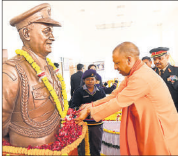
सैनिक स्कूल गोरखपुर में जनरल रावत की प्रतिमा का अनावरण करते मुख्यमंत्री योगी आदित्यनाथ।

योगी मंगलवार को सैनिक स्कूल गोरखपुर में देश के पहले सीडीएस जनरल बिपिन रावत के नाम पर बने अत्याधुनिक एक हज़ार से अधिक सीटों वाले ऑडिटोरियम के उद्घाटन अवसर पर बोल रहे थे। उन्होंने जनरल रावत की प्रतिमा का अनावरण कर पुष्पांजलि अर्पित की और उनके जीवन पर आधारित पुस्तिका का विमोचन भी किया। चौथी पुण्यतिथि पर जीबीआर मेमोरियल फाउंडेशन द्वारा स्थापित प्रतिमा को सीएम ने राष्ट्र के प्रति समर्पण की अमर प्रेरणा बताया। योगी ने लोगों को जाति, क्षेत्र और भाषा के नाम पर समाज और देश को विभाजित करने वालों से सावधान रहने का आह्वान किया। उन्होंने कहा कि की तोड़ने के