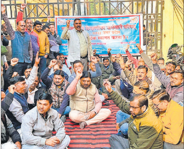
हिंदू कॉलेज में धरना प्रदर्शन करते शिक्षणेत्तर कर्मचारी।

भूखण्ड बनाए गए हैं। योजना में 15 भूखण्ड मिश्रित भू-उपयोग के भूखण्ड व व्यवसायिक भू-प्रयोग के 32 भूखण्ड है।