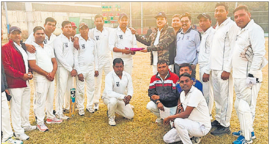
उत्कृष्ट प्रदर्शन करने वाले खिलाड़ी को पुरस्कार करते अतिथि।