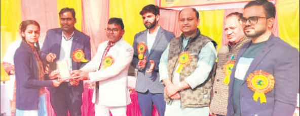
राजकीय इंटर कॉलेज मनकरा में विद्यार्थियों को पुरस्कृत करते अतिथि।