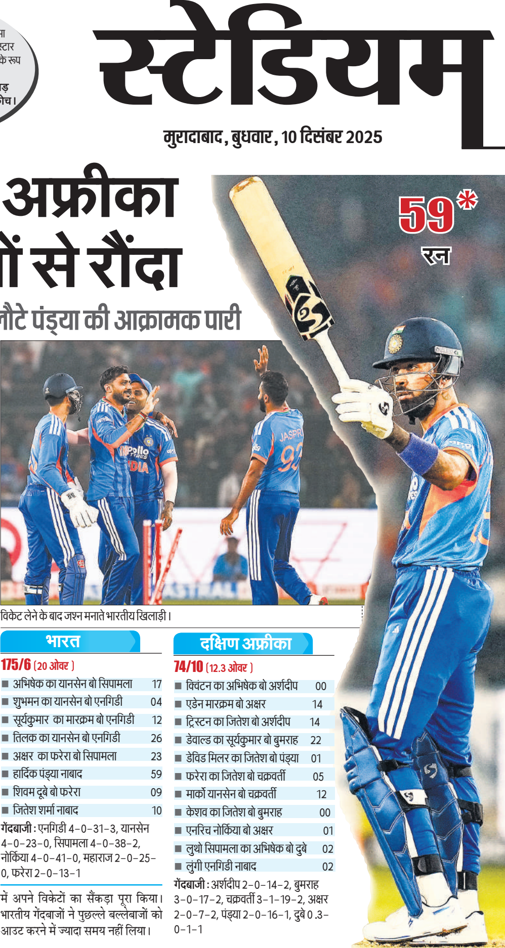
विकेट लेने के बाद जश्न मनाते भारतीय खिलाड़ी।

पंड्या ने गेंद थामते ही मिलर को पवेलियन भेजा। टीम का स्कोर 50 रन तक ही पहुंचा था कि चक्रवर्ती ने फरेरा भेजा। मार्को यानसेन खतरनाक होते उससे पहले चक्रवर्ती ने उन्हें बौल्ट कर दिया। बुमराह ने अगले ओवर में ब्रेविस को आउट कर टी20 अंतर्राष्ट्रीय