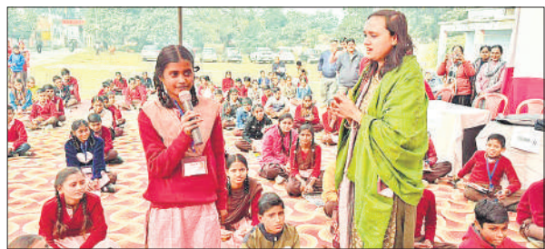
बीएसए के सामने प्रतिभाग करती छात्रा।