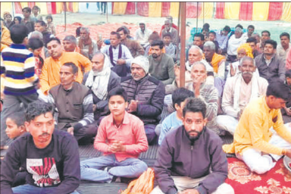
भागवत कथा सुनने पहुंचे श्रद्धालु।