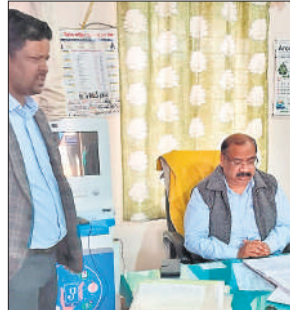
जेल अस्पताल का निरीक्षण करते सीएमओ डॉ. संतोष गुप्ता।

जेल में भ्रमण कर कैदियों की जांच करने को कहा है। सीएमओ ने सभी कैदियों की नियमित स्वास्थ्य जांच कराने के निर्देश दिए हैं। साथ ही रोस्टर के अनुसार चिकित्सकों की दी जा रही सुविधाओं की समीक्षा भी की।