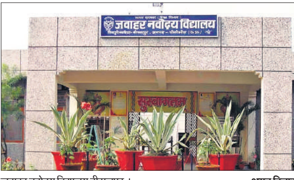
जवाहर नवोदय विद्यालय बीसलपुर।

बीसलपुर तहसील क्षेत्र में संचालित जवाहर नवोदय विद्यालय में शैक्षिक सत्र 2026-27 के लिए प्रवेश परीक्षा शुरू होने जा रही है। कक्षा छह के लिए 80 सीटें निर्धारित की गई हैं। जिन पर आवेदन मांगे गए थे। इन 80 सीटों के लिए कुल 4290 छात्र-छात्राओं ने आवेदन किए हैं। जो कि निर्धारित सीट के सापेक्ष सार्वधिक है। मानक के हिसाब से एक सीट पर करीब 53 छात्र-छात्राएं दावा कर रहे हैं। इस संख्या में अकेले