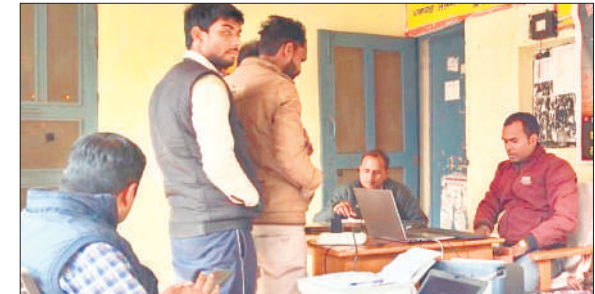
शिविर में पहुंचे उपभोक्ता।