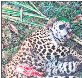
खेत में पड़ा मादा तेंदुए का शव।