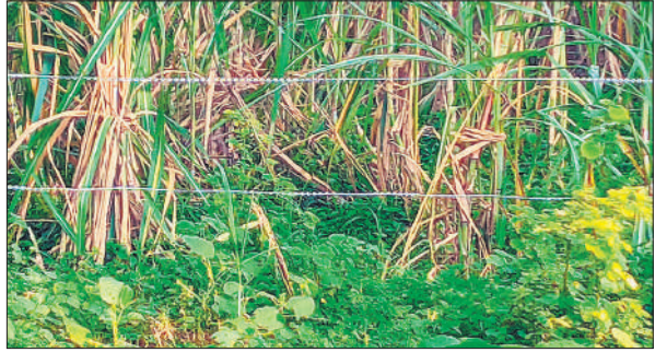
खेत के किनारे किसानों द्वारा लगाए गए ब्लेड वाले तार।

अमृत विचार: क्षेत्र में फसलों की सुरक्षा के नाम पर किसान नियमों को ताक पर रखकर खेतों की मेड़बंदी के लिए लगाए जा रहे आरीदार तार गोवंशीय पशुओं के लिए मौत का कारण बनते जा रहे हैं। बिजुआ ब्लॉक क्षेत्र के कई गांवों में किसानों ने छुट्टा पशुओं से अपनी फसल बचाने के उद्देश्य से खेतों के चारों ओर ब्लेड वाले तार लगाए हैं, जो न सिर्फ पशुओं बल्कि इंसानों के लिए भी खतरनाक साबित हो रहे हैं। स्थानीय ग्रामीणों के अनुसार ये तार इतने धारदार होते हैं कि इनमें फंसने के बाद पशुओं का बच पाना लगभग असंभव हो जाता है। आए दिन ऐसे दृश्य देखने को मिलते हैं, जब कोई गोवंश इन तारों में फंसकर गंभीर रूप से घायल अवस्था में तड़पता हुआ इधर-