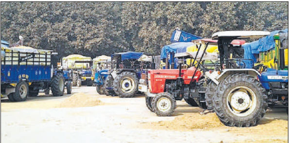
मंडी समिति पीलीभीत में तौल के इंतजार में खड़े धान लदे वाहन।

जिले में तीन अक्टूबर को धान खरीद शुरू हुई थी। 2.45 लाख मीट्रिक टन लक्ष्य को पूरा करने के