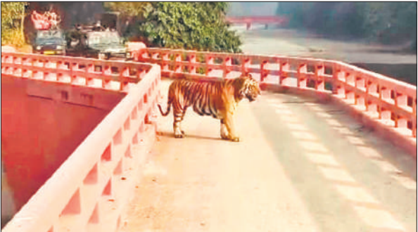
साइफन पुल पर सफारी वाहनो से घिरा बाघ (फाइल फोटो)।

पीलीभीत टाइगर रिजर्व के पर्यटन सत्र के दौरान रविवार शाम बराही रेंज स्थित साइफन पुल पर सफारी वाहनो से बाघ को घेरने का मामला सोशल मीडिया पर वायरल हुआ था। वायरल वीडियो में करीब 4 से 5 सफारी वाहन पुल के दोनों छोर पर खड़े दिखाई दिए थे। पुल के बीचों बीच