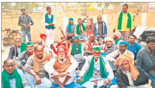
पंचायत में मौजूद भाकियू टिकैत के कार्यकर्ता।

ज्ञापन में बताया छुट्टा पशुओं से किसानों की फसल नष्ट हो रही है। प्रति राशन कार्ड धारक को एक गाय नाने के लिए मुहैया कराई जाए। जिससे गोसंरक्षण हो सके, अन्यथा की स्थिति में राशन कार्ड निरस्त किया जाए। गांव में तैनात सफाई कर्मी ब्लॉक में ड्यूटी कर रहे हैं। ऐसे में गांवों में सफाई व्यवस्था चौपट है। आवास योजना के अंतर्गत सचिव और प्रधान अपात्रों को लाभान्वित कर रहे हैं। सुविधा श्रृंखला की मांग की जाती है। ग्राम पंचायत भेदगंज में कई वर्षों से सफाई कर्मी की तैनाती ही नहीं है। कई बार अवगत कराने के बाद भी तैनाती नहीं की गई। इसके अलावा कहा कि सरकारी योजनाओं जैसे विकलांग आवास, मुख्यमंत्री आवास, शौचालय, निःशुल्क बोरिंग समेत योजनाओं में धांधली बरती जा रही है। इसकी जांच करारक पात्रों को लाभ दिलाया जाए। निस्तारण