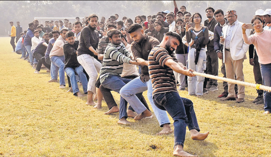
रस्साकशी प्रतियोगिता में भाग लेते छात्र और स्टाफ।