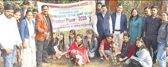
बरेली कॉलेज के हॉकी ग्राउंड में पौधे रोपते छात्र व शिक्षक।