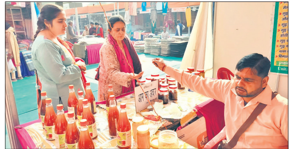
प्रदर्शनी में खरीदारी करने पहुंची महिलाएं। ● अमृत विचार

इसके बाद हनुमान चालीसा और आरती की गई। मंदिर में छोटे बच्चों के लिए श्रीराम की पुस्तकें वितरण की गईं। जिनके माध्यम से बच्चों को राम नाम जपने और लिखने के बारे में बताया गया। इसके बाद प्रसाद का वितरण किया।