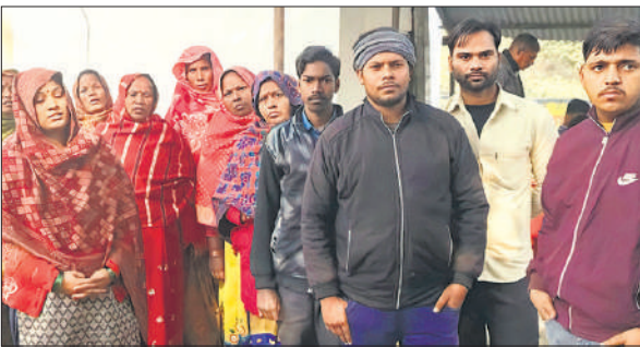
घटना की जानकारी देते परिजन।