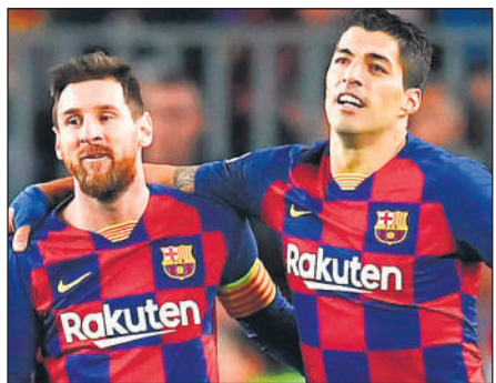
● 2022 विश्व कप जीत की यादगार चीजें मुंबई में नीलामी के लिए मांगी गईं