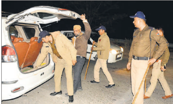
बनभूलपुरा क्रोसिंग के पास गोला पुल पर वाहन चेकिंग करते हुए पुलिसकर्मी।