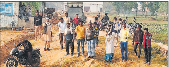
कटा सम्पर्क मार्ग दिखाते ग्रामीण।

कृषि विभाग ने दिसंबर तक की उपलब्धता रिपोर्ट जारी करते हुए स्पष्ट किया है कि जिले में उर्वरक की कमी नहीं है। यूरिया, डीएपी, एनपीके, एएसएसपी जैसे प्रमुख उर्वरकों का पर्याप्त स्टॉक उपलब्ध है। कृषि अधिकारी ने निर्देश दिए उर्वरक केवल पीओएस मशीन के माध्यम से ही वितरित किए जाएं। किसानों से निर्धारित मूल्य से अधिक न लिया जाए। अनियमितता पाए जाने पर आवश्यक वस्तु अधिनियम के तहत कठोर कार्रवाई होगी।