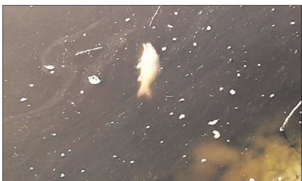
रामगंगा में दूषित जल आने से मरी मछलियां।

अमृत विचार : रामगंगा नदी में पिछले तीन दिनों से रामपुर की ओर से काला और दूषित पानी छोड़े जाने से मीरगंज तहसील के कपूरपुर और गोरा लोकनाथपुर क्षेत्रों में नदी की सैकड़ों मछलियां मृत मरी पाई गईं। भारी संख्या में मछलियों की मौत से ग्रामीणों में आक्रोश है। कई मछुआरे रोज नदी से ही मछलियां पकड़कर बेचते हैं, ऐसे में उनकी आजीविका पर भी सीधा असर पड़ा है। ग्रामीणों के अनुसार नदी का पानी सामान्य