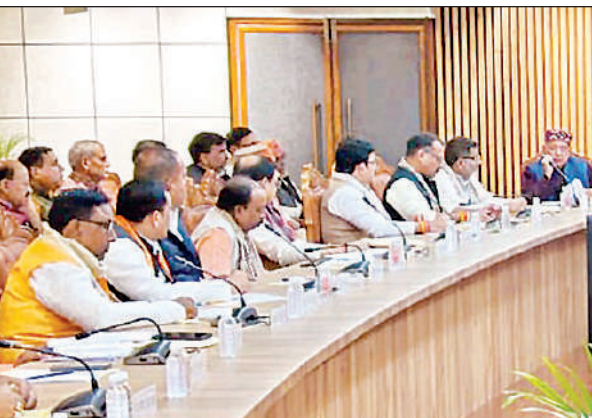
गोरखपुर में विशेष संक्षिप्त पुनरीक्षण (एसआईआर) को लेकर भाजपा मंत्रियों-विधायकों, जनप्रतिनिधियों और संगठन पदाधिकारियों के साथ बैठक करते मुख्यमंत्री योगी आदित्यनाथ।

भ्रष्टाचार निवारण संगठन के अधिकारी के मुताबिक, प्रयागराज यूनिट के इंस्पेक्टर राकेश बहादुर