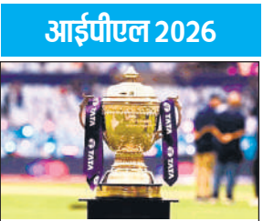
● 16 को अबुधाबी में नीलामी क्विंटन डिकॉक और स्टीव स्मिथ अंतिम सूची में शामिल

आईपीएल द्वारा साक्षा की सूची में दो ऑस्ट्रेलियाई खिलाड़ी कैमरन ग्रीन और जेक फ्रेजर सैकगर्क के अलावा न्यूजीलैंड और चेन्नई सुपर किंग्स के पूर्व सलामी बल्लेबाज डेवॉन कॉनवे और दक्षिण अफ्रीका के डेविड मिलर भी शामिल हैं। इनमें से प्रत्येक का आधार मूल्य दो करोड़ है। केकेआर के रिलीज किए ऑलराउंडर वेकटेश