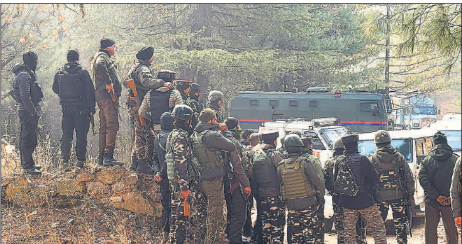
जम्मू- कश्मीर के अनंतनाग जिले के हुतमुराह वन क्षेत्र में सुरक्षाकर्मियों के साथ छानबीन करती एनआईए की टीम।

भारतीय महासागर जिसमें भारत, श्रीलंका, इंडोनेशिया आदि शामिल हैं। यहां 26 दिसंबर 2004 को आई सुनामी में लगभग 2,30,000 से अधिक लोगों की मौत हुई थी। इंडोनेशिया के निकट समुद्र के भीतर 9.1 तीव्रता का भूकंप इसकी वजह रही। दर्जनों शहर नष्ट व लाखों लोग विस्थापित हुए थे।