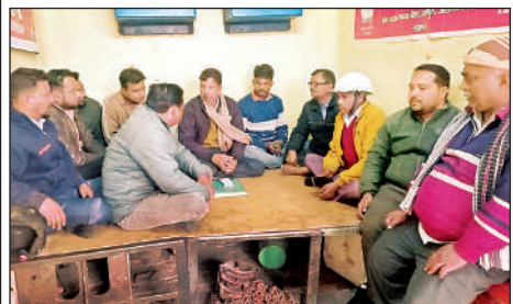
बैठक में शामिल बिजली सविदा कर्मचारी।