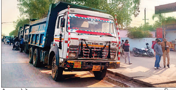
सेरपुर थाने में खड़ा ट्रक।

अमृत विचार : आईआईएम रोड पर ओवरलोड मौरंग से भरे ट्रक संख्या यूपी 32 क्यूएन 0217 को सीज किया गया है। जांच में पता चला कि ट्रक में 68 टन मौरंग लदी हुई थी। शहर में लगातार ओवरलोड ट्रकों का आवागमन जारी है। इसी मुद्दे पर अमृत विचार ने 4 दिसंबर