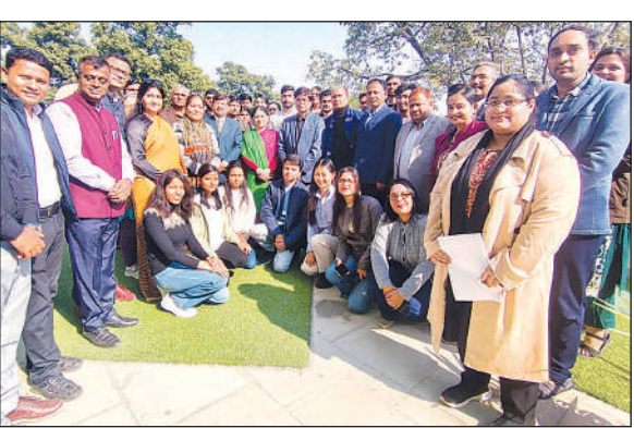
लखनऊ विश्वविद्यालय में आयोजित कार्यक्रम में प्रतिभागी।