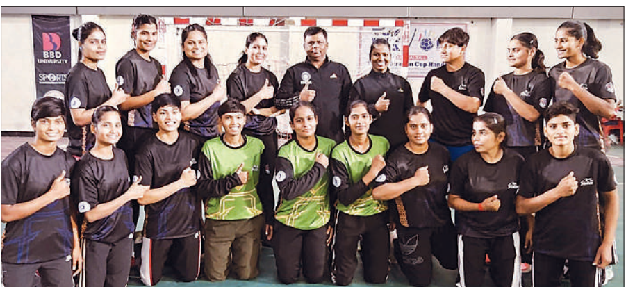
फाइनल में पहुंचने वाली यूपी महिला टीम।