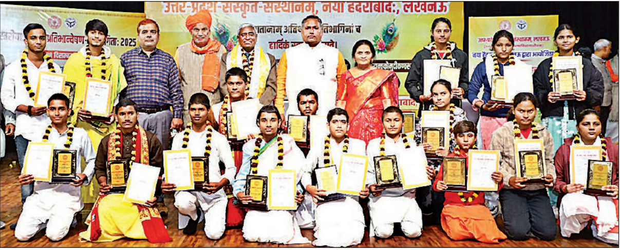
अतिथियों और आयोजकों के साथ राज्यस्तरीय संस्कृत प्रतिभा खोज प्रतियोगिता के विजेता प्रतिभागी।