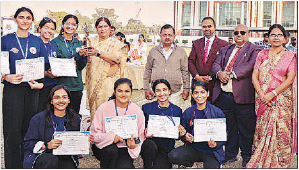
विजयी प्रतिभागियों के साथ कुलपति व अन्य।

कुलपति मंगलवार को केजीएमयू की 104वीं वार्षिक खेलकूद मीट ‘द्रोण’ के उद्घाटन अवसर पर सरदार पटेल ग्राउंड में छात्रों को संबोधित कर रही थीं। उन्होंने कहा कि खेलकूद गतिविधियां छात्रों के शारीरिक व मानसिक विकास, एकाग्रता, आत्म-सम्मान और टीमवर्क को बढ़ाती हैं। इससे तनाव कम होता है और जीवन के अनुशासन व कौशल विकसित होते