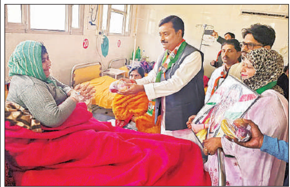
सिविल अस्पताल में मरीज को फल देते कांग्रेस कार्यकर्ता।