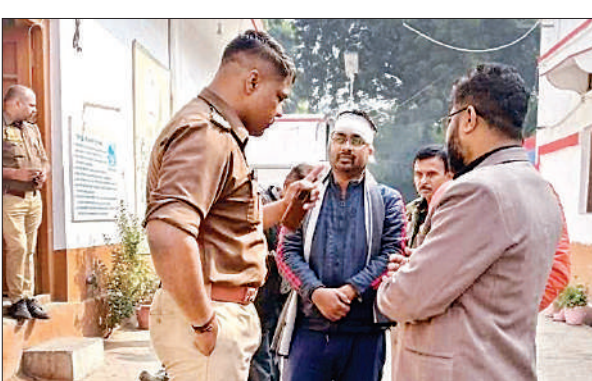
मौके पर लोगों से पूछताछ करता पुलिसकर्मी।