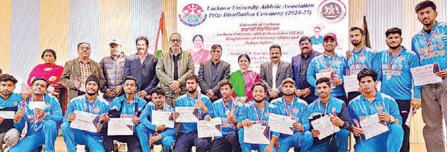
लखनऊ विश्वविद्यालय के एपी सेन सभागार में एथलेटिक्स एसोसिएशन द्वारा सम्मानित किए गए खिलाड़ी।