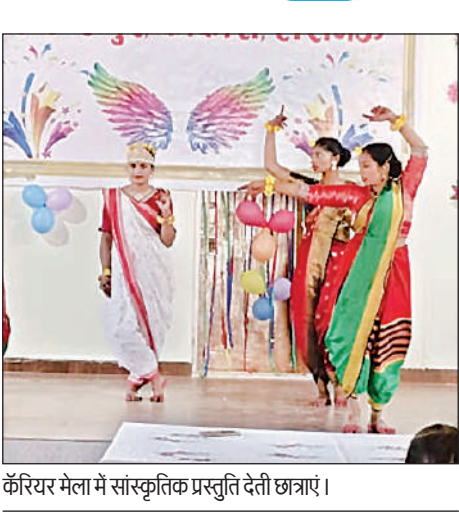
कॅरियर मेला में सांस्कृतिक प्रस्तुति देती छात्राएं।