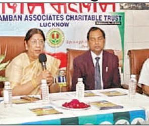
कार्यक्रम को संबोधित करती कुलपति।