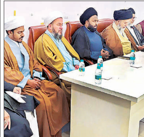
शिया कॉलेज में ईराक के विद्वानों का दल।