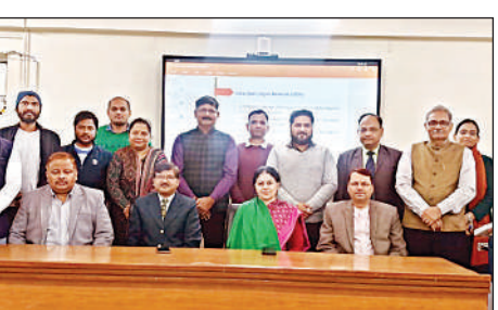
मालवीय मिशन शिक्षण प्रशिक्षण कार्यक्रम में उपस्थित शिक्षक।