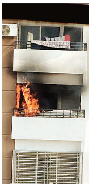
बालकनी में लगी आग

दमकल की तत्परता से आग फ्लैट के अंदर तक नहीं पहुंच पाई और आसपास के अन्य फ्लैट भी सुरक्षित रहे। हालांकि, बालकनी में रखा सामान जलकर राख हो गया। आग लगने का कारण स्पष्ट नहीं हो सका है। वहीं, अपार्टमेंट के निवासियों ने परिसर में लगे खराब फायर सिस्टम पर नाराजगी जताई।