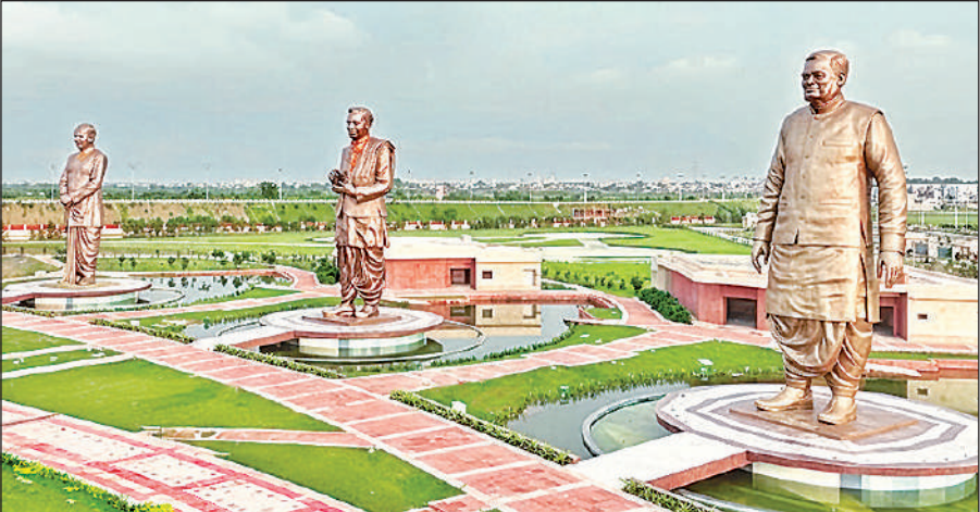
राष्ट्र प्रेरणा स्थल में पंडित दीनदयाल उपाध्याय, श्यामा प्रसाद मुखर्जी और पूर्व प्रधानमंत्री अटल बिहारी वाजपेयी की प्रतिमाएं।