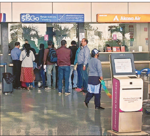
एयरपोर्ट पर इंडिगो एयरलाइंस के विमानों की जानकारी करती यात्री।