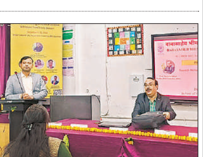
बीबीएयू में कार्यक्रम में जानकारी देते विशेषज्ञ।