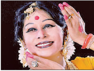
पद्मश्री शोभना नारायण।