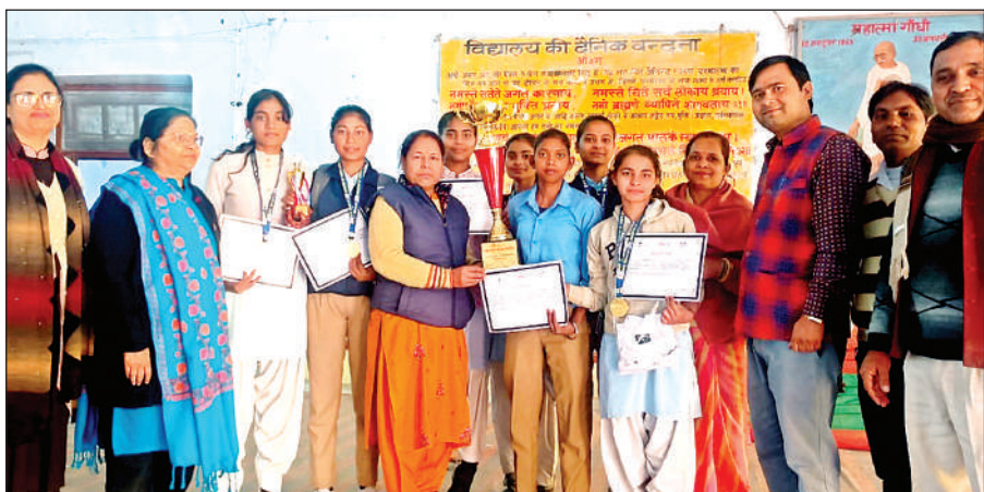
विजेता कबड्डी टीम का स्वागत करते कॉलेज के शिक्षक।