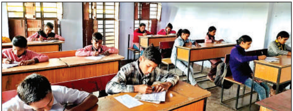
परिषदीय विद्यालयों में परीक्षा देते परीक्षार्थी।

प्रश्न पत्र और उत्तर पुस्तिकाएं स्कूलों में समय से उपलब्ध करा दी जिससे परीक्षाएं निर्धारित समय पर शुरू हो गईं। अर्द्धवार्षिक परीक्षाओं की जमीनी हकीकत परखने के लिए नगला कले के कंपोजिट स्कूल में पहुंचा जहां कि 78 छात्र पंजीकृत हैं परीक्षा के समय 68 छात्र उपस्थित थे। स्कूल में कक्षा एक से पांच तक के छात्रों की मौखिक तो जूनियर के छात्रों की लिखित परीक्षा चल रही थी। दारूदपुर कंपोजिट स्कूल में 62 के सापेक्ष 60 छात्र परीक्षा देते मिले।