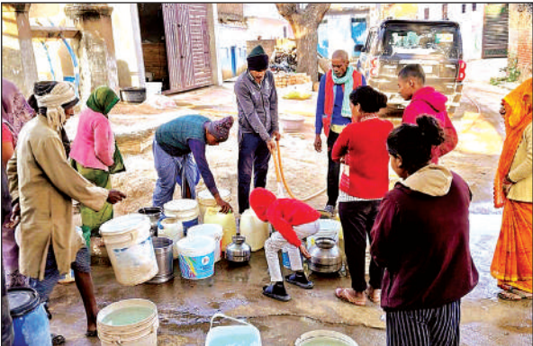
पौथिया में सबमर्सिबल पंप से पानी भरने के लिए लगी भीड़।