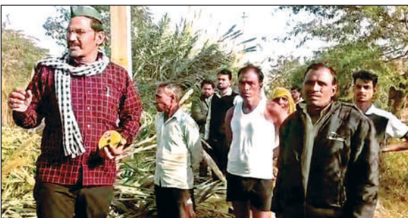
मानक के अनुसार सफाई न होने पर विरोध करते किसान।

किसानों ने बताया कि यदि इसी तरह की अधूरी खुदाई जारी रही तो माइनर में पानी छोड़े जाने पर खंडी कटने का खतरा बढ़ जाएगा। किसानों ने यह भी बताया कि हर सीजन में कटान होने से हजारों बीघा क्षेत्र जलमग्न हो जाता है, जिससे