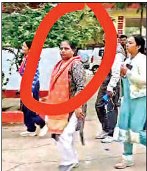
बीडीओ को थाने ले जाती विजिलेंस की टीम।