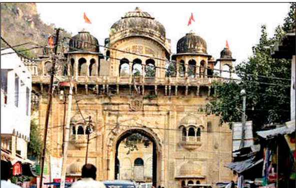
इयोदी दरवाजा भी जर्जर हालत में पहुंच गया है।

जिसमें विभिन्न धातुओं एवं रत्नों से शंकरजी की मूर्ति स्थापित की गई। मौजूदा समय में यह स्थान वन विभाग के अधीन है और यहां पर देशी विदेशी पर्यटक आज भी टोला तालाब की सुंदरता को देखने के लिए आते हैं। नगर के प्रवेश द्वार पर जय सागर, विजय सागर, मलखान सागर, रपट तलैया, सुंदर तालाब