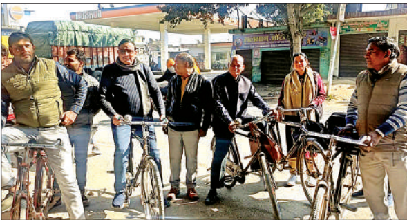
साइकिल से काम पर जाते ग्राम पंचायत ग्राम विकास अधिकारी।

इनका कहना है कि ऑनलाइन हाजिरी व्यावहारिक नहीं है। ग्राम