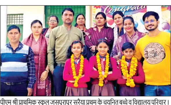
पीएम श्री प्राथमिक स्कूल जसपुरापुर सरैया प्रथम के चयनित बच्चे व विद्यालय परिवार।