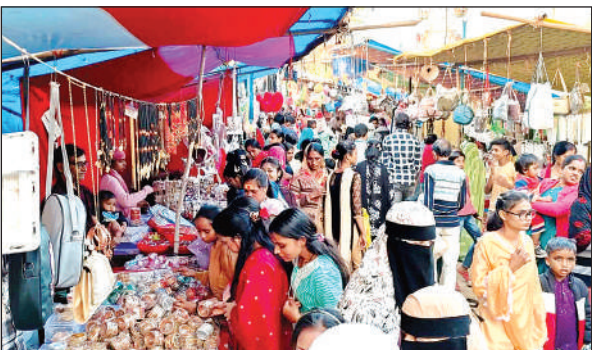
तकिया मेले में खरीदारी करती महिलाएं।