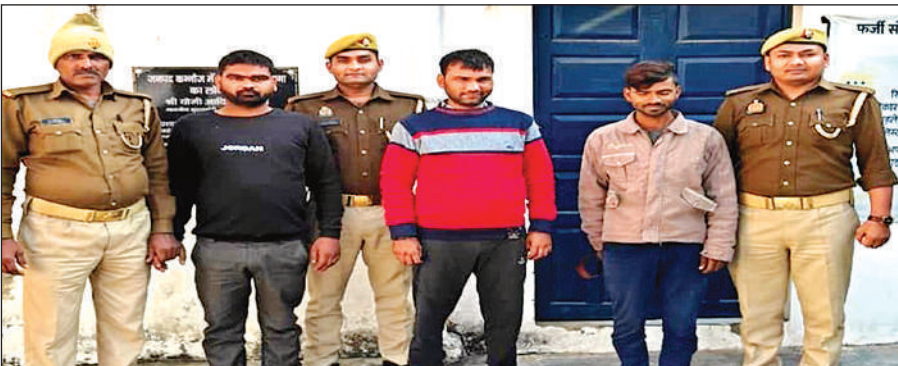
साइबर अपराध के आरोपी पुलिस गिरफ्त में।