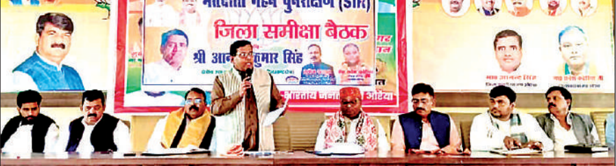
बैठक के दौरान जानकारी देते जिला प्रभारी।