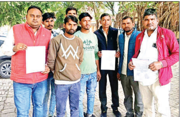
जिलाधिकारी को ज्ञापन देने पहुंचे जखेड़ी के ग्रामीण।