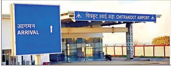
सूना पड़ा चित्रकूट हवाई अड्डा ।

गौरतलब है कि मार्च 2024 में उड़ान योजना के तहत चित्रकूट के देवांगना एयरपोर्ट से हवाई सेवा शुरू की गई थी। इस एयरपोर्ट से फ्लाइट ऑपरेशन का एक्सक्लूसिव राइट फ्लाईबिग एयरलाइंस के पास था। फ्लाईबिग ने चित्रकूट-लखनऊ के बीच फ्लाइट ऑपरेशन शुरू तो किए लेकिन ये उड़ानें चंद महीने के बाद