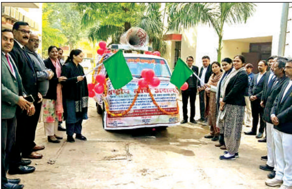
प्रचार वाहन को हरी झंडी दिखाकर रवाना करते न्यायिक अधिकारी।

प्रचार वैन का मुख्य उद्देश्य लोक अदालत के संबंध में जानकारी देकर आम जन मानस को जागरूक करना है। इस अवसर पर जिला