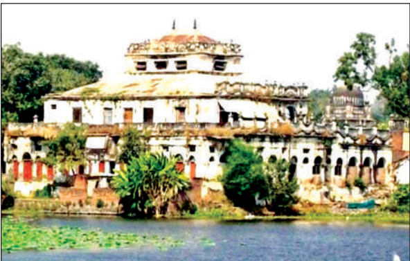
अस्तित्व खो रही चरखारी की तालाब कोठी।

अमृत विचार। शिल्प सौंदर्य की अन्तुी नगरीय चरखारी शासन प्रशासन व पुरातत्व विभाग की उपेक्षा के चलते अपना वैभव खोती जा रही है। बुंदेलखंड का कश्मीर कहे जाने वाली यह नगरी प्राकृतिक सुंदरता में सरावोर हैं। यहां पर चारो तरफ बने सरोवर ऐतिहासिक नगरी की सुंदरता में चार चांद लगाते हैं। 18वीं सदी में बुंदेलखंड में मुगलों का शासन था, लेकिन बुंदेलखंड में छत्रसाल ने मुगल सत्ता को स्वीकार नहीं किया था। 1671 में उन्होंने शिवाजी से प्रेरणा लेकर पांच घुरसवार व 25 सैनिक लेकर बुंदेलखंड में स्वाधीनता का शंखनाद किया और उनके पुत्र जगतनाथ ने 1765 में चरखारी की नींव रखी थी। चरखारी के राजा का राज्य 808 वर्ग मीटर तक फैला था, इसमें रानीपुर, ईसानगर, जुझार नगर,