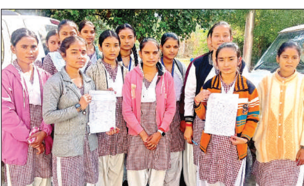
जिलाधिकारी को अपनी पीड़ा बताने पहुंची इंटर की छात्राएं।

इंटर की छात्राओं ने बताया कि श्रीगोकुल प्रसाद बालिका इंटर कालेज खरेला में शिक्षक सही ढंग से शिक्षण कार्य नहीं कर रहे हैं। अब तो अभद्र शब्दों का प्रयोग कर उनके नंबर काटने को धमका रहे हैं। जुलाई माह से छात्राओं पर जबरन दबाव बनाया जा रहा है, जिसकी