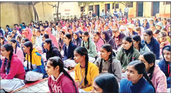
जागरूकता कार्यक्रम में मौजूद छात्र-छात्राएं।