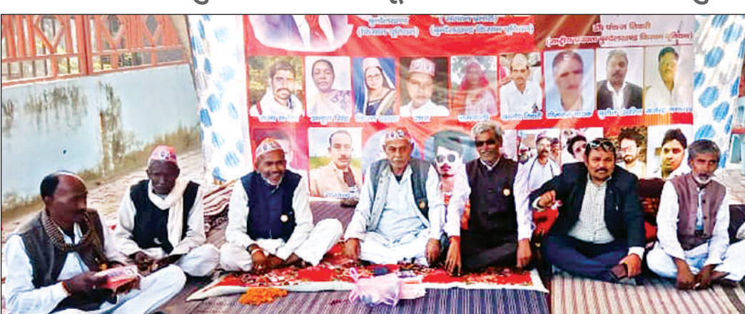
खाद और बिजली की किलत पर आंबेडकर पार्क में धरने पर बैठे किसान नेता।

जिले में खाद और बिजली की समस्या के खिलाफ आंदोलनरत बुंदेलखंड किसान यूनियन ने शुक्रवार को अनिश्चितकालीन अनशन शुरू कर दिया। आंबेडकर पार्क में एकत्र हुए किसान नेताओं ने समस्याओं की अनदेखी पर जिला