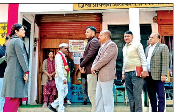
जिला प्रोबेशन अधिकारी कार्यालय का निरीक्षण करतीं डीएम।