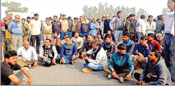
जाम लगाए परिजन।