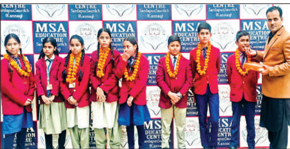
उत्तीर्ण छात्र-छात्राओं को मिठाई खिलाता विद्यालय का स्टाफ।