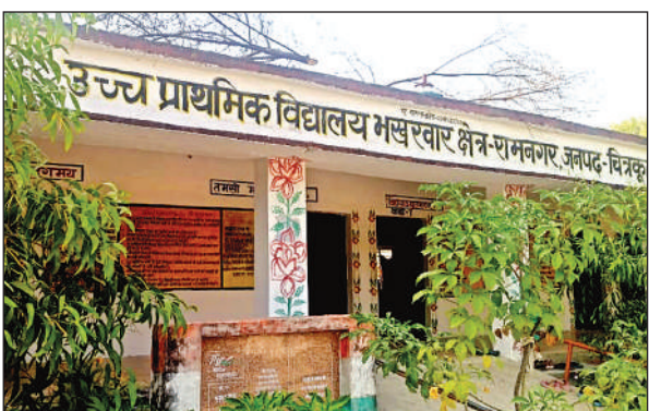
उच्च प्राथमिक विद्यालय भखरवार के परिसर में लगे पेड़-पौधे।