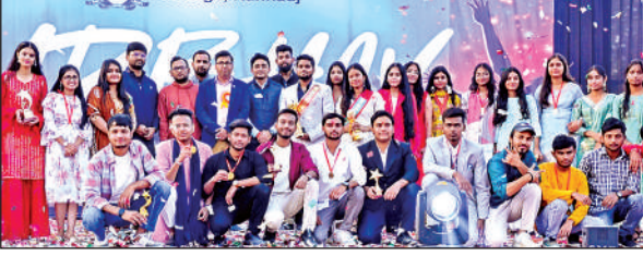
कार्यक्रम में मौजूद छात्र-छात्राएं एवं सिविल इंजीनियरिंग विभाग की टीम।