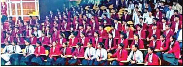
शैक्षिक भ्रमण के दौरान मौजूद छात्र, छात्राएं।

मरम्मत कार्य के लिए लगाए गए जनरेटर में अचानक खराबी आ गई, जिसके कारण लगभग एक घंटे तक पुल पर काम रुका रहा। इस बाधा ने पहले से ही धीमी गति से चल रहे कार्य को और प्रभावित किया। पुल पर वन-वे ट्रैफिक व्यवस्था के चलते बड़े वाहनों को पुलिसकर्मियों द्वारा एक-एक करके निकाला जा रहा है। इसके परिणामस्वरूप,