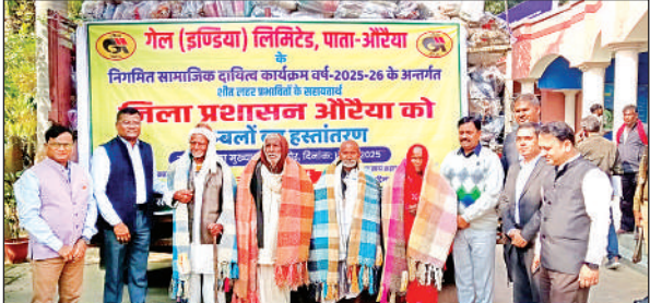
जरूरतमंदों को कंबल वितरण करते जिलाधिकारी डॉ. इंद्रमणि त्रिपाठी।

निर्माणाधीन आंगनवाड़ी केंद्रों की समीक्षा की : समीक्षा के दौरान जिलाधिकारी ने जनपद में निर्माणाधीन आंगनवाड़ी केंद्रों की समीक्षा करते हुए संबंधितों को निर्देश दिए कि निर्माण संबंधी अवशेष कार्य मानक व गुणवत्ता शीघ्र पूर्ण कराएं साथ ही सतत निरीक्षण कार्य की समीक्षा भी करते रहे। जनपद में जरूरतमंदों को स्वास्थ्य सेवाओं का लाभ दिए जाने हेतु न्याय पंचायतवार आयोजित होने वाले आरोग्यम शिविरों में सभी विभागीय अधिकारी अधीनस्थों की ड्यूटी निर्धारित करते हुए शिविर में उपस्थिति सुनिश्चित करें और स्वयं भी पहुंचकर कार्य की समीक्षा करें। इसमें शिविर में आने वाला कोई भी पात्र वंचित न रहे।