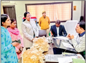
डीएम को मशरूम की खेती के बारे में जानकारी देती समूह की महिलाएं।

निर्देशित किया कि नगरीय क्षेत्रों में आवश्यकता अनुरूप स्थान चिह्नित कराते हुए टंड से बचाव हेतु पर्याप्त स्थान पर अलाव जलवाएं साथ ही रैन बसेरों को भी पूरी क्षमता के साथ संचालित किया जाए। जिससे