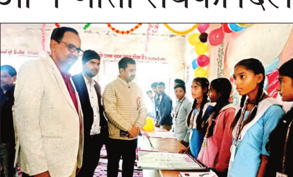
कॅरियर गाइडेंस मेला में पोस्टर देखते एमएलसी।

कॅरियर गाइडेंस मेले में छात्र छात्राओं द्वारा बनाए गए पोस्टरों, मॉडल कला व अन्य जागरूकता प्रदर्शनी का अवलोकन किया। इस मौके पर छात्र छात्राओं ने सांस्कृतिक कार्यक्रम में नृत्य गीत संगीत की मनमोहक प्रस्तुति दी। एमएलसी ने बच्चों को संबोधित करते हुए कहा कि कहा कि शिक्षा ही संपूर्ण बदलाव की आधार है, इसके बिना समाज