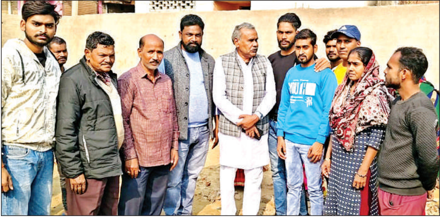
मलिन बस्ती में सफाई कर्मियों से बातचीत करते एससीएसटी आयोग के सदस्य।

वहीं पालिका सफाई कर्मियों के स्वास्थ्य परीक्षण से संबंधित अभिलेखों व उनके मेडिकल, बीपी की जांच व उपलब्ध कराई जा रही सुविधाओं की जानकारी की। कहा कि सफाई कर्मियों की स्वास्थ्य संबंधित समस्याओं को