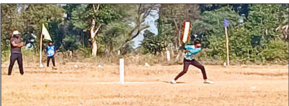
टूर्नामेंट में बल्लेबाजी करता खिलाड़ी।

टूर्नामेंट के पहले मैच में अनमोल क्लब का सामना सीएससी क्लब से हुआ। टॉस जीतकर सीएससी क्लब ने पहले फील्डिंग का फैसला लिया। अनमोल क्लब ने निर्धारित 10 ओवर में 6 विकेट खोकर 85 रन बनाए। लक्ष्य का पीछा करते हुए