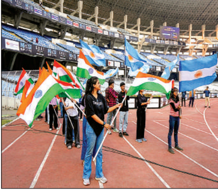
कोलकाता में रिवर्सल के तहत भारत और अर्जेंटीना के झंडे को लहराते वॉलंटियर्स। लियोनेल मेसी की जर्सी बेचता युवक।

आठ बार बैलोन डीओर जीतने वाले मेसी इस बार 'जोओएटी इंडिया टूर 2025' में फुटबॉल खेलने वाले नहीं हैं। यह पूरी तरह से प्रचार और व्यावसायिक रूप से आयोजित कार्यक्रम है, जो शनिवार को यहां शुरू होगा और सोमवार को नयी दिल्ली में समाप्त होगा। फिर भी एक ऐसे शहर के लिए