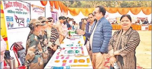
छात्रों और शिक्षकों के मॉडल को देखते अधिकारी।