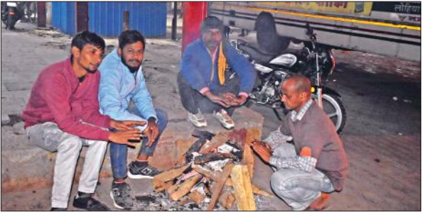
पुराने बस अड्डे पर अलाव सेकते यात्री।