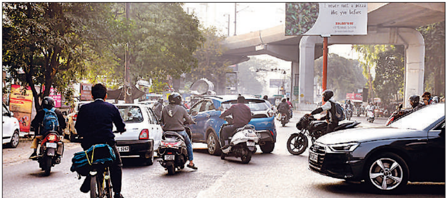
निशातगंज चौराहे की ओर से और आईटी टी चौराहे से यूर्टन पर जाम के साथ वाहन टकराने की आशंका बनी रहती है।