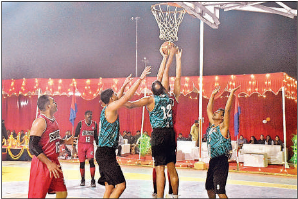
मैच के दौरान पूर्वोत्तर रेलवे एवं दक्षिण रेलवे टीम के खिलाड़ी। अमृत विचार

अमृत विचार । रेलवे सुरक्षा बल पूर्वोत्तर रेलवे के तत्त्वावधान में 10 से 13 दिसम्बर तक सैयद मोदी रेलवे स्टेडियम, गोरखपुर में खेली जा रही 32वीं अखिल भारतीय रेलवे सुरक्षा बल बास्केटबॉल प्रतियोगिता-2025 के तीसरे दिन शुक्रवार को सायं सत्र में खेले गये सेमीफाइनल मैच में पूर्वोत्तर रेलवे ने प्रतिद्वंदी टीम दक्षिण रेलवे पर को कड़े मुकाबले में 75-64 अंकों से हराकर फाइनल में प्रवेश किया । इसके पूर्व, मेजबान पूर्वोत्तर रेलवे ने प्रातःकालीन सत्र में अपने शानदार प्रदर्शन से पश्चिम रेलवे को 47-39 अंको से हराकर सेमीफाइनल में प्रवेश किया । प्रातः काल के अन्य