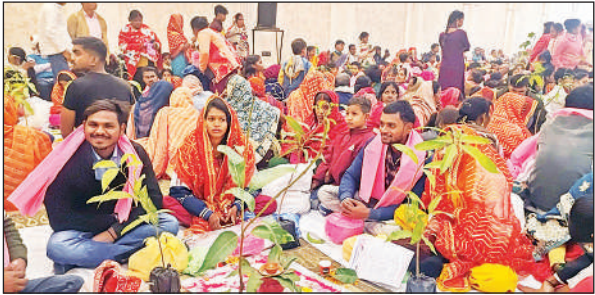
मुख्यमंत्री सामूहिक विवाह समारोह के दौरान रस्म अदा करते युगल जोड़े ।