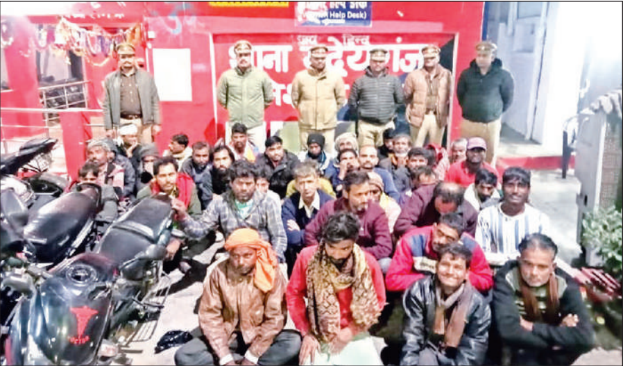
सार्वजनिक स्थानों पर शराब पीने के आरोप में पकड़े गए लोग।

लगातार आ रही शिकायतों को गंभीरता से लेते हुए अभियान चलाया गया। सभी जेजों की पुलिस टीमें देर रात तक सड़क पर मुस्तैद रहीं और भीड़भाड़ वाले स्थानों पर चेकिंग