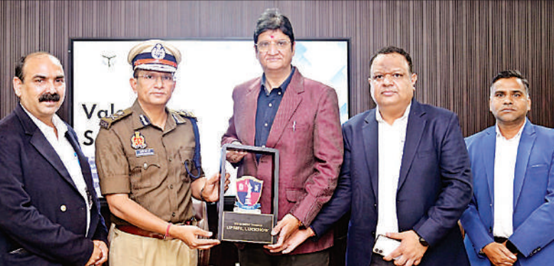
कोर्स के समापन कार्यक्रम में मुख्य अतिथि को स्मृति चिह्न देकर सम्मानित करते फॉरेंसिक इंस्टीट्यूट के अधिकारी।