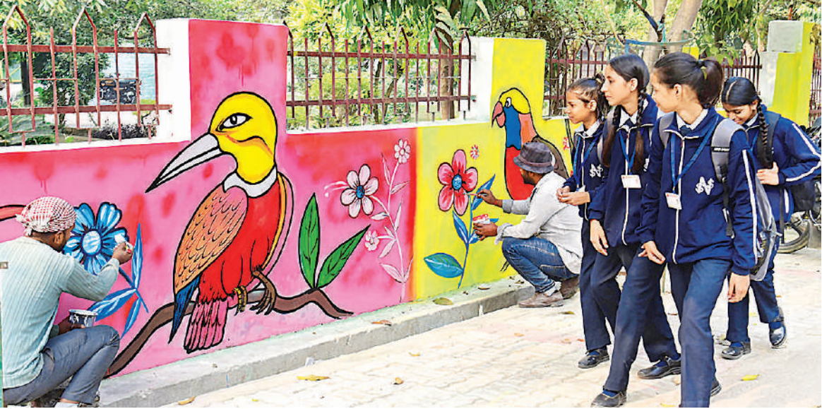
ऐशबाग स्थित मोती झील कॉलोनी के मजार वाले पार्क की दीवार पर फूल-पक्षी की पेंटिंग बनाते नगर निगम के कलाकारों को देखते स्कूली बच्चे।