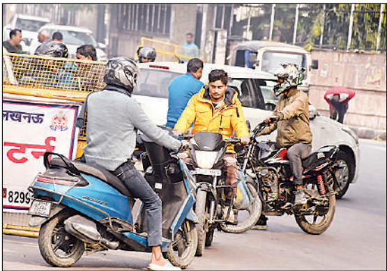
अशोक मार्ग से अटल चौराहे की ओर जाने वाले मार्ग की ओर यूर्टन पर भी हे दुर्घटनाओं की आशंका बनी रहती है। अमृत विचार

अमृत विचार: मुख्य चौराहे पर दबाव कम करने के लिए आईटी और निशातगंज गोपाल पुरवा चौराहा पर वाहनों को कुछ दूरी से घुमा कर निकाला जा रहा है। जगह-जगह लगी बैरिकेडिंग यातायात व्यवस्था आसान करने के बजाए वाहन चालकों की मुसीबत बढ़ा रही है। हालत ये है कि वाहन टकराते रहते हैं। यातायात कर्मों जब स्थिति नहीं संभाल पाते तो किनारे खड़े हो जाते हैं, सामान्य होने पर पहुंचते हैं। अव्यवस्थित डायवर्जन और बैरिकेडिंग के कारण वाहन चालकों की समस्या को बर्बां करती संवाददाता अमित पांडेय और छायाकार राजकुमार वाजपेयी की रिपोर्ट...।