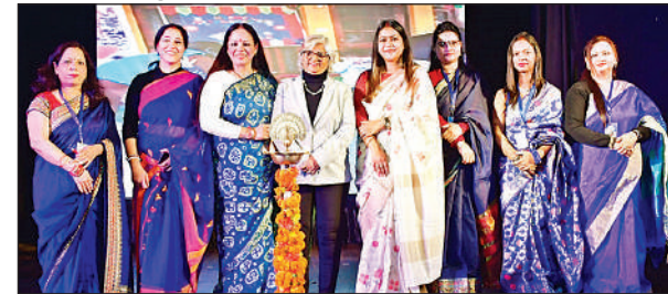
पिटर पैटर किड्ज में वार्षिकोत्सव के दौरान मौजूद शिक्षिकाएं।

विकास नगर, इंदिरा नगर, कुर्सी रोड और अन्य ब्रांचों के बच्चों ने एक साथ मिलकर जो जादू बिखेरा, वह अभिभावकों की आँखों में साफ तौर पर देखी जा सकती थी। इस अवसर