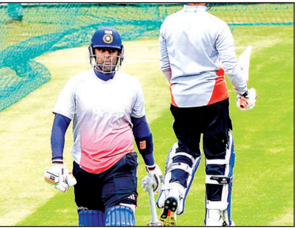
अभ्यास सत्र के दौरान कप्तान सूर्यकुमार यादव।