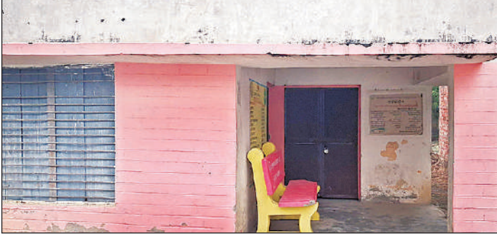
पंचायत भवन दरखा में लटकता ताला।