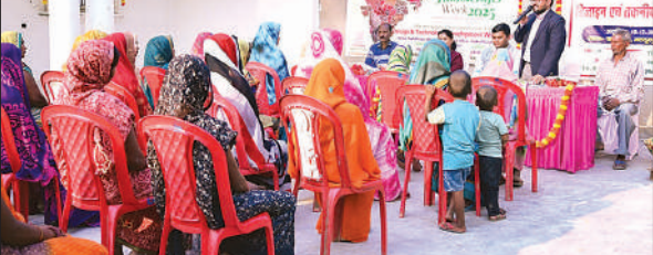
प्रशिक्षण में मौजूद लोग।