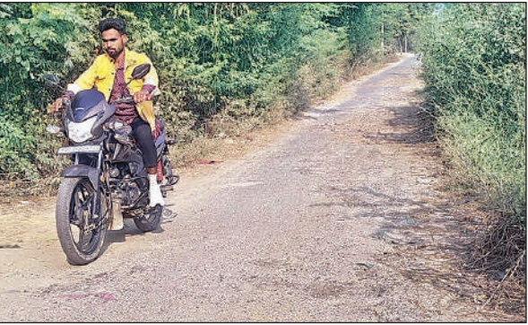
जर्जर मार्ग से निकलता बाइक सवार।

शुक्लागंज उन्नाव, अमृत विचार। नगर की आरएसजी सेवा फाउंडेशन परिवार के तत्वावधान में चतुर्थ सर्वजातीय सामूहिक वैवाहिक सम्मेलन का आयोजन रविवार को श्रीनगर स्थित सरोजा मैरिज हाल में होगा। इसमें 7 जोड़ों का विवाह विधि-विधान से संपन्न होगा। कार्यक्रम के अनुसार सुबह 11 बजे स्वागत बारात, दोपहर 1 बजे महाप्रसाद, दो बजे मंडप कार्यक्रम, शाम 5 बजे जयमाला व रात 7 बजे विदाई होगी। फाउंडेशन के पदाधिकारियों ने बताया कि सामूहिक विवाह के अगले दिन श्री श्याम बाबा संकीर्तन महोत्सव का भी आयोजन होगा। आयोजन को लेकर सभी तैयारियां पूरी कर ली गई हैं।