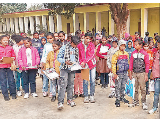
शहीद लाल बहादुर शास्त्री इंटर कॉलेज में में परीक्षा देने जाते बच्चे।