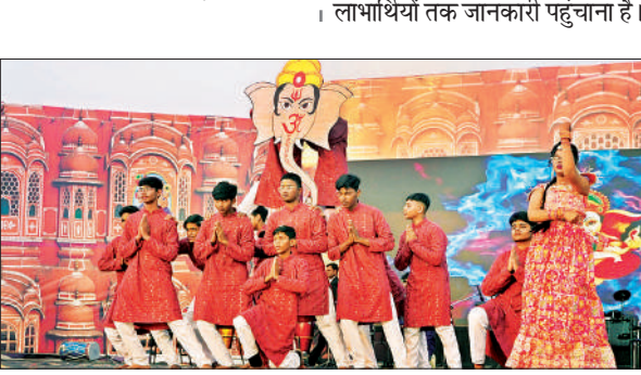
कार्यक्रम में प्रस्तुति देते छात्र-छात्राएं।