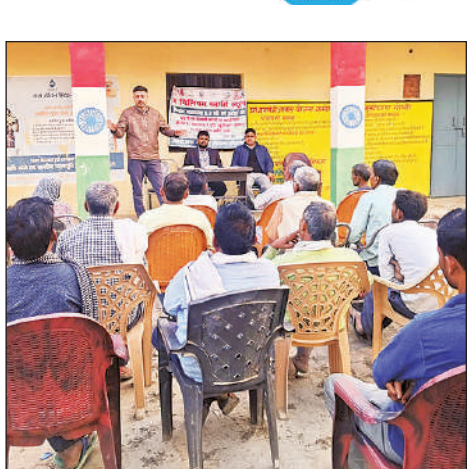
किसानों को संबोधित करते कृषि अधिकारी।