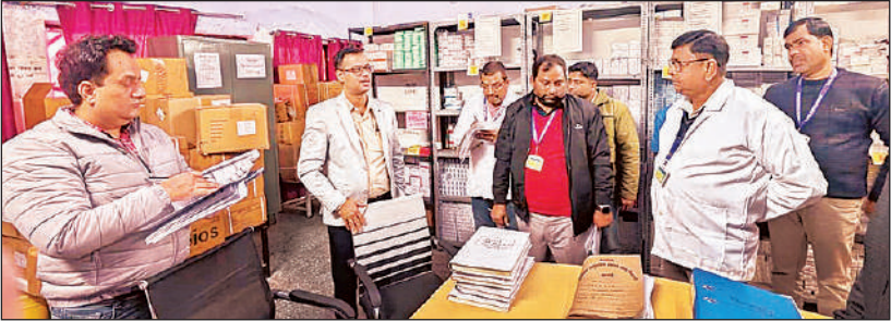
स्वास्थ्य सेवाओं का निरीक्षण करती असेसमेंट टीम।