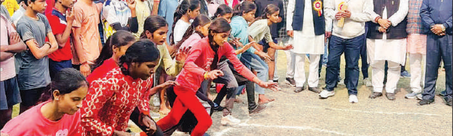
खेलकूद प्रतियोगिता में दौड़ के लिए तैयार प्रतियोगी छात्र।