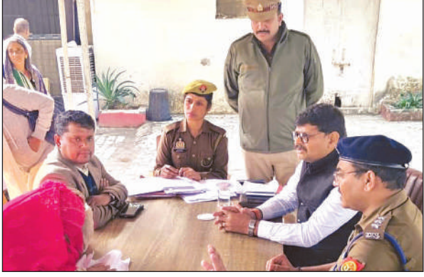
पीड़िता से जानकारी लेते सीओ सिटी व नगर मजिस्ट्रेट।

अमृत विचार। मुख्य सेविका ने जिला परियोजना कार्यालय के सहायक लिपिक के खिलाफ छेड़छाड़ करने का जो आरोप लगाया था, उसकी जांच आंतरिक समिति को सौंप दी गई है। उसकी रिपोर्ट आने के बाद ही आगे की कार्रवाई करने की बात कही जा रही है। इससे पहले परियोजना की तमाम मुख्य सेविकाएं कोतवाली पहुंची, जहां सिटी मजिस्ट्रेट व सीओ सिटी ने पीड़ित मुख्य सेविका से पूरी जानकारी इकट्ठा की। बताते चलें कि परियोजना में तैनात मुख्य सेविका ने डीएम और सीडीओ