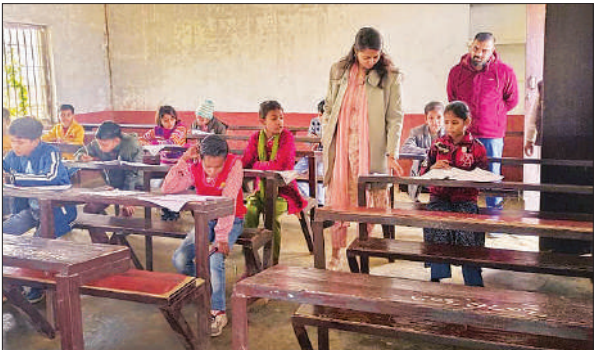
परीक्षा कक्ष का निरीक्षण करती एसडीएम।