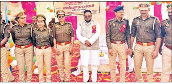
ग्रामीण मिनी स्टेडियम में आयोजित कार्यक्रम में मौजूद अतिथि व पुलिस अधिकारी।