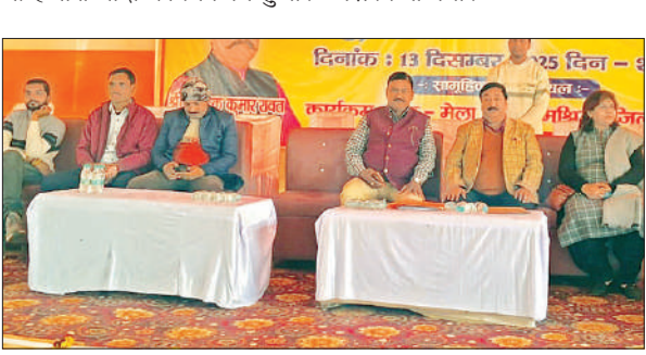
कार्यक्रम के दौरान उपस्थित अतिथिगण।

14 वादों का निपटान कर 11.00 लाख रुपये की राशि वसूल की। समस्त राजस्व न्यायालयों, जिला न्याय और पूर्ति अधिकारियों, नगर पालिकाओं और अन्य विभागों द्वारा भी हजारों वादों का निपटान हुआ।