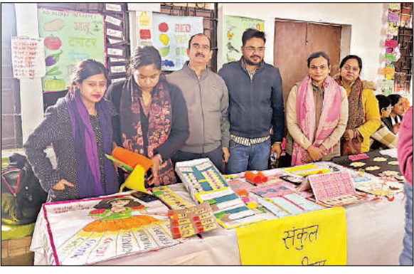
नालेज शैयरिंग प्रोग्राम में हिस्सा लेते शिक्षक-शिक्षिकाएं।