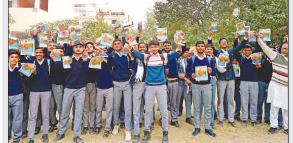
संघ साहित्य दिखाते बच्चे।