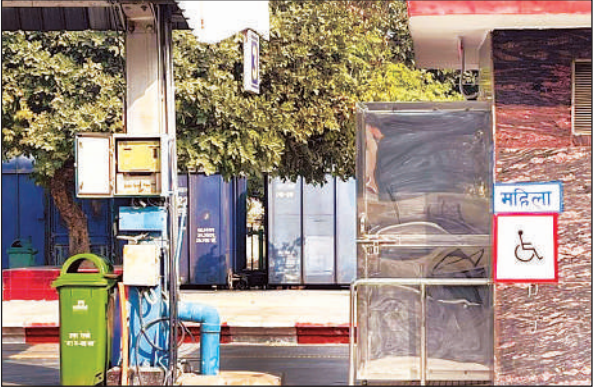
अमृत रेलवे स्टेशन परिसर पर दिव्यांगों की राह में मुसीबत बना खंभा।

ताजा मामला स्टेशन के प्लेटफॉर्म नंबर तीन का है। शाहजहांपुर छोर की ओर बने महिला दिव्यांग शौचालय के ठीक सामने टीन शेड का एक खंभा खड़ा कर दिया गया है। इससे दिव्यांग महिलाओं के लिए शौचालय तक