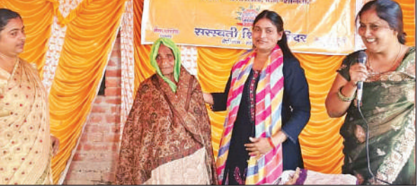
कार्यक्रम में महिलाओं को जागरूक करती महिलाएं।