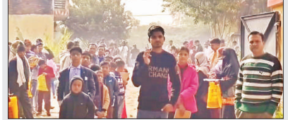
जवाहर नवोदय विद्यालय प्रवेश परीक्षा में शामिल होने के लिए खड़े बच्चे।