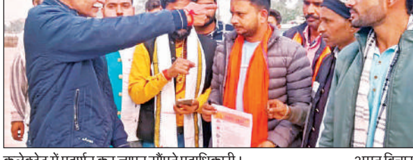
कलेक्ट्रेट में प्रदर्शन कर ज्ञापन सौंपते पदाधिकारी।