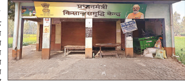
पीसीएफ किसान केंद्र पर खाद न होने से फ़ैला सन्नाट।

अमृत विचार। विकासखंड सिकंदरपुर सरोसी के मरौदा मझवाला व सुब्बा खेड़ा गांव स्थित बहुउद्देशीय प्राथमिक ग्रामीण सहकारी समिति में यूरिया खाद न होने से दो दर्जन गांवों के किसान मजबूरी में निजी दुकानदारों से निर्धारित रुपए से अधिक में खाद ले रहे हैं। मालूम हो कि क्षेत्र में ज्यादातर किसानों ने गेहूं की फसल बो दी है। अब पानी लगाकर फसल में यूरिया खाद डालने की जरूरत है। परियर, मरौदा, पनपथा, बीबीखेड़ा, सैदापुर, सुब्बाखेड़ा, करवांसा, नयाखेड़ा, मुबरखपुर, मोमिनपुर,