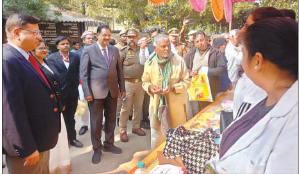
लोक अदालत का जायजा लेते न्यायमूर्ति।

ने बताया कि संघ द्वारा शिक्षकों के लिए आकस्मिक अवकाश के अतिरिक्त 30 ईएल, 14 हाफ डे सीएल, चिकित्सा सुविधा सहित अन्य व्यावहारिक मांगें उठाई जा रही हैं, ताकि विपरीत परिस्थितियों में समय से विद्यालय न पहुंच पाने पर शिक्षक इन सुविधाओं का लाभ ले सकें। बावजूद इसके अब तक इन मांगों पर निर्णय नहीं लिया गया है। उन्होंने स्पष्ट किया कि शिक्षकों को ऑनलाइन उपस्थिति से कोई आपत्ति नहीं है, लेकिन इससे पहले शिक्षकों की व्यावहारिक और आवश्यक समस्याओं का समाधान किया जाना जरूरी है।